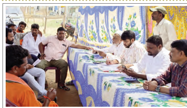
వేలంపాట సమావేశాన్ని నిర్వహిస్తున్న అధికారులు

తహసిల్దారుకు, ఛరవాణి ద్వారా సమాచారం తీసుకుంటామన్నారు.