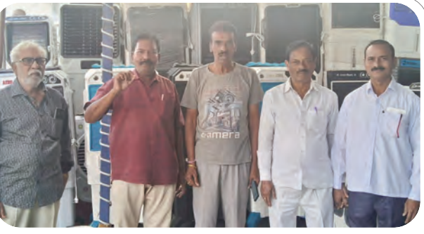
సమావేశంలో మాట్లాడుతున్న విశ్రాంత సింగరేణి సభ్యులు