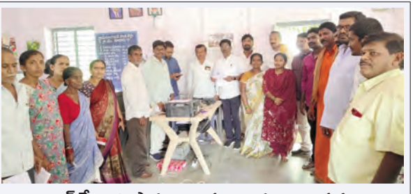
ఆధార్ కేంద్రాన్ని ప్రారంభించిన అధికారులు, నాయకులు