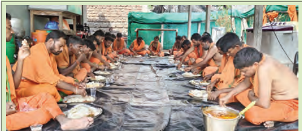
అంజనేయ దీక్ష స్వాములకు అన్నదానం నిర్వహిస్తున్న ఆలయ కమిటీ సభ్యులు