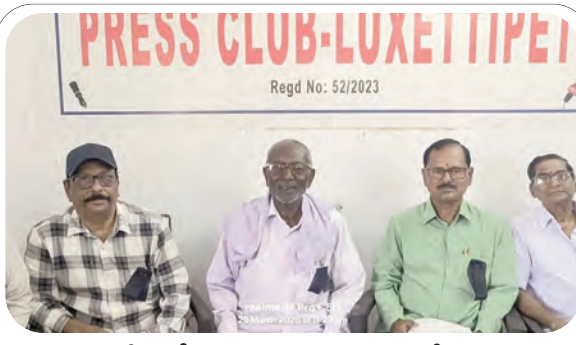
ప్రెస్ క్లబ్ లో మాట్లాడుతున్న విశ్రాంత ఉద్యోగులు