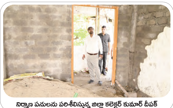
నిర్మాణ పనులను పరిశీలిస్తున్న జిల్లా కలెక్టర్ కుమార్ దీపక్

జిల్లా కేంద్రంలోని పాత మంచుర్యాల ప్రాంతంలో కొనసాగుతున్న మహిళా శక్తి భవన్ నిర్మాణ పనులను వేగవంతం చేయాలని మంచుర్యాల జిల్లా కలెక్టర్ కుమార్ దీపక్ అన్నారు. బుధవారం మహిళా శక్తి భవన్ నిర్మాణ పనులను ఆకస్మికంగా సందర్శించారు. ఈ సందర్భంగా జిల్లా కలెక్టర్ మాట్లాడుతూ మహిళల సంక్షేమం, ఆర్థిక అభివృద్ధి కోసం ప్రభుత్వం అనేక కార్యక్రమాలు చేపడుతుందని తెలిపారు. ఇందులో భాగంగా జిల్లాలోని మహిళా సమాఖ్యల కొరకు చేపట్టిన ఇందిరా మహిళా శక్తి భవన్ నిర్మాణ పనులను వేగవంతం చేసి త్వరగా పూర్తి చేసి విధంగా అధికారులు పర్యవేక్షించాలని తెలిపారు. ఈ కార్యక్రమంలో సంబంధిత అధికారులు తదితరులు పాల్గొన్నారు.