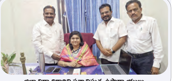
జిల్లా విద్యాధికారిని సన్మానిస్తున్న ఉపాధ్యాయులు