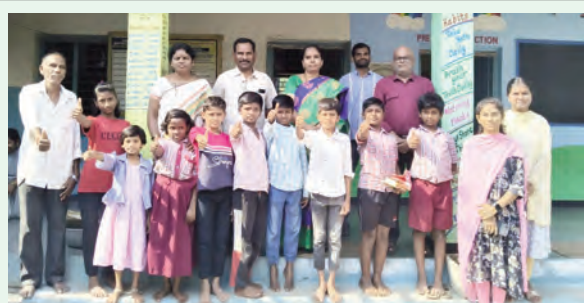
విద్యార్థులను అభినందిస్తున్న మండల విద్యాధికారి