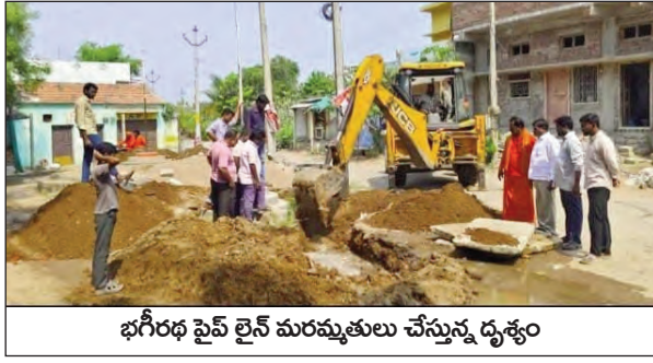
భగీరథ పైవ్ లైన్ మరమ్మతులు చేస్తున్న ధృశ్యం