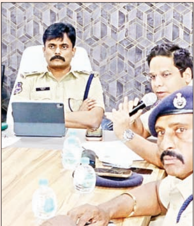
అధికారులతో సమన్వయం పాటిస్తూ ముందస్తుగా జాగ్రత్తలు తీసుకోవాలని సూచించారు. పోలీస్ అధికారులు, సిబ్బంది అందరూ తమకు కేటాయించిన విధులను బాధ్యతగా

రామనవమి, పట్టాభిషేకం ఉత్సవాలకు గణిత బందోబస్తు ఏర్పాటు అందరు తమకు కేటాయించిన విధులను బాధ్యతగా నిర్వహించాలి జిల్లా ఎస్పీ రోహిత్ రాజు సూచనలు