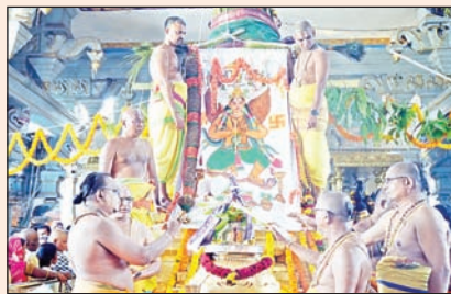
పుణ్యాహవచనం, గరుడ ఆష్టోత్తరం, గరుడ మండలాష్టకాలు నిర్వహించి గరుడ ప్రసాదాన్ని (ముద్దాన్నం) స్వామి వారి మూలవరులకు నివేదించి, అనంతరం గరుడ స్వామికి