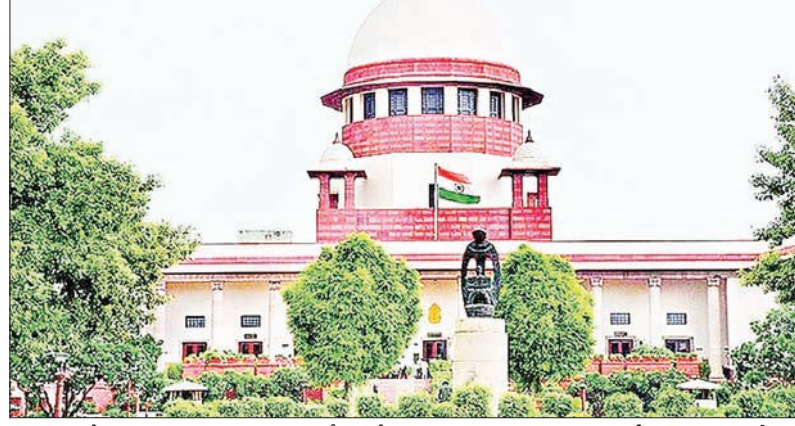
పరిస్థితుల్లో ఈ అధికారుల విధులేమిటో చర్చిద్దాం.

రెండు రోజుల క్రితం అశ్వారావుపేట మండలంలోని ఊట్లపల్లి లో ముక్కువచ్చలూరని చిన్నారలు ఇలాంటి కూల్డ్రీంక్ సేవించి అస్వస్థతకు గురవడం..కాలం చెల్లిన పానియం వల్లనే ఈ అనారోగ్యం ఏర్పడిందని ధృవపడటం.., ఆపై ప్రభాతవార్త అనేక దుకాణాల్లో పరిశీలించగా అన్నిచోట్లా గరిష్టంగా ఆరుమాసాల క్రితమే ఎక్స్ పయిర్ ఐపోయిన ఆధారాలు చిక్కడం..ఈ అంశాలను ప్రజలముందుంచడం.. అందరికీ తెలిసింది. ముఖ్యంగా జిల్లా స్థాయి ఫుడ్ ఇన్ స్పెక్టర్లు సయితం ఈ ఘోరకలిని గుడ్లప్పగించి చూస్తున్నారే గానీ..కంటితుడుపు కోసమైనా కడలకపోవడంతో వారి పాత్రవైనా అనుమానాలు కలుగుతున్నాయి. ప్రజలకు అనేక మార్గాల్లో అందించబడే ఆహారపానియాల విషయంలో కేంద్ర రాష్ట్ర ప్రభుత్వాలు చాలా నియమ నిబంధనలు విధించిన విషయాన్ని ఇంతకుముందే చెప్పుకున్నాం. ఎందుకంటే ఆహారంతో పాటు సమాజ ఆరోగ్యమూ ప్రధానమైనందున కఠిన చట్టాలను అమలు చేస్తున్నాయి. ఇలాంటి పరిస్థితిలో భద్రాద్రి కొత్తగూడెం జిల్లా "ఫుడ్ సేఫ్టీ విభాగం" తన బాధ్యతను పూర్తిగా వదిలేసిందనే విమర్శలు సర్వత్రా వ్యక్తమవుతున్నాయి. గడచిన మూడురోజులుగా అశ్వారావుపేట మండలంలో వెలుగుచూసిన కూల్డ్రీంక్ కుంభకోణం రాష్ట్ర వ్యాప్త సంచలనమైన..ఇక్కడి అధికారులకు లెక్కలేకుండా పోయింది. మరి అనుమానాలు ఎందుకు రావు. అనేక హాటళ్లలో ఆహార నాణ్యత పరిశుభ్రత అంశంలోనూ ఇదే విమర్శలను వీళ్ళు ఎదుర్కొంటున్నారు. రేపటినుంచి డి.సి.మీ.దా వరకు కఠినాలను అందిస్తాం. సరే ప్రస్తుతానికి హోటళ్ళు విషయాన్ని కాస్త పక్కన పెడితే..కాలం చెల్లిన కూల్డ్రీంక్ విక్రయాలు విపులవిడిగా పేట్రేగిపోతున్న సంగతి బయటపడిన ప్రస్తుత