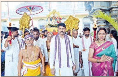
ఈ క్రతువులో భాగంగా ఉత్సవమూర్తులను, యాగశాల నుంచి గరుడపటాన్ని ధ్వజస్థంభం వద్దకు తీసుకుని విశ్వకేసినపూజ,

నయనానందకరంగా అగ్నిప్రతిష్ఠ, ధ్వజారోహణం గరుడప్రసాదం స్వీకరించేందుకు అధిక సంఖ్యలో హాజరైన మహిళా భక్తులు నేడు ఎదుర్కోలు ఉత్సవం పట్టు వస్త్రాలు సమర్పించనున్న దేవాదాయ శాఖ ముఖ్య కార్యదర్శి