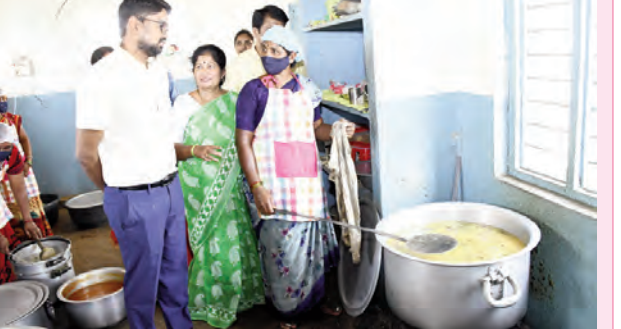
విద్యార్థులకు అందించే ఆహారాన్ని పరిశీలిస్తున్న జిల్లా కలెక్టర్, అధికారులు

వనపర్తి, మార్చి 25 ప్రభాతవార్త: ప్రభుత్వ పాఠశాలల్లో విద్యార్థులకు నాణ్యమైన ఆహారం అందించాలని జిల్లా కలెక్టర్ అదర్స్ సురభి ఆదేశించారు. బుద్ధవారం జిల్లా కలెక్టర్ పెట్టేరు మండలంలోని కన్నారా గాంధీ బాలికా విద్యాలయాన్ని ఆకస్మికంగా సందర్శించారు. ఈ సందర్భంగా పాఠశాలలోని వంటగది ఆహార పదార్థాల నిల్వ గదిని పరిశీలించి, స్టాక్ రిజిస్ట్రేషన్ తనిఖీ చేశారు. మేన్ కమిటీ విద్యార్థులతో మాట్లాడిన కలెక్టర్, పాఠశాలకు సరుకులు వచ్చిన ప్రతిసారి రిజిస్ట్రేషన్ మేన్ కమిటీ విద్యార్థులు సంతకం చేయాలని సూచించారు. విద్యార్థులకు నాణ్యమైన ఆహారం అందించాలని సిబ్బందికి ఆదేశించారు. అలాగే ఆహార పదార్థాల గడువు తేదీలను ఎప్పటికప్పుడు పరిశీలించాలని సూచించారు. అనంతరం ఎస్.ఎస్.సీ పరీక్షలకు హాజరుతున్న విద్యార్థులతో కలెక్టర్ మాట్లాడి, బాగా సిద్ధమై పరీక్షలను మంచిగా రాాయాలని ప్రోత్సహించారు. మంచిమార్కులు సాధించి పాఠశాలకు, జిల్లాకు మంచి పేరు తీసుకురావాలని సూచించారు. పీఎంఐ పథకం కింద పాఠశాలలో చేపట్టిన వసతిపై సమీక్ష నిర్వహించిన కలెక్టర్, పాఠశాలకు అవసరమైన అంశాలపై వెంటనే ప్రతిపాదనలు పంపించాలని అధికారులను ఆదేశించారు. -4లో..