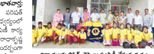
విద్యార్థులకు సాఫ్ట్వేర్ డ్రస్సులు పంపిణీ చేస్తున్న దృశ్యం