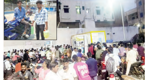
జడ్పీసీ పెట్రోల్ బంక్ వద్ద బారులు దీలిన వాహనదారులు

అవసరం లేకున్నా.. చాలామంది వాహనదారులు పానిక్ అవుతున్నట్లు తెలుస్తున్నది. పెట్రోల్ కొరత ఉంది బంకులు బండ్ చేస్తారు అన్న వార్తలు సోషల్ మీడియాలో వైరల్ కావడంతో అంతా ఒక్కసారిగా పెట్రోల్ బంకుల వద్దకు చేరుకోవడంతో బంకుల వద్ద రద్దీ ఏర్పడుతుంది. ఎవరు అందోళన చెందవద్దని పెట్రోలు డిజిల్ నిల్వలు సరిపడా ఉన్నాయని, అంతా ఒక్కసారిగా బంకుల వద్దకు చేరుకోవడంతో నిర్వాహకులు నో స్టాక్ బోర్డు పెట్టాల్సిన పరిస్థితి ఏర్పడు తుందని అధికారులు చెబుతున్నారు.