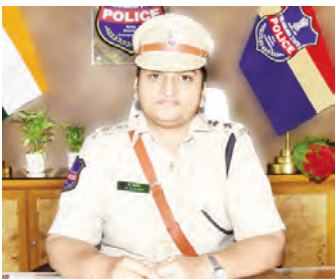
భయభ్రాంతులకు గురిచేసే చర్యలకు పాల్పడేవారైతే కఠిన చర్యలు తీసుకుంటామని హెచ్చరించారు.

అవసరానికి మించి ఇంధనం నిల్వ చేసుకోవద్దని సూచించారు. అలా చేయడం వల్ల ఇతరులకు ఇబ్బందులు కలుగుతాయని హెచ్చరించారు. సోషల్ మీడియాలో ప్రచారం అవుతున్న అసత్య సమాచారం, వదంతులను నమ్మువద్దని, నిర్ధారణ చేయని సమాచారాన్ని ఆశీర్వాదించే పనిమీదందం ద్వారా గందరగోళం సృష్టించవద్దని ప్రజలకు విజ్ఞప్తి చేశారు. సాధారణ అవసరాల మేరకే ఇంధనాన్ని వినియోగించుకోవాలని, ఎలాంటి భయాం దోళనలకు గురికావద్దని కోరారు. జిల్లాలో శాంతిభద్రతలను కాపాడేందుకు పోలీసులు ఎల్లప్పుడూ ఆప్రమత్తంగా ఉన్నారని తెలిపారు. వదంతులు వ్యాప్తి చేసేవారెవరైతే, ప్రజలను భయభ్రాంతులకు గురిచేసే చర్యలకు పాల్పడేవారైతే కఠిన చర్యలపై అసహనం వ్యక్తం చేశారు.