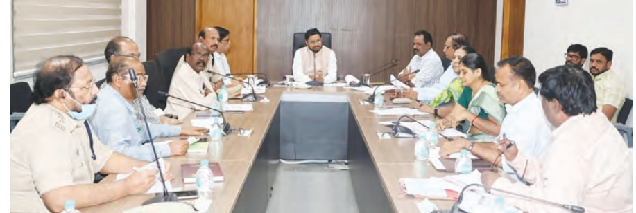
సమావేశంలో అధికారులు అధికారులు జారీ చేస్తున్న కలెక్టర్