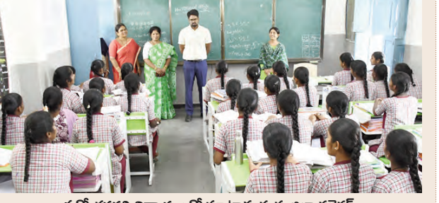
పదో తరగతి విద్యార్థులతో మాట్లాడుతున్న జిల్లా కలెక్టర్