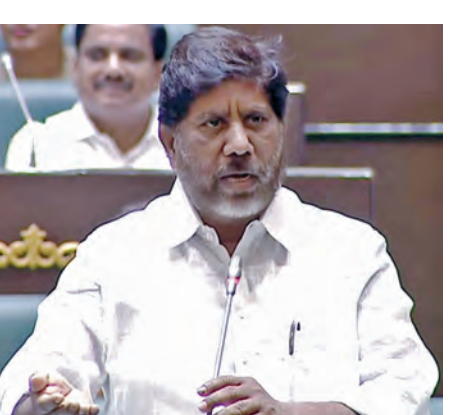
చేసేందుకు గతంలో లాగా నెలల తరబడి వేసి చూడకుండా, వారానికోసారి బిల్లులు చెల్లించేలా నిర్వహించారు. అదేలా ఇంకా చేశామన్నారు. "ఇల్లు కట్టండి.. బిల్లు తీసుకోండి" అనే నినాదంతో లబ్ధిదారులకు వెన్నుదన్నుగా నిలుస్తున్నామని, ప్రభుత్వంపై ఆర్థిక భారం ఉన్నప్పటికీ పేదల కోసం వెనకడుగు వేయలేదన్నారు.