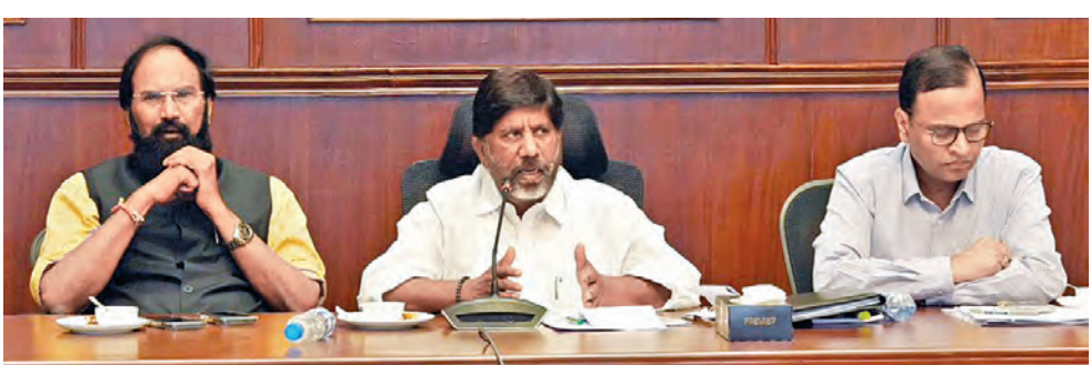
బుధవారం హైదరాబాద్ లో పెట్రోలు, గ్యాస్ పై నిర్వహించిన సమీక్షలో డి.సి.ఎం భట్టి, మంత్రి ఉత్తమ్, సిఎస్