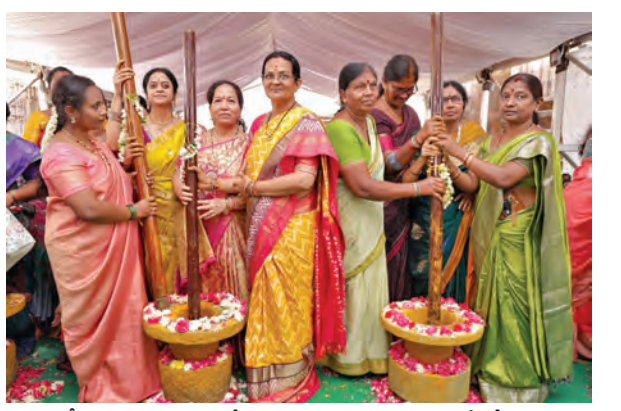
సీతారాముల కల్యాణోత్సవానికి తలంజ్రాల తయారీ కోసం

● వైభవంగా భక్తి వాతావరణంలో వారిద్రా ఘటనం ● సిఎం పర్యటన ఏర్పాట్లను పరిశీలించిన టిటిడి జెజిజి