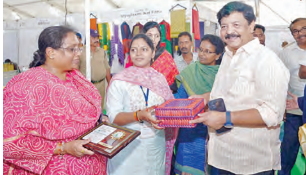
'ఉద్యమిటు ఉ ఉన్నట్' ఎగ్జిజివ్ 2026లో