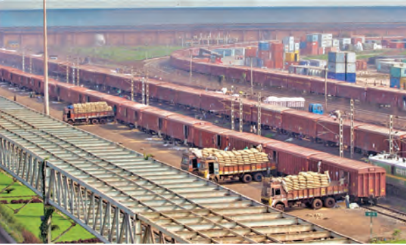
సరుకు రవాణా వినియోగదారులను ఆకర్షించడానికి హాతిక సదుపాయాల మెరుగుదల, టెర్మినల్స్లో పని వాతావరణం, గూడ్స్ షెడ్ల అభివృద్ధి వంటి అంశాలపై ప్రత్యేక దృష్టి సారించబడింది. అదనంగా, వినియోగదారుల అవసరాలను సమానుసారం పరిష్కరించేందుకు అధికారులు నిరంతరం సంప్రదింపులు జరుపుతున్నారు. సాంప్రదాయ

వ్యవస్థలో ప్రధాన వస్తువు అయిన బోగ్గ 66.878 మిలియన్ టన్నులు, సిమెంట్ 37.572 మిలియన్ టన్నులు, ఇనుప ఖనిజం 8.620 మిలియన్ టన్నులు, ఎరువులు 8.038 మిలియన్ టన్నులు, ఉక్కు కర్మాగారాలకు ముడి పదార్థాలు 4.810 మిలియన్ టన్నులు, ఆహార ధాన్యాలు 6.225 మిలియన్ టన్నులు, కంప్లెక్స్ 2.561 మిలియన్ టన్నులు, పెట్రోలియం (పెట్రోలియం అయిల్) 1.223 మిలియన్ టన్నులు, ఇతర వస్తువులు 8.349 మిలియన్ టన్నులు, మొత్తంగా 144.244 మిలియన్ టన్నులు దక్షిణ మధ్య రైల్వే మొత్తం సరుకు రవాణా జరుగుతుంది. దక్షిణ మధ్య రైల్వే సిబ్బంది అసాధారణ సమిష్టి కృషి, ఆర్థిక విభాగాల మధ్య సమర్థవంతమైన సమన్వయం ఫలితంగా రికార్డు స్థాయి పనితీరు సాధించారు.