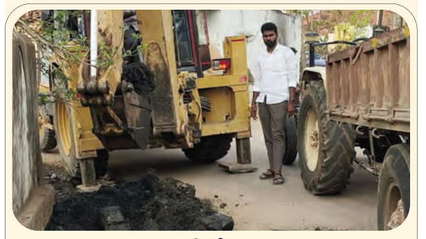
నాకాల పూడిక తీస్తున్న దృశ్యం