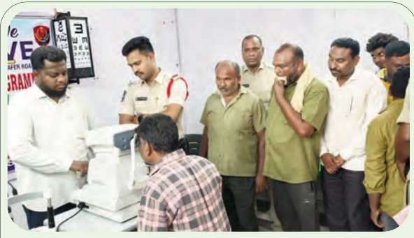
కంటి వైద్య పరీక్షలను పరిశీలిస్తున్న ఎస్ఐ