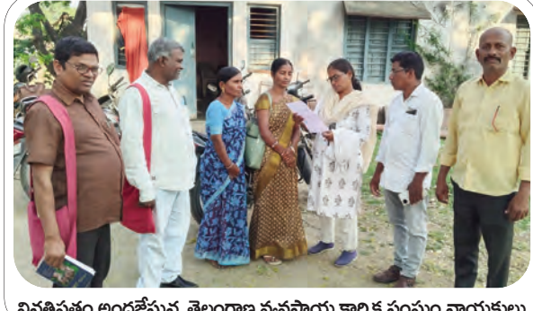
వినతిపత్రం అందజేస్తున్న తెలంగాణ వ్యవసాయ కార్మిక సంఘం నాయకులు