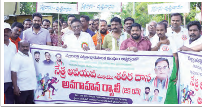
బెల్లంపల్లి, మార్చి 26, ప్రభాతవార్త