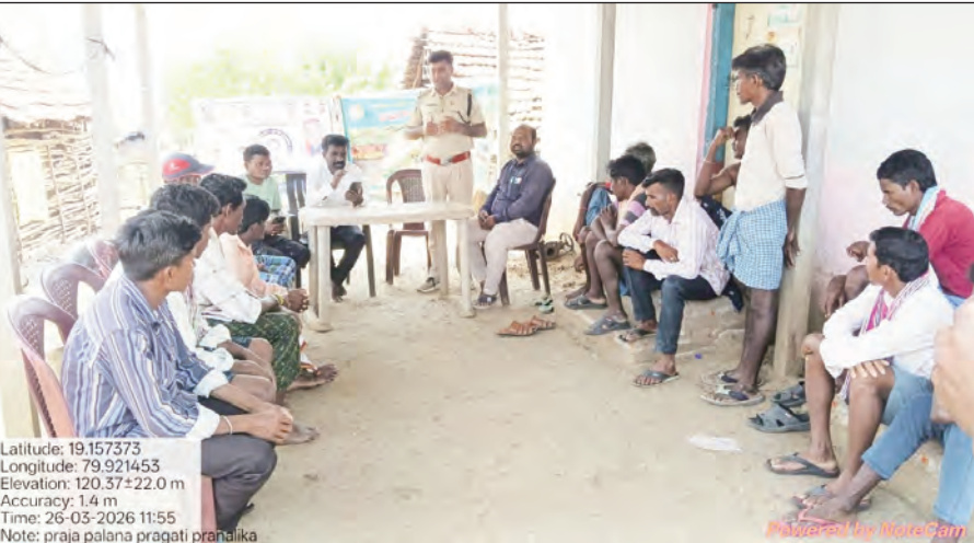
Latitude: 19.157373 Longitude: 79.921453 Elevation: 120.37+22.0 m Accuracy: 1.4 m Time: 26-03-2026 11:55 Note: praja palana pragati pranika