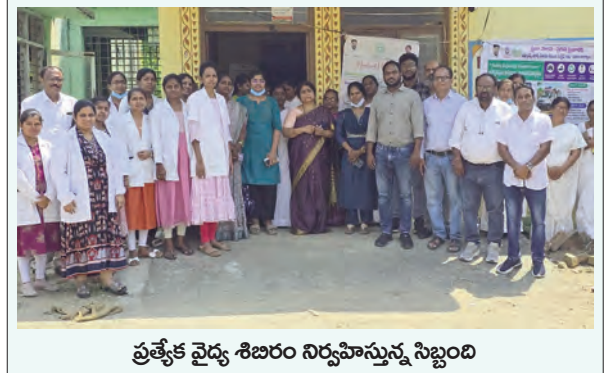
ప్రత్యేక వైద్య శిబిరం నిర్వహిస్తున్న సిబ్బంది