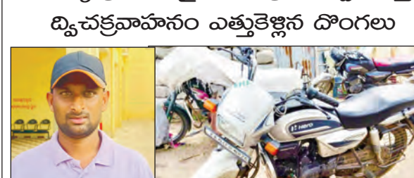
ఉరవకొండ, మార్చి 26 ప్రభాతవార్త