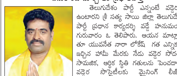
ఉరవకొండ, మార్చి 26 ప్రభాతవార్త