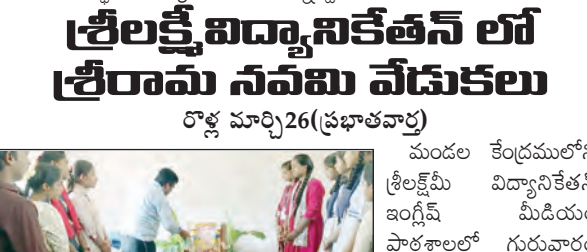
శ్రీరామ నవమి వేడుకలు నిర్వహించిన దృశ్యం

పరికరాలను అవహించారు. అందిన ఫిర్యాదు మేరకు పోలీసులు సంఘటన స్థలికి సందర్శించి కేసు దర్యాప్తు చేస్తున్నారు.