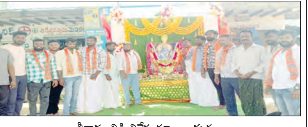
శ్రీరామనికీ విశేష పూజల దృశ్యం

అమరాపురం మార్చి 26 ప్రభాతవార్త మండల కేంద్రంలోని దక్షిణ గొట్టె హాల్లో నవమి యాదవ యువక సంఘం ఆధ్వర్యంలో గురువారం శ్రీరామనవమి వేడుకలను ఘనంగా నిర్వహించారు.