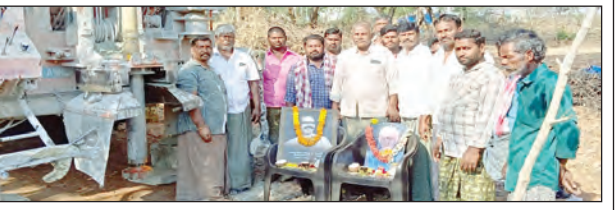
బోరు వేస్తున్న దృశ్యం

రామగిరి, మార్చి 26 ప్రభాతవార్త మండలంలోని వెంకటాపురం గ్రామంలో అగ్రటి సస్య సీఎస్ఆర్ నిధుల ద్వారా అంగునీటి బోరును గురువారం వేయించారు.