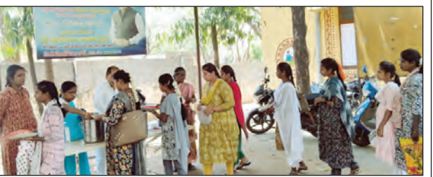
వారి వేలం పాట నిర్వహిస్తున్న దృశ్యం

వారి వేలం పాట నిర్వహిస్తున్న దృశ్యం కొత్తవెరువు మేజర్ వసాయిల్లీ కార్యాలయం గత సంవత్సరం కన్నా ఈ సంవత్సరం సర్కారీ వారి వేలం పాటలకు పెరిగింది.