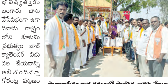
పాలాభిషేకం కార్యక్రమంలో పాల్గొన్న బిజెపి శ్రేణులు