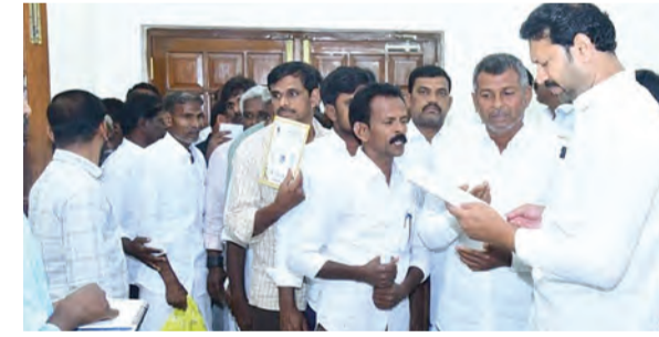
రజత కాంతులతో దగదగ