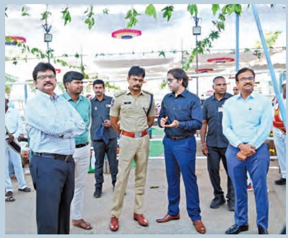
భద్రాచలంలో గురువారం ఏర్పాటు చేసిన పరిశీలిస్తున్న అధికారులు