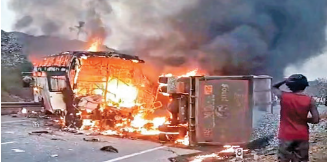
గురువారం తెల్లవారు జామున మార్కాపురంలో దగ్ధమవుతున్న బస్సు, టిప్పర్

మొయినాబాద్ డ్రగ్స్ కేసు: సిట్ అదుపులో డాక్టర్ ప్రపోజ్ చేసిన ప్రాఫెసర్ ను చెప్పుతో కొట్టిన విద్యార్థిని