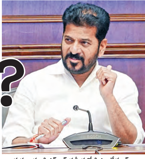
గురువారం సిఎస్ఆర్ సమీక్షలో సిఎం రేవంత్

పరిశ్రమలు తెలంగాణలో.. ఫండ్స్ మరోచోట ఖర్చుచేస్తామంటే ఎలా?