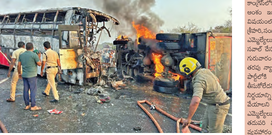
గురువారం మార్కాపురంలో దర్శనమవుతున్న బస్సు, బీచ్పర్ల మంటలుబూతును పైకి సిబ్బంది