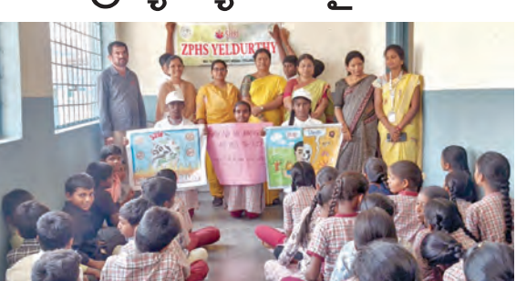
డ్రగ్స్ పై అవగాహన కల్పిస్తున్న ఉపాధ్యాయులు