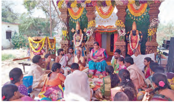
వేంకటేశ్వర కళ్యాణ దృశ్యం