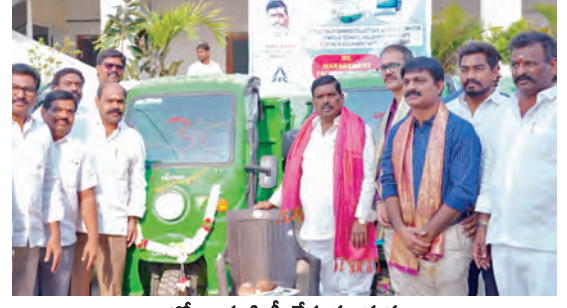
ఆలోచన పంపిణీ చేస్తున్న దృశ్యం