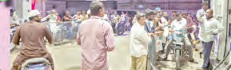
పెట్టోల్ బంకోల్ పెట్టోల్ కోసం డబ్బులతో పట్టుకుని వేప చూస్తున్న వాహినీదారులు

-ఇబ్బందుల్లో సామాన్య జనం -బంకుల వద్ద పడిగాపులు