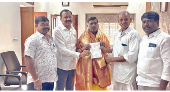
ఎమ్మెల్యేకు ఆహ్వాన పత్రం అందిస్తున్న దృశ్యం