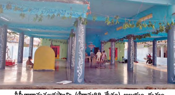
శ్రీరామామచంద్రస్వామి (శ్రీరామగిరి శైలం) ఆలయం దృశ్యం

-నేటి నుండి మూడు రోజులపాటు బ్రహ్మోత్సవాలు