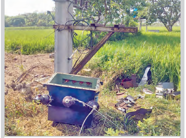
ట్రాన్స్ ఫార్మర్లను ధ్వంసం చేసిన దుండగులు

చిన్నశంకరపేట, మార్చి 26, ప్రభాతవార్త: ట్రాన్స్ ఫార్మర్లను గుర్తు తెలి యని దుండగులు ధ్వంసం చేసి అయిల్, రాగి తిగను ఎత్తుకెళ్లిన సంఘటన మండల పరిధి గవ్వలపల్లి వారస్థాలో గురువారం చోటు చేసుకుంది. ఉదయం పంట పోలకుల సీక్రెట్ బెట్టానికి వెళ్లిన రైతులు బోరు మోటారును నడవక పోవడంతో ట్రాన్స్ ఫార్మర్ వద్దకు వెళ్లి గమనించగా గుర్తు తెలియని వ్యక్తులు ధ్వంసం చేసి అందులోని అయిల్, రాగి తిగను ఎత్తుకెళ్లినట్లు గుర్తించారు. విద్యుత్ శాఖ సిబ్బందికి సమాచారం అందించగా వారు పోలీసులకు ఫిర్యాదు చేసినట్లు తెలిపారు.