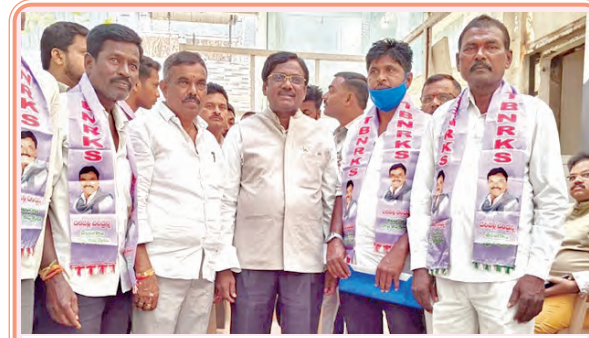
కార్మికశాఖ, జిల్లా ఇన్చార్జి మంత్రిని కలిసిన డిఎన్ఆర్ఎస్ ప్రతినిధులు

సిద్దిపేట, ప్రభాతవార్త ప్రతినిధి: సిద్దిపేట నియోజకవర్గంలోని చెరువులు, కుంటల మరమ్మత్తులకు రూ.1 కోటి 8 లక్షల 85 వేల నిధులు మంజూరు చేసినట్లు మాజీ మంత్రి, ఎమ్మెల్యే తనీషీ కుమార్ తెలిపారు. గురువారం ఆయన మాట్లాడుతూ సిద్దిపేట రూరల్ వండలం ఇండ్రగూడెం, పల్లెకుంట, ముంటి కుంటల పునరుద్ధరణకు రూ.48 లక్షల 28 వేల నిధులు మంజూరు చేసినట్లు తెలిపారు. మిట్టపల్లి గుండ్ల చెరువు ఫీడర్ ఛానల్ వద్ద నూతన ట్రిప్లె నిర్మాణానికి రూ.47 లక్షల 20 వేల మంజూరు చేసినట్లు తెలిపారు. నంగునూర్ మండలం ముంద్రాము గ్రామం మెరుపు కుంట ఇటీవల వరాలకు కుంటలు బెట్టు తినడంతో శాశ్వతంగా మరమ్మత్తు చేయాలని రైతులు తన దృష్టికి తెచ్చారని తెలిపారు. మెరుపుకుంట శాశ్వత మరమ్మత్తునకు రూ.12 లక్షల 45 వేల మంజూరు చేసినట్లు తెలిపారు. పనులు త్వరగా ప్రారంభించి పూర్తి చేయడానికి చర్యలు తీసుకోవడం జరుగుతుందన్నారు.