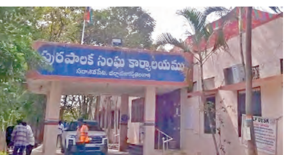
సదాశివపేట మున్సిపల్ కార్యాలయం