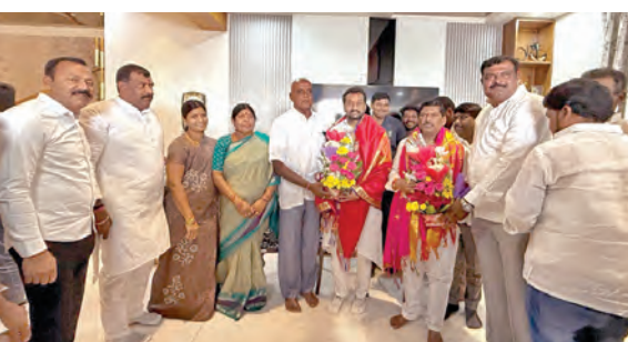
పుష్పగుప్తం ఇచ్చి ఆహ్వానిస్తున్న దృశ్యం