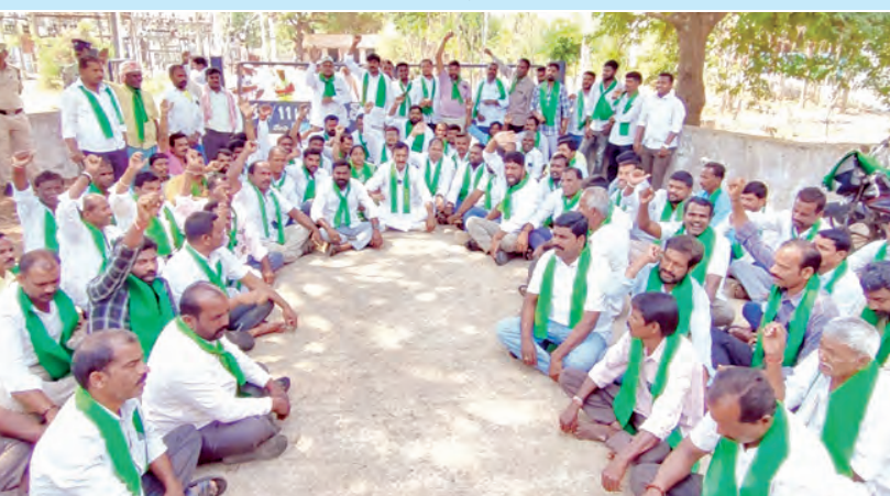
మేదినిపూర్ నెట్ స్టేషన్ ముందు దర్మా నిర్వహిస్తున్న బిఆర్ఎస్ నాయకులు

వల ద్వారా నీటిని చెరువులకు, కుంటలకు పంపిణీ చేశారని గుర్తు చేశారు. రైతులను రాజులను చేసిన ఘనత కెసిఆర్ కు దక్కతుందన్నారు. కానీ కాంగ్రెస్ ప్రభుత్వం అధికారంలోకి వచ్చిన రైతులను నిదా ముంతుతుందని పేర్కొన్నారు. ఇప్పటికైనా ఇచ్చిన హామీలను వెరవేర్చి రైతులను ఆదుకోవాలని ఆయన డిమాండ్ చేశారు. ఈ కార్యక్రమంలో రైతు బంధు సమితి రాష్ట్ర తదితరులు పాల్గొన్నారు.