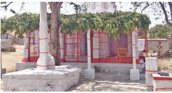
శ్రీరామాను కళ్యాణోత్సవానికి ముస్తాబైన విరలేశ్వరాలయం