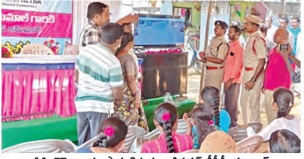
సిసి కెమెరాలను ప్రారంభిస్తున్న అడిషనల్ డీసీసీ కుశాల్యర్

వల ద్వారా నీటిని చెరువులకు, కుంటలకు పంపిణీ చేశారని గుర్తు చేశారు. రైతులను రాజులను చేసిన ఘనత కెసిఆర్ కు దక్కతుందన్నారు. కానీ కాంగ్రెస్ ప్రభుత్వం అధికారంలోకి వచ్చిన రైతులను నిదా ముంతుతుందని పేర్కొన్నారు. ఇప్పటికైనా ఇచ్చిన హామీలను వెరవేర్చి రైతులను ఆదుకోవాలని ఆయన డిమాండ్ చేశారు. ఈ కార్యక్రమంలో రైతు బంధు సమితి రాష్ట్ర తదితరులు పాల్గొన్నారు.