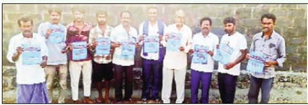
.... కోదాడ, మార్చి 26, ప్రభాతవార్త :