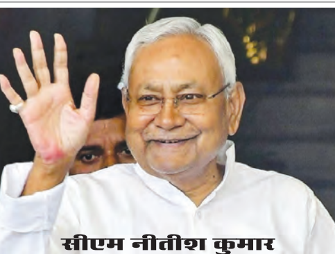
सीएम नीतीश कुमार

मंगवाया और ध्यान से उसे पढ़ा। पोस्टर पढ़ते ही उनके चेहरे पर हल्की मुस्कान आ गई, जिसमें भावनाएं साफ झलक रही थीं। इस मुस्कान ने वहां मौजूद लोगों के साथ-साथ सोशल मीडिया पर भी अलग-अलग प्रतिक्रियाएं पैदा कर दीं, जहां लोग इसे भावुक और खास पल बता रहे हैं।