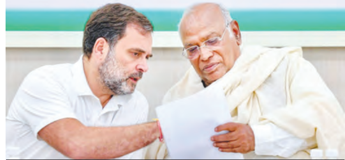
राहुल गांधी और मल्लिका अर्जुन खड़गे