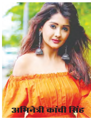
अभिनेत्री कांची सिंह

भोपाल, 26 मार्च (एजेंसियां)। वुमन पावर अवॉर्ड-2026 सेरेमनी में भोपाल आई टीवी अभिनेत्री कांची सिंह ने आयोजकों और रेस्टोरेट संचालक पर बदसलूकी के आरोप लगाए हैं। उनका कहना है कि उन्हें मुख्यमंत्री डॉ. मोहन यादव का नाम लेकर धमकाने की कोशिश भी की गई। हालांकि, आयोजकों और रेस्टोरेट संचालक ने इन आरोपों को खारिज कर दिया है। यह कार्यक्रम 14 मार्च को हुआ था। कांची सिंह ने दैनिक भास्कर से बातचीत में अपनी बात रखी। कांची सिंह ने कहा कि इवेंट के दौरान उन्हें कोई परेशानी नहीं हुई। कार्यक्रम समय पर पूरा हुआ और भुगतान भी समय पर