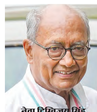
नेता दिग्विजय सिंह

लखनऊ, 26 मार्च (एजेसियां)। कांग्रेस से राज्यसभा सदस्य और दो बार मध्य प्रदेश के पूर्व मुख्यमंत्री दिग्विजय सिंह ने गुरुवार को दिन में अयोध्या में हनुमान गढ़ी के साथ रामलला मंदिर में दर्शन-पूजन किया। दिगी राजा के नाम से विख्यात दिग्विजय सिंह अयोध्या में भव्य राम मंदिर का निर्माण होने के बाद पहली बार रामलला का दर्शन करने पहुंचे थे। दर्शन-पूजन के बाद मंदिर प्रांगण से बाहर आए कांग्रेस नेता दिग्विजय सिंह ने कहा कि जब प्रभु का बुलावा आता है तो हर व्यक्ति आ जाता है इसलिए जब मुझे बुलावा आया, तो मैं उपस्थित हो गया।