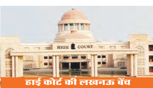
हाई कोर्ट की लखनऊ बेंच