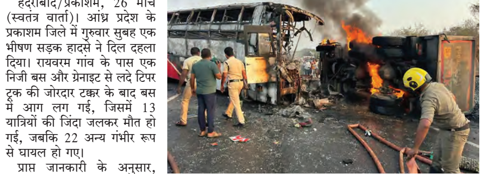
डंपर से टकराकर बाद बस पूरी तरह से जल गई। पैसेंजर्स को बस से बाहर निकालने का समय भी नहीं मिला।

वाला है। इसमें राज्यों का सहयोग जरूरी है। हमें टीम इंडिया की तरह काम करना होगा। वहीं, सरकार ने देश में पेट्रोल, डीजल और एलपीजी (रसोई गैस) की कमी की खबरों को पूरी तरह से खारिज कर दिया है। पेट्रोलियम और प्राकृतिक गैस मंत्रालय ने बयान जारी कर कहा कि दुनिया में कुछ भी हो जाए, भारत के पास 60 दिन का कच्चा तेल और ऑयल रिजर्व है। सरकार ने सोशल मीडिया पर चल रही किल्लत की खबरों को 'भ्रामक और जानबूझकर फैलाया गया प्रोपेगैंडा' बताया है, जिसका मकसद बाजार में 'पैनिक बाइंग' शुरू करना है। मंत्रालय ने कहा कि शॉर्टेज की अफवाह फैलाने वालों पर कार्रवाई की जाएगी। जम्मू-कश्मीर के मुख्यमंत्री उमर अब्दुल्ला ने जम्मू में मीडिया से बात करते हुए कहा कि अफसोस की बात ये है कि जब हुकूमत की तरफ से बात होती है तो उसको कोई नहीं सुनता लेकिन अफवाहों पर सब लोग यकीन करते हैं।