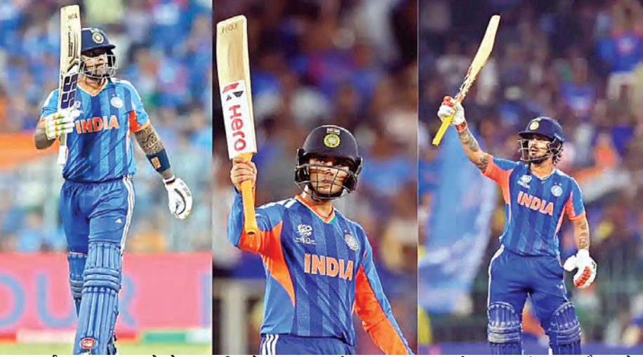
सूर्यकुमार यादव को दो पायदान का फायदा आईसीसी मैनस क्रिकेट की ताजा रैंकिंग के अनुसार भारतीय टी20

मुंबई, 26 मार्च (एजेंसियां)। आईपीएल 2026 से पहले इंटरनेशनल क्रिकेट काउंसिल ने मैनस क्रिकेट की ताजा रैंकिंग जारी की। ताजा रैंकिंग के अनुसार भारतीय बल्लेबाजों का फिर से एक बार जलवा बरकरार है। टी20 के सलामी बल्लेबाज अभिषेक शर्मा और विकेटकीपर बल्लेबाज ईशान किशन शीर्ष दो में काबिज हैं। वहीं, टी20 के फाइनल में बिना खाता खोले आउट हुए कप्तान सूर्यकुमार यादव को दो पायदानों का फायदा हुआ है। वहीं, गेंदबाजों की रैंकिंग की बात करें तो टीम इंडिया के मिस्ट्री स्पिनर वरुण चक्रवर्ती 740 रैंकिंग अंकों के साथ दूसरे नंबर पर और पहले स्थान पर अफगानिस्तान के पूर्व कप्तान राशिद खान काबिज हैं।