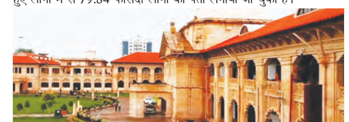
यूपी पुलिस ने लगा लिया 95 हजार लोगों का पता

लखनऊ, 26 मार्च (एजेसियां)। उत्तर प्रदेश में लापता एक लाख से अधिक लोगों को लेकर योगी सरकार ने इलाहाबाद हाईकोर्ट के लखनऊ बेंच की सुनवाई में बड़ा दावा किया है। सरकार ने दावा किया है कि लापता लोगों को तलाशने में यूपी पुलिस करीब 80 फीसदी तक सफल रही है। दरअसल, हाईकोर्ट लखनऊ बेंच में लापता लोगों के संबंध में स्वतः संज्ञान लिया था और फिर उससे संबंधित याचिका पर सुनवाई की। सुनवाई के दौरान राज्य सरकार की ओर से दावा किया गया 1 जनवरी 2024 से 17 मार्च 2026 तक लापता हुए लोगों में से 79.84 फीसदी लोगों का पता लगाया जा चुका है।