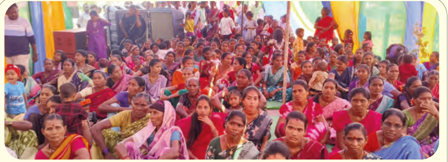
సీతారాముల కళ్యాణానికి హాజరైన భక్తులు