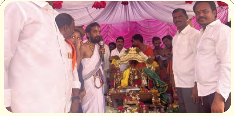
జాం గ్రామంలో భక్తిశ్రద్ధల మధ్య శాస్త్రోక్తంగా జరుగుతున్న సీతారాముల కల్యాణోత్సవం

బెజ్జూర్ మండలంలోని పలు గ్రామాల్లో శుక్రవారం శ్రీరామనవమి సందర్భంగా శ్రీ సీతారాముల కల్యాణ మహోత్సవం అంగరంగ వైభవంగా జరిగింది. మండల కేంద్రంలో పాటు కుష్టపల్లి, ఎల్గుపల్లి, సిద్ధాపూర్, లంబడి గూడ, ఊటూర్ రంగవల్లి, కుకుడ, పాపన్నపేట్, తలాయి, వెలుగెల్లి, గెరెగూడ, సొమిని, సుశ్రీర్, తదితర గ్రామాల్లో గ్రామస్థులు సీతారాముల కల్యాణాన్ని ఎంతో ఉత్సాహంగా నిర్వహించారు. దీంతో మండలంలోని ఆయా గ్రామాల్లో ఆధ్యాత్మిక శోభ సంతరించుకుంది. గ్రామాల్లో సీతారాముల ఉత్సవ విగ్రహాలతో ఊరేగింపు నిర్వహించారు. కొన్ని గ్రామాల్లో హనుమాన్ దీక్ష దారులు ఈ వేడుకల్లో పాల్గొని జై శ్రీరామ్ నినాదాలతో ఉత్సాహాన్ని రెట్టింపు చేశారు. సీతారాముల కల్యాణం ఆద్యంతం భక్తులు ఎంతో భక్తి శ్రద్ధలతో నిర్వహించారు. ఈ కార్యక్రమంలో పెద్ద ఎత్తున ఆయా గ్రామాల ప్రజలు, హనుమాన్ దీక్ష దారులు పాల్గొన్నారు.