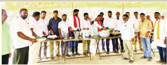
చింతగూడ కోయవాగులో అన్నదానంలో పాల్గొన్న భక్తులు