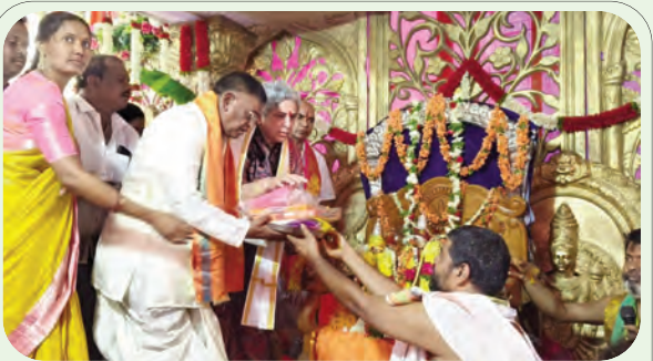
కల్యాణ మహోత్సవం వేడుకల్లో ఎమ్మెల్యే దంపతులు