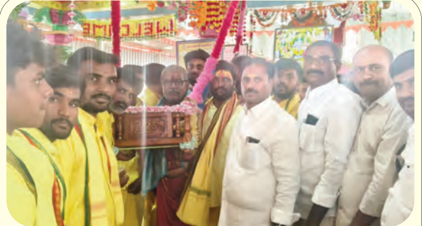
కామోల్ గ్రామంలో సీతారాముల కల్యాణోత్సవం