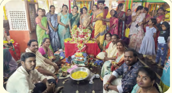
సీతారాముల కల్యాణంలో పాల్గొన్న భక్తులు