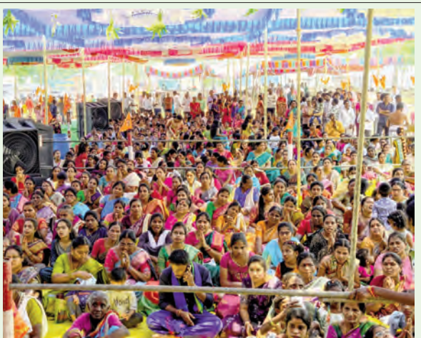
సీతారాముల కల్యాణ మహోత్సవాన్ని వీక్షిస్తున్న భక్తులు