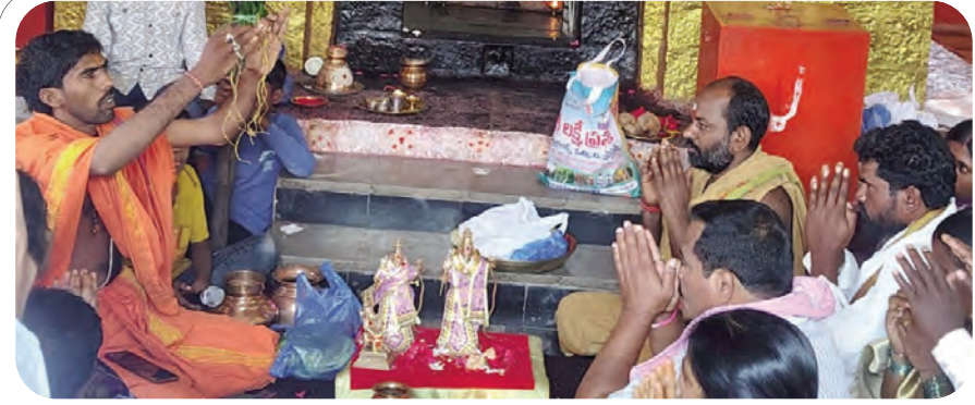
మంగళ సూత్రాన్ని చూపిస్తున్న పండితులు