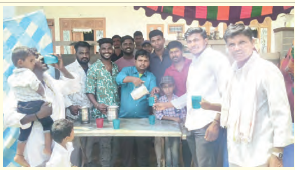
భైంసా మండలం కామోల్ బస్టాండ్ వద్ద చలివేంద్రాన్ని ప్రారంభిస్తున్న నవ యూత్ సభ్యులు