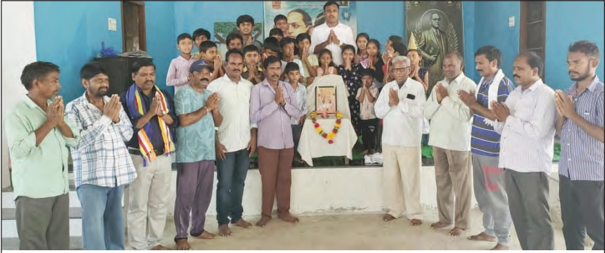
ఆశోక చక్రవర్తి చిత్రపటానికి నివాళులర్పిస్తున్న బౌద్ధ సంఘ నాయకులు