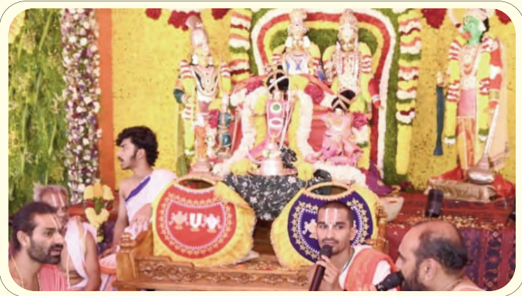
జాం గ్రామంలో భక్తిశ్రద్ధల మధ్య శాస్త్రోక్తంగా జరుగుతున్న సీతారాముల కల్యాణోత్సవం