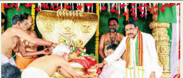
సీతారాముల కల్యాణ మహోత్సవాన్ని వీక్షిస్తున్న భక్తులు