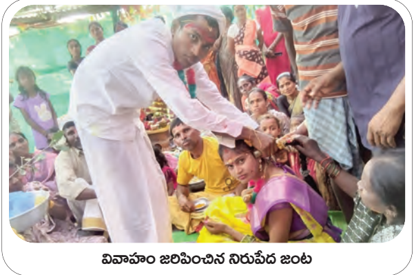
వివాహం జరిపించిన నిరుపేద జంట

మండలంలోని మాదారం, ఐబి, రేపల్లెవాడ, బోయపల్లి, తదితర గ్రామాలలోని శ్రీరామ, ఆంజనేయ స్వామి ఆలయాల్లో శుభ్రవారం సీతారాముల కళ్యాణ ఉత్సవాలు నేత్రవర్షంగా జరిగాయి. వేద పండితులు, ఆలయాల అర్చకులు మంత్రోచ్ఛారణతో సీతారాముల కళ్యాణాన్ని శాస్త్రోక్తంగా నిర్వహించారు. సీతారాముల కళ్యాణం ఉత్సవానికి మహిళలు భక్తులు అధిక సంఖ్యలో తల్లి రావడంతో ఆలయాలు కిక్కిరిసిపోయాయి. కళ్యాణోత్సవం ఆనంతరం భక్తులు మహిళలు సీతారాములను దర్శించుకున్నారు. ఆలయ కమిటీల ఆధ్వర్యంలో భక్తులకు వడపప్పు, పానకం, తీర్థ, అన్న ప్రసాద వితరణ చేశారు. మండలంలోని ఐబిలో ఆంజనేయ స్వాములు శోభయాత్రను ఉత్సాహంగా నిర్వహించారు. ఈ సందర్భంగా శ్రీరామ నామస్మరణతో ఆలయాలు, పురవీధులు మారుమోగాయి.