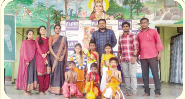
శ్రీరాముని వేషధారణలో అలరిస్తున్న విద్యార్థులు, పాఠశాల సిబ్బంది