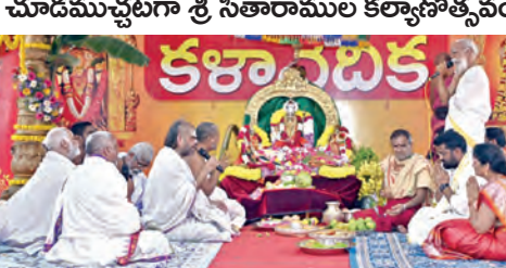
చూడముచ్చటగా శ్రీ సీతారాముల కల్యాణోత్సవం

ఇంద్రకిలాది, మార్చి 27 ప్రభాతవార్త: శ్రీ దుర్గామల్లేశ్వర స్వామి వారి దేవస్థానం ఇంద్ర కిలాదిపై శ్రీరామనవమి వర్సెస్ దినం సందర్భంగా శుక్రవారం మధ్యాహ్నం 12 గంటలకు అభిషేక లగ్నంలో శ్రీ సీతారాముల కల్యాణోత్సవం శాస్త్రాంగా జరిగింది. రాజ