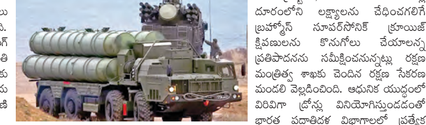
నాలుగు స్వాద్రష్ట రిమాన్డ్ ఫైల్డ్ క్రైస్ట్ ఎయిర్క్రాఫ్టులు, 800 కిలోమీటర్ల దూరంలోని లక్ష్యాలను వేధించగలిగే బ్రహ్మాణ్ణి సూపర్ సోనిక్ క్రాయిస్ట్ క్షిపణులను కొనుగోలు చేయాలన్న ప్రతిపాదనను సమీక్షించనున్నట్లు కరణ మంత్రిత్వ శాఖకు చెందిన కరణ సేకరణ మండ్రి వెల్లడించింది. ఆధునిక యుద్ధంలో మరింతగా ప్రాధాన్యతను కలిగించే కారణంగా భారత్ మూల్యాంకనం ప్రక్రియలో కేటాయింపు రూ. 400 కోట్లు విడుదల రూ. 100 కోట్లు ఖర్చు నిల్ 2026-27లో రూ. 402.35 కోట్లు కేటాయింపు రాష్ట్రం ఏర్పడిన నాటి నుంచి చేసిన ఖర్చు రూ. 20.99 కోట్లు...