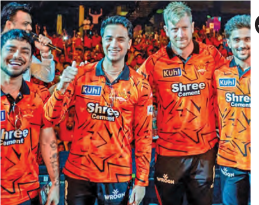
హైదరాబాద్, మార్చి 27 (వార్త క్రీడా ప్రతినిధి) : ఐపిఎల్ 2026 సీజన్లో తొలి మ్యాచ్ ఆడించుకున్న సన్రైజ్స్ హైదరాబాద్ సిద్ధమైంది. మార్చి 28న టోర్నీ ఆరంభ మ్యాచ్లో చిన్నసామెత

(వార్త క్రీడా విభాగం) 2008 నుంచి ఐపిఎల్ హాట్ ఫెవరెట్లలో ఒకటిగా ఉన్న రాయల్ ఛాలెంజర్స్ బెంగళూరు... 2009, 2011, 2016లో పైసెట్లకు వచ్చినా చివరి మెట్టుపై బోలాపడింది. ఎట్టకేలకు గత ఏడాది ఐపిఎల్ ట్రోఫీ అందుకుంది. ఈసారి డిపెండ్ డింగ్ ఛాంపియన్ గా రజత్ పాటిదార్ నేతృత్వంలో బరిలోకి దిగుతోంది. సన్రైజ్స్ హైదరాబాద్ తో ఐపిఎల్ షారు ఆరంభింపనుంది. విరాట్ కోహ్లా, దేవదత్ పడికర్, విహాన్ మల్హోత్రా, పిల్ సాల్వే, టిమ్ డేవిడ్, జిత్వే శర్మ వంటి మ్యాచ్ వినింగ్ స్టేయర్లతో పటిష్టంగా ఉంది. రెండో ఏడాది ట్రోఫీ నిలబెట్టుకోవడంపై ఫోకస్ పెట్టింది. చెన్నై సూపర్ కింగ్స్ ఏడో ట్రోఫీ వేట ఐపిఎల్లో విజయవంతమైన జట్టులో చెన్నై సూపర్ కింగ్స్ డి అగ్రస్థానం. ఏకంగా అయిదు సార్లు ఛాంపియన్ గా, మరో అయిదు సార్లు రన్స్ రేఖగా నిలిచిన ఏకైక జట్టు. ఎక్కువసార్లు స్టే ఆఫ్ ఆడిన జట్టుకూడా. గత ఏడాది సీఎస్ఆర్ ఫ్లాప్ షో చేసింది. 14 మ్యాచ్లలో నాలుగింటిలో మాత్రమే సెగ్గి పాయింట్లు పట్టికోట్లు దురుగున నిలిచింది. ది.రుతురాజ్ గైక్వాడ్ కెప్టెన్ గా సారి సీఎస్ఆర్ ఛాంపియన్ గా బరిలోకి దిగుతోంది. సంజూ శాంసన్, ధోనీ, శివమ్ దూబే, జేమీ ఒబ్డయన్,