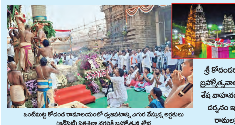
ఒంటిమిట్టల కోదండ రామాలయంలో ధ్వజపాటి ఎగురు వేస్తున్న అర్చకులు (ఎన్.సి.టి) ఏకశిలా నగరికి బ్రహ్మోత్సవ శోభ

ఒంటిమిట్టల వైభవంగా ధ్వజారోహణం రాజంపేట, మార్చి 27 ప్రభాతవార్త: రాష్ట్ర ప్రభుత్వం ఆధికారిక లాంఛనాలతో తిరుమల తిరుపతి దేవస్థానం శ్రీరామనవమి వేడుకలు ఒంటిమిట్టల శ్రీ కోదండరామస్వామి ఆలయంలో శుక్రవారం ఉదయం ధ్వజారోహణంతో శ్రీరామ బ్రహ్మోత్సవాల వైభవంగా ప్రారంభమయ్యాయి. తెల్లవారుజామున 3 గంటలకు కోవెల తెరిచి స్వామికి సుప్రభాత సేవ నిర్వహించారు. సుప్రభాత సేవలో స్వామిని మేల్కొల్పి శాస్త్రోక్తంగా పూజలు