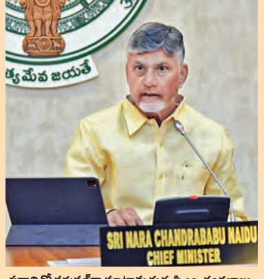
ప్రధానితో వర్షపాతం మారినట్లు సింఘాల్ చంద్రబాబు

పెట్రోలు, డీజిల్పై ఎక్సైజ్ తగ్గింపు మంచిదే: సింఘాల్ విజయవాడ, మార్చి 27 ప్రభాతవార్త ప్రతినిధి: పెట్రోల్, డీజిల్పై ఎక్సైజ్ సుంకం తగ్గిస్తూ కేంద్ర ప్రభుత్వం తీసుకున్న నిర్ణయం ముఖ్యమంత్రి చంద్రబాబు హర్షం వ్యక్తం చేశారు. ఈ మేరకు ఎక్స్ వేడికే ట్రీట్ చేశారు. ప్రజాహిత్యాన్ని దృష్టిలో పెట్టుకుని తీసుకున్న కీలక చర్య తీసుకోవటం చట్ట సంహేయంగా ఉందన్నారు. ఈ నిర్ణయాన్ని ఆంధ్రప్రదేశ్ ప్రభుత్వం స్వాగతించినట్లు ప్రధానితో వర్షపాతం మారినట్లు సింఘాల్ చంద్రబాబు