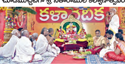
మూడముచ్చటగా శ్రీ సీతారాముల కల్యాణోత్సవం

ఇంద్రకీలాద్రి, మార్చి 27 ప్రభాతవార్త: శ్రీ దుర్గామల్లెశ్వర స్వామి వారి దేవస్థానం ఇంద్ర కీలాద్రిపై శ్రీరామనవమి వర్స దినం సందర్భంగా శుభవారం మధ్యాహ్నం 12 గంటలకు అభిషేక లగ్నంలో శ్రీ సీతారాముల కల్యాణోత్సవం శారద్రకంగా జరిగింది. రాజ