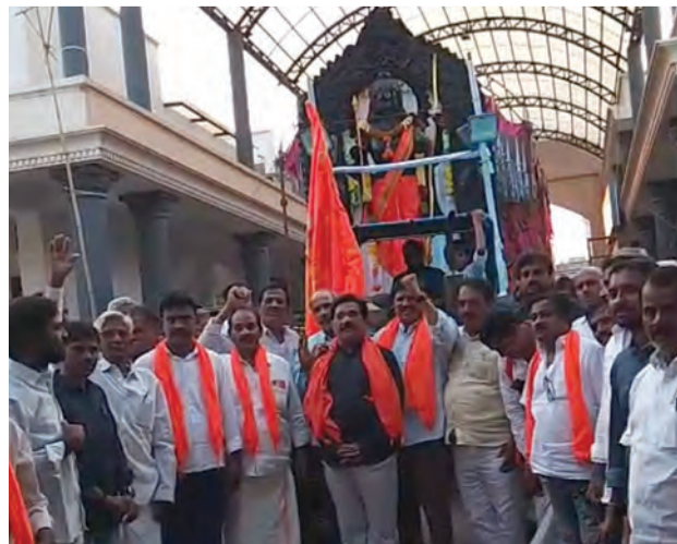
బాల రాముడి శోభా యాత్ర జరుగుతున్న దృశ్యం

పులివెందుల పట్టణంలో శుక్రవారం సాయంత్రం శ్రీరామనవమి పర్యవేక్షణ పురస్కరించుకొని భక్తులు బాలరాముడి శోభాయాత్రను భక్తిశ్రద్ధలతో ఘనంగా నిర్వహించారు. పడమటి ప్రసన్న అంజనేయ స్వామి ఆలయం వద్ద ప్రారంభమైన ఈ శోభాయాత్రలో భక్తులు పెద్ద సంఖ్యలో పాల్గొన్నారు. శోభాయాత్ర ప్రారంభం కాగానే 'జై రామోమ్' నినాదాలతో పట్టణం మారుమోగింది. పూల అంగళ్లు, శ్రీనివాస హాలు, బంగారు అంగళ్లు, పాత బస్టాండ్ మార్గాల మీదుగా శోభాయాత్ర కొనసాగి శ్రీరామహేళన వరకు చేరుకుంది. అనంతరం రామల స్వామి ఆలయానికి ఊరేగింపుగా వెళ్లింది. భక్తులు భక్తి నినాదాలు చేస్తూ, హారతులు ఇస్తూ శోభాయాత్రను ఉత్సాహంగా కొనసాగించారు. స్థానికులు కూడా పెద్ద సంఖ్యలో పాల్గొని కార్యక్రమాన్ని విజయవంతం చేశారు. ఈ సందర్భంగా పట్టణంలో ఆధ్యాత్మిక వాతావరణం నెలకొంది.