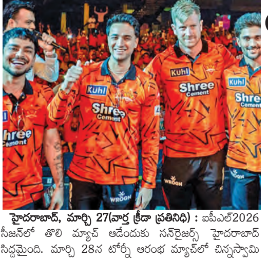
ఫైదరాబాద్, మార్చి 27(వార్త క్రీడా ప్రతినిధి) : ఐపిఎల్ 2026 సీజన్లో తొలి మ్యాచ్ ఆడేందుకు సన్రైజర్స్ హైదరాబాద్ సిద్ధమైంది. మార్చి 28న టోర్నీ ఆరంభ మ్యాచ్లో చిన్నస్వామి

ఇచ్చిన సన్ రైజర్స్ హైదరాబాద్ మూడుసార్లు సైన్లకు వచ్చింది. 2016లో ఛాంపియన్లుగా నిలిచింది. 2018, 2024లో రన్రమీతోనే సరిపెట్టింది. గత ఏడాది ఆలో స్టాన్లతో లీగ్ స్టేజీలోనే వెనుదిరిగింది. ఇషాన్ కిషన్ కెప్టెన్సీలో ఈసారి హాట్ ఫేవరట్లుగా బరిలోకి దిగుతుంది. అభిషేక్ శర్మ, ట్రావిస్ హెడ్, హెన్రీక్ క్లాస్, నితీష్ కురారె, రెడ్డి, లివింగ్ స్టోన్ వంటి క్లాస్ స్టేయర్లు ఉన్నారు. పంజాబ్ కింగ్స్ సైన్లలో భారీ మార్పు గత ఏడాది ఐపిఎల్లో అదరగొట్టిన పంజాబ్ కింగ్స్.. లీగ్ స్టేజీలో టాప్ పాజిషన్లో నిలిచింది. సైన్ల మెట్టుపై నిరాశపరుస్తూ రన్రమీతోనే సరిపెట్టింది. 2014లోనూ ఒక సారి రన్రమీగా నిలిచింది. 2008 నుంచి ఉన్న పంజాబ్ కింగ్స్ కు... ట్రోఫీ అందని డ్రాక్షగా మారింది. శ్రేయాన్