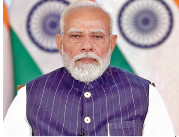
శుక్రవారం న్యూఢిల్లీ నుంచి సింఘలో వర్చువల్ గా మాట్లాడుతున్న ప్రధాని మోడీ

విజయవాడ, మార్చి 27 ప్రభాతవార్త ప్రతినిధి: ఆంధ్రప్రదేశ్ రాజధానిగా అమరావతికి పూర్తి స్థాయి చట్టబద్ధత కల్పించే దిశగా కీలక కార్యక్రమం చేపట్టామని ఎపిసిఎం చంద్రబాబు తెలిపారు. ఈ నెల 28వ తేదీన (శనివారం) ఉదయం 11 గంటలకు అసెంబ్లీ ప్రత్యేక సమావేశం జరుగుతుందని వివరించారు. పార్లమెంట్ లో ఇందుకు సంబంధించి కేంద్రం బిల్లు ప్రవేశపెట్టే క్రమంలో మన అసెంబ్లీ కూడా కీలక తీర్మానం చేస్తోందన్నారు. అమరావతిని రాజధానిగా గుర్తించాలనే అంశంపై ఇప్పటివరకు చట్టపరమైన చట్టం లేదని, ఈ లోటును భర్తీ చేసేందుకు ఈ సమావేశాన్ని ఏర్పాటు చేస్తున్నట్లు ఆయన వెల్లడించారు. విజయవాడ, అమరావతి ప్రాంతంపై రాష్ట్ర రాజధానిగా ఉండాలని అసెంబ్లీలో ఏకగ్రీవ తీర్మానం చేసి, వెంటనే కేంద్ర ప్రభుత్వానికి వందనన్నట్లు వివరించారు. కేంద్ర