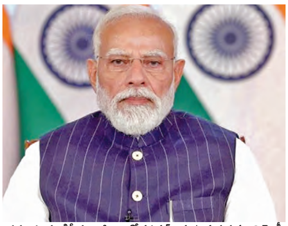
శుక్రవారం న్యూఢిల్లీ నుంచి సింఠిలో వర్షపాతం మాట్లాడుతున్న ప్రధాని మోడీ

నేడు ప్రత్యేక అసెంబ్లీ రాజధానిగా అమరావతికి పూర్తిస్థాయి చట్టబద్ధత కల్పించే దిశగా కార్యచరణ ప్రస్తుత పార్లమెంటు సమావేశాల్లోనే బిల్లుకు ఆమోదం విజయవాడ, మార్చి 27 ప్రభాతవార్త ప్రతినధి: ఆంధ్రప్రదేశ్ రాజధానిగా అమరావతికి పూర్తి స్థాయి చట్టబద్ధత కల్పించే దిశగా కీలక కార్యచరణ చేపట్టామని ఎపిసీఎం చంద్రబాబు తెలిపారు. ఈ నెల 28వ తేదీన (శనివారం) ఉదయం 11 గంటలకు అసెంబ్లీ ప్రత్యేక సమావేశం జరుగుతుందని వివరించారు. పార్లమెంట్లో ఇందుకు సంబంధించి కేంద్రం బిల్లు ప్రవేశపెట్టే క్రమంలో మన అసెంబ్లీ కూడా కీలక తీర్మానం చేస్తోందన్నారు. అమరావతిని రాజధానిగా గుర్తించాలనే ఆశంపై ఇప్పటివరకు చట్టపరమైన సృష్టక లేదని, ఈ లోటును భర్తీ చేసేందుకే ఈ సమావేశాన్ని ఏర్పాటు చేస్తున్నట్లు ఆయన వెల్లడించారు. విజయవాడ, అమరావతి ప్రాంతంపై రాష్ట్ర రాజధానిగా ఉండాలని అసెంబ్లీలో ఏకగ్రీవం తీర్మానం చేసి, వెంటనే కేంద్ర ప్రభుత్వానికి వందనన్నట్లు వివరించారు. కేంద్ర