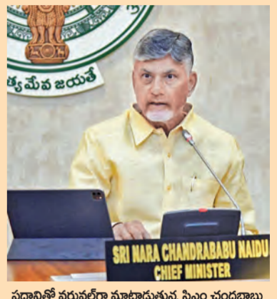
ప్రధానితో వర్చువల్ గా మాట్లాడుతున్న సిఎం చంద్రబాబు

పెట్రోలు, డీజిల్ పై ఎక్సైజ్ తగ్గింపు మంచిదే: సిఎం విజయవాడ, మార్చి 27 ప్రభాతవార్త ప్రతినధి: పెట్రోల్, డీజిల్ పై ఎక్సైజ్ సుంకం తగ్గిస్తూ కేంద్ర ప్రభుత్వం తీసుకున్న నిర్ణయం ముఖ్యమంత్రి చంద్రబాబు హర్షం వ్యక్తం చేశారు. ఈ మేరకు ఎక్స్ వేడి ట్వీట్ చేసారు. ప్రజాపాతాన్ని దృష్టిలో పెట్టుకుని తీసుకున్న కీలక చర్య తీసుకోవటం పట్ల సంతోషంగా ఉందన్నారు. ఈ నిర్ణయాన్ని ఆంధ్రప్రదేశ్ ప్రభుత్వం స్వాగతించిందన్నారు.