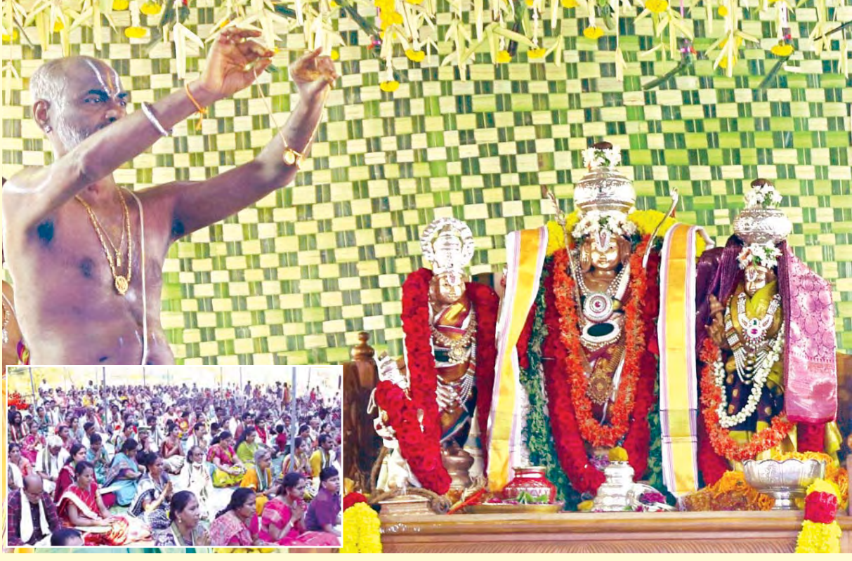
విశాఖపట్నం, మార్చి 27 ప్రభాతవార్త

శ్రీరామనవమి సందర్భంగా రామాలయాలు, హనుమాన్ ఆలయాలలో సీతారామ కళ్యాణం ఘనంగా నిర్వహించారు. ఎక్కడ ఎటువంటి అవాంఛనీయ సంఘటనలు జరగకుండా అలయ వర్గాలు ఏర్పాటు చేశారు. భక్తులు ఎండ బారిన పడకుండా చలువ పందిర్లు వేసి ఎప్పుడీకప్పుడు మంచినీరు, మజ్జిగ, పానకం అందించారు. ఆలయాల్లో కళ్యాణం సందర్భంగా శోభాయమానంగా అలంకరణ చేశారు. అంటికా బాగోలో శ్రీ సీతారామ కళ్యాణం ఘనంగా