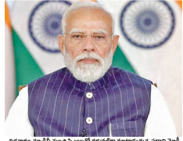
శుక్రవారం న్యూఢిల్లీ నుంచి సిఎంలతో వర్చువల్ గా మాట్లాడుతున్న ప్రధాని మోడీ

నేడు ప్రత్యేక అసెంబ్లీ రాజధానిగా అమరావతికి పూర్తిస్థాయి చట్టబద్ధత కల్పించే దిశగా కార్యచరణ ప్రస్తుత పార్లమెంటు సమావేశాల్లోనే బిల్లుకు ఆమోదం విజయవాడ, మార్చి 27 ప్రభాతవార్త ప్రతినధి: ఆంధ్రప్రదేశ్ రాజధానిగా అమరావతికి పూర్తి స్థాయి చట్టబద్ధత కల్పించే దిశగా కీలక కార్యచరణ చేపట్టామని ఎపిసిఎం చంద్రబాబు తెలిపారు. ఈ నెల 28వ తేదీన (శనివారం) ఉదయం 11 గంటలకు ఆసెంబ్లీ ప్రత్యేక సమావేశం జరుగుతుందని వివరించారు. పార్లమెంట్ లో ఇందుకు సంబంధించి కేంద్రం బిల్లు ప్రవేశపెట్టే క్రమంలో మన ఆసెంబ్లీ కూడా కీలక తీర్మానం చేస్తోందన్నారు. అమరావతిని రాజధానిగా గుర్తించాలనే ఆంధ్ర ప్రదేశ్ ప్రభుత్వం చట్టపరమైన సుప్రీం కోర్టుకు సవాలు వేస్తున్నట్లు ఆయన వెల్లడించారు. విజయవాడ, అమరావతి ప్రాంతం మేరకు రాజధానిగా ఉండాలని ఆసెంబ్లీలో ఏకగ్రీవ తీర్మానం చేసి, వెంటనే కేంద్ర ప్రభుత్వానికి పంపనున్నట్లు వివరించారు. కేంద్ర