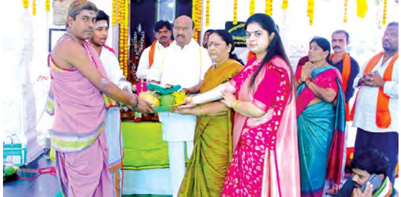
విశాఖపట్నం - ప్రభాతవార్త

పాల్గొన్న స్నేహితుల అయ్యన్నపాత్రుని దంపతులు