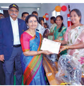
కుప్పంలో మహిళలకు ఉపకారం కుటుంబ సంరక్షణ కేంద్రం, కుప్పం నారా భువనేశ్వరి

- మరిన్ని సేవా కార్యక్రమాలు చేయాలనే తపన.. పారదర్శకంగా ట్రస్ట్ నిర్వహణ!! - విజయవాడలో తలసేమియా సింబర్.. అనంతపురంలో బ్లడ్ బ్యాంక్ ఏర్పాటు!! - సిఎం సతీమణి నారా భువనేశ్వరి