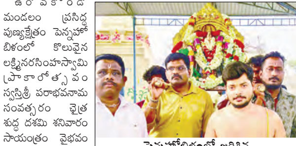
లక్ష్మీనరసింహస్వామి వ్రాకారోత్సవం దృశ్యం

-భక్తులు, పర్యాటకులతో కిటకిటలాడిన ఆలయం ఉరవకొండ, మార్చి 28 ప్రభాతవార్త