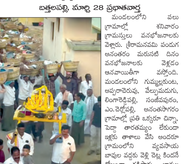
గంటాపురంలో సీతారామల ఉత్సవ విగ్రహాలతో పాటు వసభోజనాలు

మండలంలోని పలు గ్రామాలలో వసభోజనాలు వెళ్లారు. శ్రీరామనవమి పండుగ అనంతరం మరునటి దినం వసభోజనాలకు వెళ్లడం ఆనవాయితీగా వస్తోంది.