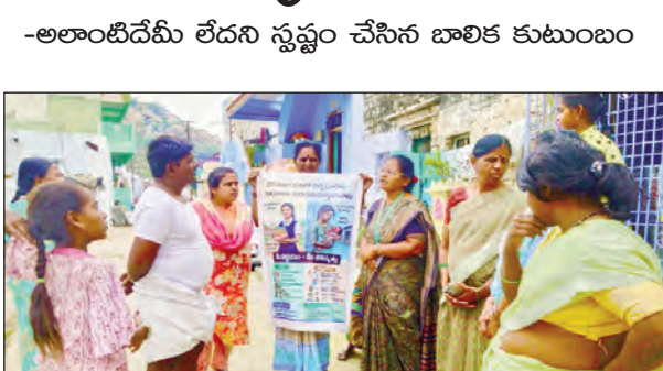
బాల్య వివాహాలపట్ల అసర్కాలపు అవగాహన కల్పిస్తున్న సీడీపీవో డా॥బి.ఎన్.శ్రీధర్ బృందం

ఉరవకొండ పట్టణంలోని 5వ వార్డులో 9వ తరగతి చదువుతున్న ఒక మైనర్ బాలికకు వివాహం చేయనున్నారన్న సమాచారంతో శనివారం ఎంపీసీ ఉరవకొండ ప్రాజెక్టు సీడీపీవో డా॥బి.ఎన్.శ్రీధర్ బృందం విచారణ చేపట్టింది. మైనర్ బాలికకు ఆమె కుటుంబ సభ్యులు వివాహం తలపెట్టారని చచ్చిన సమాచారాన్ని 1098 అధికారులు స్థానిక పోలీస్ స్టేషన్ అధికారులకు తెలియజేశారు.