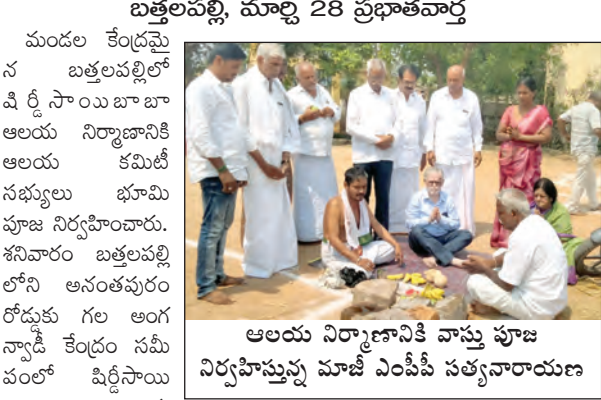
అలయ నిర్మాణానికి వాస్తు పూజ నిర్వహిస్తున్న మాజీ ఎంపీ సత్యనారాయణ

మండల లెండ్రపల్లిలో వసభోజనాలు జరిగాయి. అలయ నిర్మాణానికి కమిటీ సభ్యులు భూమి పూజ నిర్వహించారు. శనివారం అంతటా అలయ నిర్మాణానికి వాస్తు పూజ నిర్వహించారు.