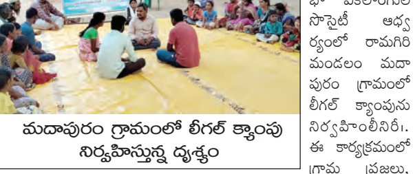
మదాపురం గ్రామంలో లీగల్ క్యాంపు నిర్వహిస్తున్న దృశ్యం

టీంబక్కు కలెక్టివ్ సహకారంతో ప్రతి భా వికలాంగుల స్టాఫ్ అధ్యక్షులతో రామగిరి మండలం మదాపురం గ్రామంలో లీగల్ క్యాంపును నిర్వహించిన డి.సి. ఈ కార్యక్రమంలో గ్రామ ప్రజలు, మహిళలు, వికలాంగులు పాల్గొన్నారు. ఈ సహకారంలో వికలాంగుల బట్టాలు, మేనేజ్ వివాహాలు వారు పడుతున్న బాధలు గురించి సంఘంపైన అవగాహనా నాటికు నిర్వహించారు. ఈ సహకారంలో సుమారు 50 మంది సభ్యులు పాల్గొన్నారు. అలాగే సొసైటీ డిపీసీ నరసింహ, సి.ఐ. సి.బి.బి. పాల్గొన్నారు.