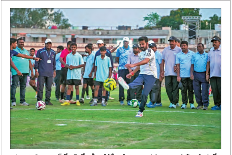
శనివారం హైదరాబాద్ లో ఎమ్మెల్యేల క్రీడా పోటీలు ప్రారంభించిన సందర్భంగా పుట్ బాబ్ ఆటలో పాల్గొని తెలంగాణ సిఎం రేవంత్ రెడ్డి

>> ఇరాన్ మూసివేయనున్న దన్ను సమాచారంతో యూరోప్ దేశాలు తీవ్రస్థాయిలో ఆందోళన చెందు తున్నాయి. ఇప్పటికే పార్లమెంట్ జలసంధిని మూసివేయడంతో ఆసియా, పసిఫిక్ దేశాలు ఇంద్రనందన్ క్షోభతో కొట్టుమిట్టాడుతున్న సంగతి తెలిసిందే. సూర్యుణ్ణి కాలవ తెరిచిన తర్వాత మాండేజిలసంధికి ప్రాముఖ్యం వచ్చింది. మధ్యదరా నదు ప్రధానంగా మహానదికి కీలక లింకుగా మారింది. యెమెన్, జిబోటీ దేశాల మధ్య ఉన్న ఈ జలసంధిపై ఇప్పుడు యెమెన్ పట్టులో ఉంది. దీనికోసం చోటిలో ఎక్కువశాతం ఈ జలసంధిని వర్షవేళ్లెస్తారు. ఇరాన్ మధ్యదరా నదులుగా ఉన్న చోటిలో మధ్యతూ బాబ్ ఎల్ మండేబ్ జలసంధిని మూసివేస్తామని ఇరాన్ ఇప్పటికే ప్రకటించడంతో అటు ఆగ్రాఖ్యాం ఇటు ఇరాన్ లోని ప్రజలనుండి ఒత్తిళ్లు పెరుగుతున్నాయి. సముద్రజల వనరులపై శతృత్వాలను ఇరాన్ చోటిలో ఉంచుతూ దాడులు చేసింది. గాత్రా యుద్ధకాలం లోనే 13వ వేల సంవత్సరాలకు పాత పుస్తకం ఇరాన్ మరొకటి మధ్యతూ ఇప్పుడంటుంటే ఈ దాడులు మరొకటి పెరుగుతాయని ప్రపంచదేశాలు కలవరపడుతున్నాయి. మాండేబ్ జలసంధిలో జిబోటీ వైపున అమెరికాకు సైనికసహాయం ఉన్నందున ఇప్పుడు ఇరాన్ పోరాటం అంతా ఈ స్థానంపైనే పడింది. అదేవిధంగా అమెరికాకు అత్యంత అత్యున్న దేశంగా ఉన్న బ్రెజిల్ లోని ఇరాన్ దాడులు పెరిగాయి. ఈ దేశంలోని సైనికసహాయం, ఎయిర్ ఫోర్సులు మరొకటి వలననే లక్ష్యంగా దాడులు చేశారు. అంతేకాకుండా తాజాగా ఆఫ్ గాన్ లోని ప్రావిన్స్-4లో భాగంగా కువైట్ లోని షువైబ్ ఫోర్ట్ లో ఆరు అమెరికా ల్యాండ్ ఆర్మీ బ్రాంచ్ యూటిలీటీలపై దాడులు చేసింది. పెద్ద సంఖ్యలో అమెరికన్ బలగాలును హత మార్చినట్లు ఇంటెలిజెన్స్ తెలిపింది. వెయ్యికి లోపు దూరశ్రేణి ఖాదర్ 380 క్రూయిజ్ మిసైల్లను ఉపయోగించి దాడులు జరిపామని ప్రకటించింది.