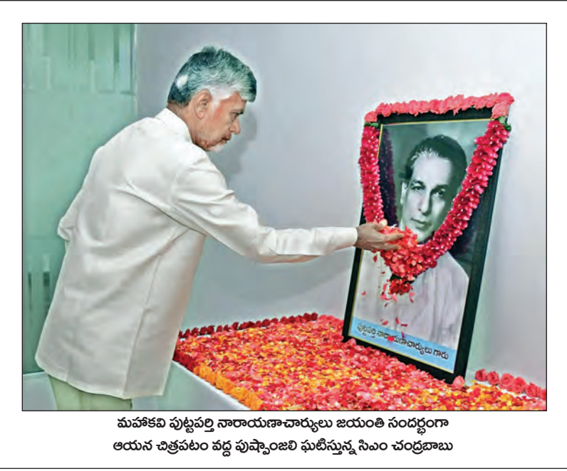
మహాకవి పుట్టపర్తి నారాయణాచార్యులు జయంతి సందర్భంగా ఆయన చిత్రపటం వద్ద పుష్పాలను పులిస్తూ సీఎం చంద్రబాబు