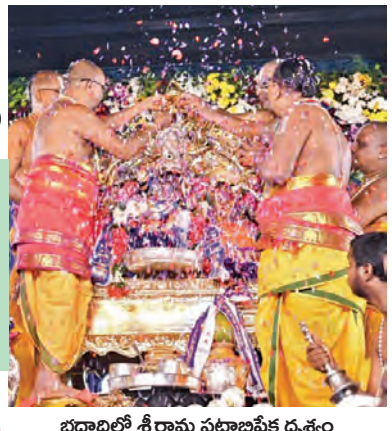
భద్రాద్రిలో శ్రీరామ పట్టాభిషేక దృశ్యం