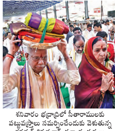
శనివారం భద్రాద్రిలో సీతారాములకు పట్టుపస్త్రాలు సమర్పించేందుకు వెళుతున్న గవర్నర్ శివప్రతాప్ శుక్లా దంపతులు

ఎమ్మెల్యే, ఎమ్మెల్సీల క్రీడాపోటీలు ప్రారంభించిన సిఎం రేవంత్ రెడ్డి