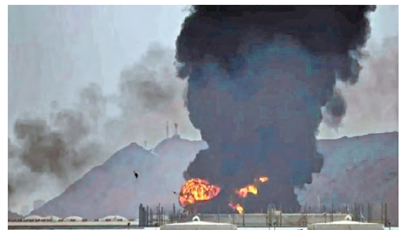
సాదీలోని అమెరికా విమానస్థావరాలపై ఇరాన్ క్షిపణి దాడి దృశ్యం

వైఎస్సార్స్ మళ్లీ పవర్ లోకి రాదు: డి. సిఎం పవన్ 2