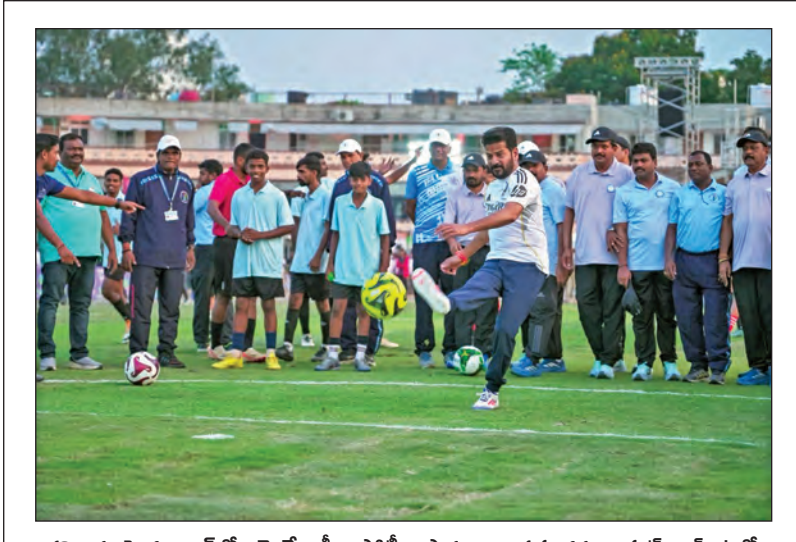
శనివారం హైదరాబాద్ లో ఎమ్మెల్యేల క్రీడా పోటీలు ప్రారంభించిన సందర్భంగా పుట్ బాట్ ఆటలో పాల్గొని తెలంగాణ సీఎం రేవంత్ రెడ్డి

>> ఇరాన్ మూసివేయనున్న దన్ను సమాచారంతో యూరోప్ దేశాలు తీవ్రస్థాయిలో ఆందోళన చెందు తున్నాయి. ఇప్పటికే పార్లమెంట్ జలసంధిని మూసివేయడంతో ఆసియా, పసిఫిక్ దేశాలు ఇంద్రావతి నదీ క్షేత్రంలో కొట్టుమిట్టాడుతున్న సంగతి తెలిసిందే. సూర్యజ్వాలా తెరిచిన తర్వాత మాండేజిలసంధికి ప్రాముఖ్యం వచ్చింది. మధ్యదరా నదు ప్రదేశం, హిందూ మహాసముద్రానికి కీలక లింకుగా మారింది. యెమెన్, జిబోటీ దేశాల మధ్య ఉన్న ఈ జలసంధిపై ఇప్పుడు యెమెన్ పట్టులో ఉంది. దీనికోసం చోటిలో ఎక్కువశాతం ఈ జలసంధిని వర్షవేస్తేస్తారు. ఇరాన్ మధ్యదరా నదులుగా ఉన్న చోటిలో మధ్యతూట్ బాట్ ఎల్ మండేజి జలసంధిని మూసివేస్తామని ఇరాన్ ఇప్పటికే ప్రకటించడంతో అటు ఆగ్రాఖ్యాం ఇటు ఇజ్రాయెల్ కు సైతం ప్రపంచదేశాలనుంచి ఒత్తిళ్లు పెరుగుతున్నాయి. సముద్రజల వనరులపై శతృత్వాలను ఇరాన్ చోటిలో సాధించుతో దాడులు చేసి కట్టడి చేస్తోంది. గాజా యుద్ధకాలం లోనే 13 బోయింగ్ చోటిలు దాడులు చేసారు. ఇప్పుడు ఇరాన్ మరొక మధ్యతూట్ జలసంధిలో ఈ దాడులు మరొకసారి ప్రపంచదేశాల కలవరపడుతున్నాయి. మాండేజి జలసంధిలో జిబోటీ వైపున అమెరికాకు సైనికసహాయం ఉన్నందున ఇప్పుడు ఇరాన్ పోషకం అంతా ఈ స్థానంపైనే పడింది. అదేవిధంగా అమెరికాకు అత్యంత అత్యున్న దేశంగా ఉన్న బ్రెజిల్ పోషకం ఇరాన్ దాడులు పెరిగాయి. ఈ దేశంలో సైనికసహాయం, ఎయిర్ ఫోర్సులు మౌలికసదుపాయాల లక్ష్యంగా దాడులు చేసారు. అంతేకాకుండా తాజాగా ఆపరేషన్లు ప్రామిస్-4 లో భాగంగా కువైట్ లోని షువైబ్ ఫోర్ట్ లో ఆరు అమెరికా ల్యాండ్ రిక్వెస్టులు యిటీలో దాడులు చేసింది. పెద్ద సంఖ్యలో అమెరికన్ బలగాలును హత మార్చినట్లు ఇంటెలిజెన్స్ తెలిపింది. వెయ్యికి లోపు దూరశ్రేణి ఖాదర్ 380 క్రూయిజింగ్ బాలును ఉపయోగించి దాడులు జరిపామని ప్రకటించింది.