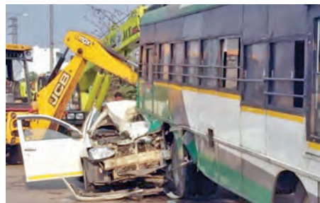
పాలమాకులపల్లి వద్ద బస్సును డీకొన్న కారు

- భార్య, భర్తతో పాటు మూడేళ్ల చిన్నారుల మృతి - చిత్తూరు జిల్లాలో రోడ్డు ప్రమాదం