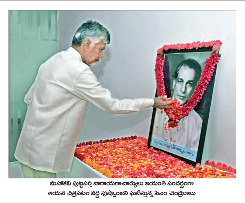
మహాకవి పుట్టపర్తి నారాయణాచార్యులు జయంతి సందర్భంగా ఆయన చిత్రపటం వద్ద పుష్పాలాంబు ఘోషిస్తున్న సీఎం చంద్రబాబు