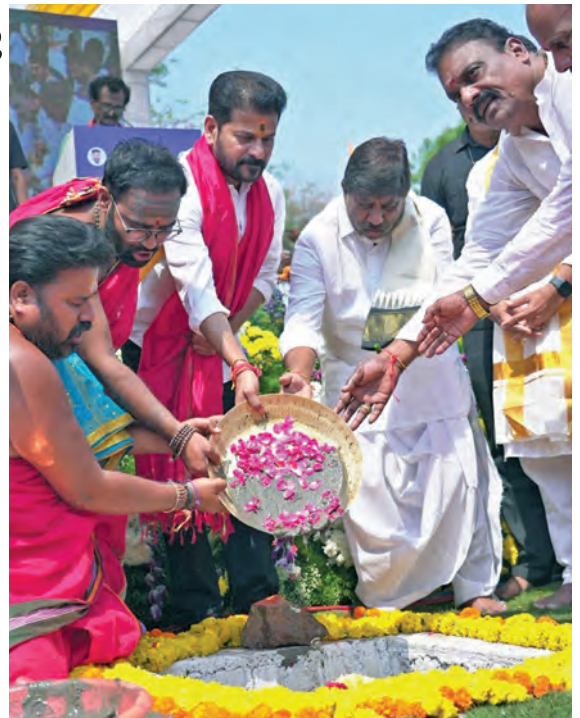
శనివారం ఓంకారేశ్వర అలయానికి భూమి పూజచేస్తున్న సిఐం రేవంత్ రెడ్డి, డి.సిఎం భట్టి

ఆరునూరైనా ప్రాజెక్టు పూర్తి చేసి తీరుతాం మూసీ తీరాన రూ.700 కోట్లతో ఓంకారేశ్వర అలయానికి శంకుస్థాపన దక్షిణాశీగా అభివృద్ధి: సిఐం రేవంత్