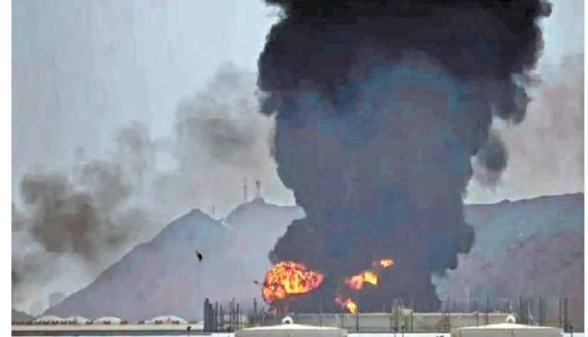
సాదీలోని అమెరికా విమానస్థానాలపై ఇరాన్ క్షిపణి దాడి దృశ్యం