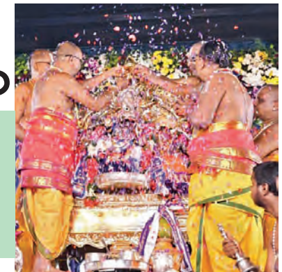
భద్రాద్రిలో శ్రీరామ పట్టాభిషేక దృశ్యం