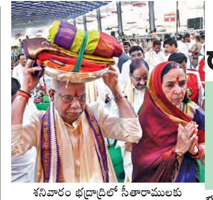
శనివారం భద్రాద్రిలో సీతారాములకు పట్టుపస్త్రాలు సమర్పించేందుకు వెళుతున్న గవర్నర్ శివప్రతాప్ శుక్లా దంపతులు

ప్రభాతవార్త ప్రధాన ప్రతినిధి హైదరాబాద్, మార్చి 28: రామప్ప శివుడి సాక్షిగా మూసీ ప్రక్షాళన చేసి తీరుతామని తెలంగాణ ముఖ్యమంత్రి ఎ. రేవంత్ రెడ్డి అన్నారు. రాజకీయ కారణాలతో మూసీ పునరుజ్జీవనాన్ని అడ్డుకోవడం సరికాదని, ఆరు నూరైనా.. అక్కడి సూర్యుడు ఇక్కడ ఉదయించినా మూసీ పునరుజ్జీవన ప్రాజెక్టు అగడని తేల్చి చెప్పారు. శనివారం రంగారెడ్డి జిల్లా గండిపేట మండలం మంబిరేపల్లె వద్ద మంబిరేపల్లె స్వామి(పీఠప్రస్థాపన), ఓంకారేశ్వర స్వామి ఆలయ పునరుద్ధారణకు డిప్యూటీ సిఐం ముఖ్య భట్టి విక్రమారావుతో కలిసి సిఐం రేవంత్ రెడ్డి శంకుస్థాపన చేశారు. అలాగే చెవెళ్లలోని ఎంకేపల్లి వద్ద ఆధునిక గోశాలకూ ఆయన శంకుస్థాపన చేశారు. కుటుంబసమేతంగా పాల్గొని పూజా కార్యక్రమాలు నిర్వహించారు. ఈ సందర్భంగా ఏర్పాటు చేసిన సభలో రేవంత్ రెడ్డి ప్రసంగించారు. గండిపేట ప్రాంతంలో మూసీ నది ప్రక్షాళన ఈశ్వరుడే ఆశీర్వాదంతోనే ప్రభుత్వం చేపట్టిందని పేర్కొన్నారు. అన్ని అడ్డంకులను ఈశ్వరుడే తొలగిస్తాడని, ఎవరైనా డీనిపై దుష్టచారం చేసినా డీనికే పెదదాలు అంటుంటేనా ప్రభుత్వం శివతాండవం చేస్తుందని హెచ్చరించారు. ఒక చారిత్రాత్మక మందిరాన్ని నిర్మించుకోవడం ఒక చారిత్రక సందర్భం, ఏదో ఒక అభివృద్ధి కార్యక్రమంలో భాగంగా ఇది జరుగుతుందని ఆసక్తికొన్న శివుని ఆజ్ఞ లేనిదే వీమైనా కట్టడం అంటారు ఇది దైవభక్తితో జరుగుతున్న కార్యక్రమం అని పేర్కొన్నారు. మూసీ పునరుద్ధరణలో భాగంగా 8ఎకరాల్లో రూ.700 కోట్లతో అలయాను అభివృద్ధి చేస్తున్నాం, ఈ ప్రాంతానికి 1400యేళ్ల చరిత్ర ఉంది ఈ చరిత్ర కనుమరుగు కాకుండా >>2