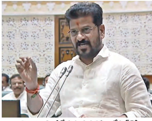
శనివారం అసెంబ్లీలో మాట్లాడుతున్న సిఐం రేవంత్ రెడ్డి