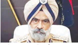
चंडीगढ़, 28 मार्च (एजेंसियां)।

भ्रष्टाचार के खेल में पंजाब के कई अफसर शामिल, सीबीआई ने प्राथमिकी दर्ज की