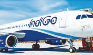
आईजीआई एयरपोर्ट पर इमरजेंसी लैंडिंग, सभी यात्री सुरक्षित

नई दिल्ली, 28 मार्च (एजेंसियां)। दिल्ली के इंदिरा गांधी अंतरराष्ट्रीय एयरपोर्ट पर शनिवार सुबह एक बड़ा हादसा टल गया। बताया जा रहा है कि दिल्ली एयरपोर्ट पर एक फ्लाइट की इमरजेंसी लैंडिंग हुई। सभी यात्री सुरक्षित हैं और किसी नुकसान की खबर नहीं है। फ्लाइट की इमरजेंसी को सुरक्षित निकाला जा चुका है। लैंडिंग की जानकारी मिलने के बाद मौके पर तुरंत फायर ब्रिगेड की गाड़ियां