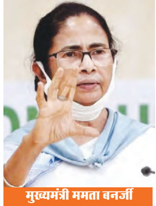
मुख्यमंत्री ममता बनर्जी

मुर्शिदाबाद के रघुनाथगंज इलाके में राम नवमी के जुलूस के दौरान हुई हिंसा को लेकर भी ममता ने बयान दिया। उन्होंने कहा कि प्रशासन ने समय पर कार्रवाई नहीं की। उन्होंने वादा किया कि सत्ता में लौटने के बाद दौषियों पर कड़ी कार्रवाई होगी। राम नवमी के दौरान कई जगह पथरबाजी, आगजनी और तोड़फोड़ की घटनाएं सामने आईं। इसके बाद पुलिस ने जंगीपुर और रघुनाथगंज इलाके में सुरक्षा बढ़ा दी है। चुनावी माहौल में इन घटनाओं ने कानून व्यवस्था पर सवाल खड़े कर दिए हैं।