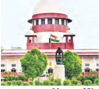
कानून का पालन न होने पर जताई विंता सुप्रीम कोर्ट ने कहा कि इसके बावजूद निचली अदालतों में इस नियम का पालन नहीं हो रहा है। इसके पीछे