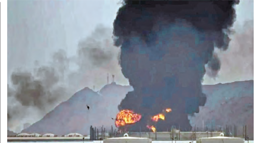
సౌదీలోని అమెరా విమానస్థావరాలపై ఇరాన్ క్షిపణి దాడి దృశ్యం

వైఎస్సార్స్ మళ్లీ పవర్ లోకి రాదు: డి. సిఎం పవన్ 2