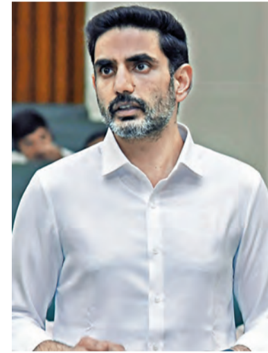
అసెంబ్లీలో తీర్మానంపై చర్చ సందర్భంగా మాట్లాడుతున్న లోకేశ్

చెబుతున్న విషయాన్నీ యువత గమనించాలన్నారు. రాజధానిగా అమరావతిని అభివృద్ధి చేయడంతో పాటు అన్ని జిల్లాలను సమాన దృష్టితో ముందుకు తీసుకెళ్తున్నామని చెప్పారు. మళ్లీ జగన్ మాయలో పడవద్దని ప్రజలకు సూచించారు. రాజధాని అమరావతి వల్ల ఎంతోమంది జీవితాలు మారాయని మంత్రి లోకేశ్ అన్నారు. రాజధాని భూముల ధరలు పెరిగాయన్నారు. ప్రపంచమే ఆశ్చర్యపోయేలా రాజధాని నిర్మించాలని సీఎం చంద్రబాబు ఆకాంక్షింవారని తెలిపారు. రాజధానిగా అమరావతికి చట్టబద్ధత కల్పించాలని కేంద్రాన్ని కోరే తీర్మానంపై చర్చ సందర్భంగా లోకేశ్ మాట్లాడారు. అభివృద్ధిలో ఒకప్పుడు అనంతపురం చివరి స్థానంలో ఉండేదని, కియా పరిశ్రమ వచ్చాక, అనంతపురం 5వ స్థానంలోకి వచ్చిందని గుర్తు చేశారు. అమరావతి కోసం రైతులు పోరాడారు. ఎప్పుడూ గడవ దాటని పనులకు కూడా పోరాడారు. రాజధానిలో తిరగాలంటే జగన్ పరదాలు కట్టుకుని తిరిగేవారు. తప్పు చేశానని జగన్ కు తెలుసు కాబట్టి, పరదాల చాటున తిరిగారు. అందోళన