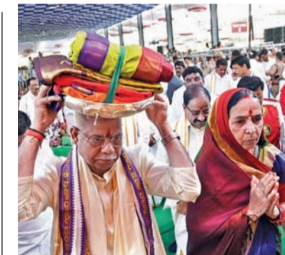
శనివారం భద్రాద్రిలో సీతారాములకు పట్టుపస్త్రాలు సమర్పించేందుకు వెళ్తున్న గవర్నర్ శివప్రతాప్ శుక్లా దంపతులు