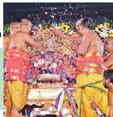
భద్రాద్రిలో శ్రీరామ పట్టాభిషేక దృశ్యం