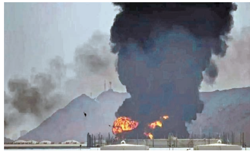
సౌదీలోని అమెరికా విమానస్థావరాలపై ఇరాన్ క్షిపణి దాడి దృశ్యం