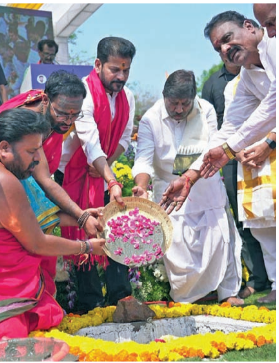
శనివారం ఓంకారేశ్వర ఆలయానికి భూమి పూజాచేస్తున్న సిఎం రేవంత్ రెడ్డి, డి.సిఎం భట్టి

ఆరునూరైనా ప్రాజెక్టు పూర్తి చేసి తీరుతాం మూసీ తీరాన రూ.700 కోట్లతో ఓంకారేశ్వర ఆలయానికి శంకుస్థాపన దక్షిణకాశీగా అభివృద్ధి: సిఎం రేవంత్