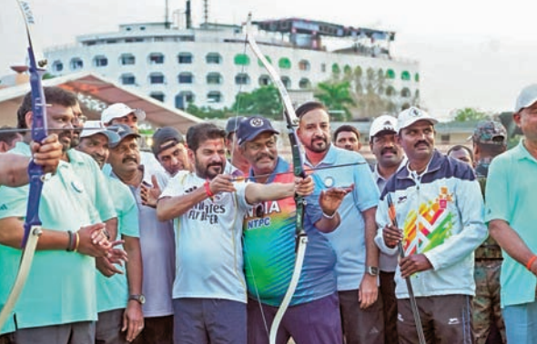
శనివారం సాయంత్రం ఎల్పీ స్టేడియంలో ఎమ్మెల్యే, ఎమ్మెల్సీల క్రీడా పోటీలు ప్రారంభించిన సందర్భంగా పిలువిన ప్రధాన ప్రతినిధి సీఎం రేవంత్ రెడ్డి