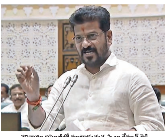
శనివారం అసెంబ్లీలో మాట్లాడుతున్న సిఎం రేవంత్ రెడ్డి