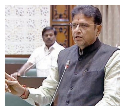
మంది కార్యక్రమాల పనిపోయారని ఆయన ఆవేదన చెందారు. నష్టాల్లో ఉన్న ఆర్టీసీని లాభాల బాటలో పట్టించింది మా కంగ్రెస్ ప్రభుత్వమే అని అన్నారు. పారదర్శకత కోసం సాంకేతిక ఆధారిత వివక్షలకు సంస్కరణలకు శ్రీకారం చుట్టాలని తెలిపారు. ప్రజలకు చెప్పిన ప్రతి మాటను నిలబెట్టుకోవాలమని తమకు ఇంకా మాట్లాడే సమయం ఉందని తర్వాత కూడా తెలంగాణలో అధికారంలోకి వచ్చేది తామనేని స్పష్టం చేశారు. కేంద్రంలోని బిఆర్ఎస్ లోకి వచ్చేదని రాజ్యాంగ సవరణ చేసి అధికారంలోకి ఇచ్చిన హామీని నివేదనస్తామని శ్రీధర్ బాబు అన్నారు.

గురించి మాట్లాడే నైతిక హక్కు వారికి ఎక్కడిదని ప్రశ్నించారు. బీసీ రిజర్వేషన్లపై తమ ప్రభుత్వం రాహుల్ గాంధీ ఆలోచన మేరకు సామాజిక, ఆర్థిక రాజకీయంగా వెనుకబడిన వర్గీతి భాగు పరిచేందుకు అడుగు ముందుకెప్పుంటే ఒక అడుగు ముందుకు పడగానే వది అడుగు వెనక్కి లాగిస్తోందని మండిపడ్డారు. ప్రతి విషయం ప్రజలు గమనిస్తున్నారని ఆయన హెచ్చరించారు. బీసీలపై ప్రైవేటు బాధ్యతాయుతమైన వివక్షం నిర్వాహణకు సలహాలు సూచనలు ఇవ్వాలనివాటి సీక్రెంచేందుకు ప్రభుత్వం సిద్ధంగా ఉందని అన్నారు. పోలీసులకు ఇన్స్ట్రక్షన్లు సమకూర్చడమే పోలీసు సంక్షేమం కాదని వారి నిజమైన సంక్షేమం మేం కట్టుబడి ఉన్నామని శ్రీధర్ బాబు అన్నారు. ఆర్టీసీ నిర్వహణ చేశారని కాబట్టి కుల సమైక్యతను చర్చలకు కూడా చేయలేదని 56