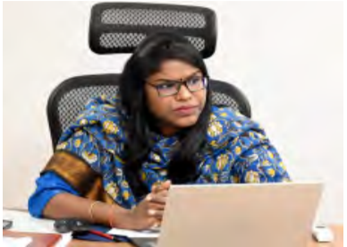
ఏలూరు, మర్చి , 28 ( ప్రభాత వార్త) జిల్లాలో మట్టి అక్రమ తవ్వకాలు, రవాణా చేసే వారిపై కేసులు నమోదు చేయాలని జిల్లా కె. వెట్టిసెల్వీ

అధికారులను ఆదేశించారు. స్థానిక కలెక్టర్ నుండి శనివారం జిల్లాలో మట్టి అక్రమ తవ్వకాలు, రవాణా నియంత్రణపై అధికారులతో మీడియా కాన్ఫరెన్స్ ద్వారా కలెక్టర్ సమీక్షించారు. ఈ సందర్భంగా కలెక్టర్ వెట్టిసెల్వీ మాట్లాడుతూ జిల్లాలో కాలువలు, చెరువు గట్టు, తదితరాల నుండి అనుమతి లేకుండా మట్టిని అక్రమంగా తవ్వి, రవాణా చేయడం చట్టరీత్యా నేరమని, అలా చేసేవారిని ఉపేక్షించేది లేదన్నారు. అక్రమంగా మట్టి తవ్వకాలు కారణంగా కాలువలు, చెరువుల గట్టు బలహీనమవుతాయన్నారు. జిల్లాలో మట్టి అక్రమ తవ్వకాలు, రవాణా నియంత్రణకు ఇరిగేషన్, రెవిన్యూ, పోలీసు అధికారులతో ప్రత్యేక బృందాలను ఏర్పాటుచేసి, గడ్డి నిర్మాణ పెట్టలని, ఎవరైనా అనుమతి లేకుండా మట్టిని తవ్వి, రవాణా చేసే వారిపై కేసులు నమోదు చేసి వాహనాలను సీజ్ చేయాలన్నారు. రైతులు వారి పొలాల్లో అవసరాలకుగు సందంధిత తవ్వకాల్లో వద్ద నుండి మే నిర్మాణాలలోగా అనుమతి తీసుకుని మట్టిని తరలించుకోవచ్చన్నారు. ఇరిగేషన్ శాఖ ఎన్.ఈ డేవప్రకాష్, జిల్లాలోని తవ్వకాల్లో, ఇరిగేషన్, గనులు శాఖ అధికారులు, సిబ్బంది పాల్గొన్నారు.