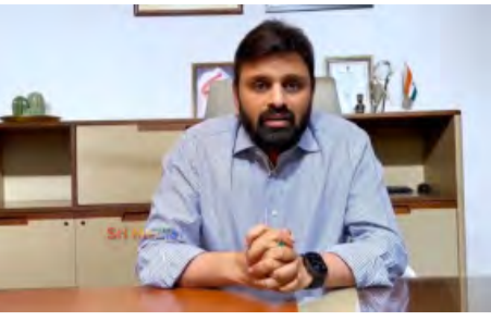
మార్చి, 26 (ఏలూరు జిల్లా బ్యూరో): అఖిలపక్ష హైదరాబాద్ లో ఒక డిన్నర్ పార్టీకి వెళ్లి డ్రగ్స్ ఆరోపణలకు గురైన ఏలూరు

పార్లమెంటు సభ్యులు పుట్టా మహేష్ యాదవ్ కు రోజు రోజుకు ప్రజల మద్దతు పెరుగుతుంది. ఎంపీ మహేష్ కు సంఘీభావంగా ఏలూరు పార్లమెంటు పరిధిలోని సొంత పార్టీ వారో కాకుండా అఖిలపక్ష సమావేశం ఏర్పాటు చేసి అన్ని పార్టీల వారు, దాదాపు అన్ని కులాల వారు సమావేశమై పుట్టా మహేష్ ఆరోపణలు ఖండించారు. ఈ సందర్భంగా పలువురు నాయకులు మాట్లాడుతూ ఎంపీ మహేష్ ను అతి దగ్గరగా చూస్తూ ఉన్నామని అతనికి ఎలాంటి చెడు వ్యవహారాలు తెలియవని, మొదటిసారి ప్రజా ప్రతినిధిగా నమ్మకంతో ఎన్నుకున్న ప్రజలకు ఎన్ని రకాలుగా సేవ చేయాలో అన్ని విధాలా ఆలోచిస్తూ సంబంధిత అధికారులతో చర్చిస్తూ ఉండేవారిని తెలిపారు. ఏలూరు పార్లమెంటు నియోజకవర్గంలో