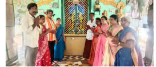
పలుగ్రామల నుండి భక్తులు పెద్ద ఎత్తునపాల్గొని స్వామి వారిని దర్శించుకుని ఆనంతరం ప్రసాదమును స్వీకరించారు.