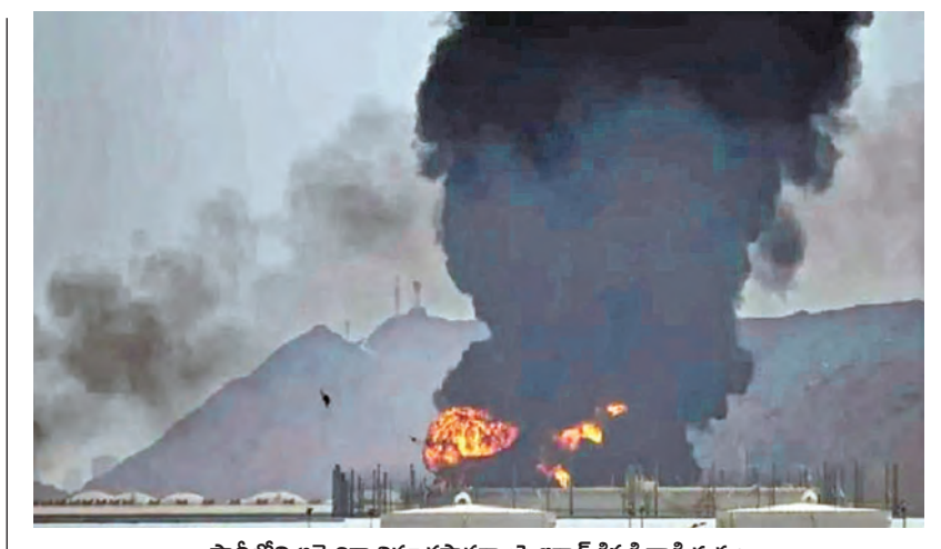
సాదీలోని అమెలకా విమానస్థావరాలపై ఇరాన్ క్షిపణి దాడి దృశ్యం

వైఎస్సార్స్ మళ్లీ పవర్ లోకి రాదు: డి. సిఎం పవన్ 2