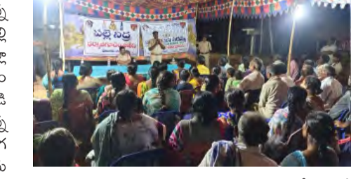
మరియు బాల్య వివాహాల నివారణ వచ్చని పల్లె సీమలో ప్రజలకు ఆర్థిక ఇబ్బందులు కలగజేసే ఆసాంఘిక కార్యకలాపాల కోడి పందాలు, పేకాల మరియు నాలు సారా తయారీ మరియు విక్రయాలు నివారణ కొరకు పోలీస్ సిబ్బంది మారుమూల ప్రాంతాలలో గళాల డ్రోస్ కెమెరా ద్వారా నిఘా చేస్తూ ఆసాంఘిక కార్యకలాపాల నివారణ కొరకు చట్ట ప్రకారం చర్యలు తీసుకుంటామని ప్రజలకు భాగస్వామ్యం తో సమాఖ్యం శాంతి యుతంగా, నేర రహితంగా ముందుకుసాగగలదు. పోలీసు వ్యవస్థపై ప్రజల్లో విశ్వాసం పెంపొందించడం మా ప్రధాన లక్ష్యం అని పేర్కొన్నారు.