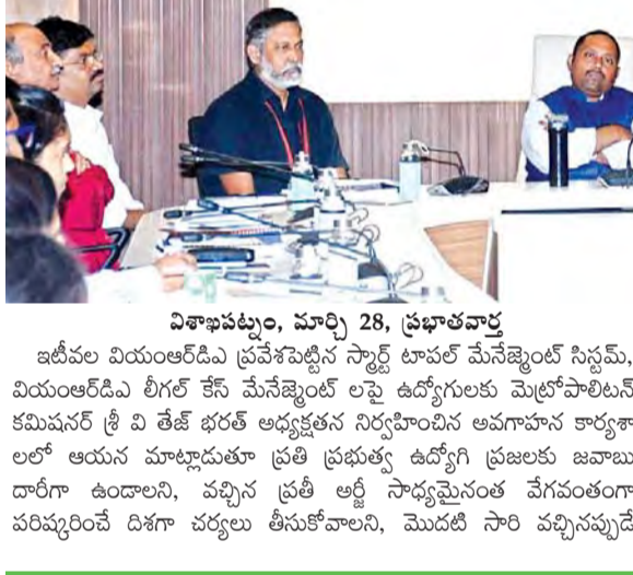
విశాఖపట్నం, మార్చి 28, ప్రభాతవార్త

వాణిని పరిష్కరిస్తే అర్జీలు మళ్లీ మళ్లీ రావని అందుకోసం ప్రతిఒక్కరు నిబద్ధతతో పనిచేయాలని తద్వారా ప్రజాక్షేత్రంలో వియంఆర్డీఎ కి మంచి పేరు వచ్చేలా కృషిచేయాలని సూచించారు. చట్టానికి, ప్రభుత్వ పరిమితులకు లోబడి ప్రతి ఒక్కరినీ తప్పనిసరిగా క్లియర్ చేయాలని దీనికి విభాగాధిపతులు బాధ్యత వహించాలి అన్నారు. పరిష్కారానికి సాధ్యపడని అర్జీలకు సంబంధించి అధికారులకు వివరణాత్మకమైన ప్రత్యక్షతం ఇవ్వాలని, అటువంటి వాటిపై కాలా తీతం