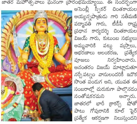
అన్నారూ, లక్షలాదిగా తరలివచ్చే భక్తులు ప్రశాంత వాతావరణంలో దర్శనం చేసుకోవాలని, భద్రతా విధుల్లో ఉన్న పోలీసులకు సహకరించాలని విజ్ఞప్తి చేశారు. పుద్దులు క్యూలైన్లలో ఇబ్బంది పడకుండా సహాయకులను వెంట తెచ్చుకోవాలని, భక్తుల కోసం ప్రత్యేక మెడికల్ క్యాంపులు, ఓఆర్ఎస్ ప్యాకెట్లు, అంబులెన్స్ సౌకర్యాలు అందుబాటులో ఉండేలా పరిష్కారాలు చేపట్టారు. ఇది ప్రాంతంలో స్వస్థి క్షేత్రాన్ని అభివృద్ధి చేసే పాఠ్య పరమేశ్వరుల పురుగుకా పాల్గొన్న నిర్మిస్తున్నామని, దీనివల్ల పక్కాచి పెరిగి స్థానిక చిరు వ్యాపారులకు ఉపాధి అవకాశాలు మెరుగుతాయని పేర్కొన్నారు. గ్రేడ్ 1 మున్సిపల్ కార్పొరేషన్ మారిన నర్సీపట్నాన్ని అన్ని విధాలా అభివృద్ధి చేస్తామని, ఈ జాతరను ప్రజలంతా సమన్వయంతో విజయ వంతం చేయాలని విజయ్ పిలుపునిచ్చారు.