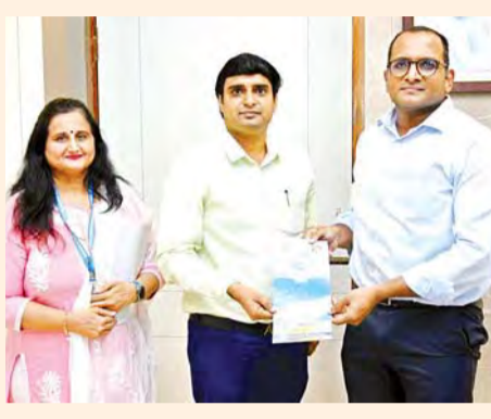
విశాఖపట్నం, మార్చి 28, ప్రభాతవార్త ప్రజా సమస్యల పరిష్కారంలో అధికారులు సానుకూల దృక్పథంతో వ్యవహరించాలని, నిర్ణీత సమయంలో నాణ్యమైన రీతిలో పరిష్కారం చూపింపి ప్రజలకు భరోసా కల్పించాలని జిల్లా పరిషత్ చైరమన్ జిల్లా పరిషత్ సుభద్ర పేర్కొన్నారు.

విశాఖపట్నం, మార్చి 28, ప్రభాతవార్త శాఖపట్నం నగర భద్రతా మండలి (వీసీఎస్సీ) సంయుక్త కార్యదర్శి పవన్ కార్తీక్, ఆసోసియేట్ డైరెక్టర్ సీమా సిక్రి శనివారం జిల్లా కలెక్టర్ కార్యాలయంలో జిల్లా కలెక్టర్ ఎం. ఎన్. హరేంద్ర ప్రసాద్ ని మర్యాదపూర్వకంగా కలిశారు.