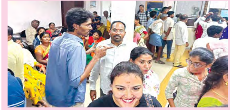
రాష్ట్ర ఖాజానాకు అసలైన పవర్ హౌస్! భీమలి సబ్ లిజస్ట్రార్ కార్యాలయం వద్ద ఇనసందోహం చూస్తుంటే... విశాఖ రియల్ ఎస్టేట్ రేంజ్ ఏంజీ అర్థముపుతోంది!