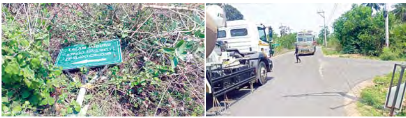
(రాంబిల్లి, మార్చి 28, ప్రభాతవార్త)

రాంబిల్లి మండలంలో మార్గం చూపే దిక్కుచులు లేకపోవడంతో ఉన్నా నేలకొరిగిపోవడంతో వాహనదారులు తీవ్ర ఇబ్బందులు పడుతున్నారు. అమ్మతావురం జంక్షన్లో పై ఓవర్ పనులు జరుగుతుండడంతో వాహనాలు వెంకటాపురం నుండి ఎన్.కె.జెడ్. కాలనీ మీదుగా పరిశ్రమలకు వెళ్ళడానికి తాత్కాలికంగా మార్గాన్ని ఏర్పాటు చేశారు. కానీ వాహనదారులకు మార్గ సూచికలు సరిగ్గా లేకపోవడం కనిపించకపోవడం వలన సుమారు పది కిలోమీటర్ల వరకు రాంబిల్లి మండల కేంద్రానికి చేరుకొని అక్కడ నుండి తిరిగి వెనక్కు వెళ్లి పరిశ్రమలకు చేరుకుంటున్నారు. ఇటీవల గాలులు, వర్షాలు, నిర్వహణ లోపం కారణంగా అనేక చోట్ల సైన్ బోర్డులు పడిపోయి వక్రకూ కొట్టుకుపోయాయి, మరికొన్నిచోట్ల పూర్తిగా నేల మీద పడి కనిపించకుండా పోయాయి, మరి కొన్ని చోట్ల సైన్ బోర్డులు కనిపించకుండా స్థానిక నాయకులు, పుట్టినరోజు పెట్టిరోజు కటార్ట్ అడ్డుగా పెట్టడం వలన రహదారిపై వెళ్లే వాహనదారులు ఎటు వెళ్ళాలో అర్థం కాక ఆగి ఆడగవలసిన పరిస్థితి ఏర్పడుతుంది. ముఖ్యంగా అయిదే ప్రాంతాల నుంచి వచ్చే లారీ డ్రైవర్లు ఎక్కువగా ఇబ్బందులు ఎదుర్కొంటున్నారు. స్థానికులు చెబుతున్న ప్రకారం ఈ సమస్య చాలా రోజులుగా ఉన్నప్పటికీ సంబంధిత అధికారులు పట్టించుకోవడంలేదని ఆరోపిస్తున్నారు. ప్రమాదాలకు దారి తీసే అవకాశం ఉందని వారు ఆందోళన వ్యక్తం చేస్తున్నారు. ఇప్పటికైనా అధికారులు స్పందించి పడిపోయిన సైన్ బోర్డులను వెంటనే పునరుద్ధరించడంతోపాటు కొత్తగా స్థాపించే దిక్కుచులు ఏర్పాటు చేయాలని వాహనదారులు డిమాండ్ చేస్తున్నారు.