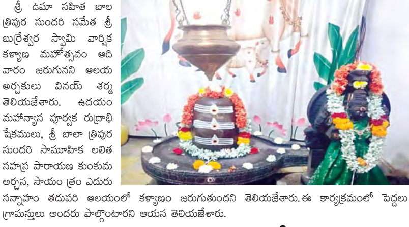
ఎన్.రాయవరం, మార్చి 28, ప్రభాతవార్త

శ్రీ ఉమా సహజ బాల త్రిపుర సుందరి సమేత శ్రీ బుర్రేశ్వర స్వామి వార్షిక కళ్యాణ మహోత్సవం ఆదివారం జరుగునని ఆలయ అధ్యక్షులు వివరాలు తెలియజేశారు. ఉదయం మహానానా పూర్వక రుద్రాభిషేకములు, శ్రీ బాలా త్రిపుర సుందరి సామాహిక లలిత సహస్ర పారాయణ కుంకుమ అర్చన, సాయం త్రం ఎదురు సన్మానం తదుపరి ఆలయంలో కళ్యాణం జరుగుతుందని తెలియజేశారు. ఈ కార్యక్రమంలో పెద్దలు గ్రామస్థులు అందరూ పాల్గొనాలని ఆయన తెలియజేశారు.