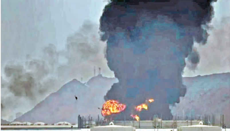
సోదీల్ గి అమెరికా విమానస్థావరాలపై ఇరాన్ క్షిపణి దాడి దృశ్యం

సాక్షిగా ప్రజలకు వివరించారు. 2014-19 మధ్య ప్రతిపక్ష నేతగా అమరావతికి బెహరతుగా మద్దతు ఇచ్చిన జగన్, అధికారంలోకి వచ్చాక ఊసరసపై రాజకీయాలు చేశారని మండిపడ్డారు. మూడు రాజధాని లంటూ రాష్ట్రాన్ని నర్సనాశనం చేసే కుట్రకు తెర తీశారని దుయ్యబట్టారు. ఈ అనుభవం తో భవిష్యత్తులో ఇంకెవ్వరూ రాజ ధాని మార్గాలన్నాలోచన చేయకుండా శాశ్వత రాజధానిగా అమరావతి