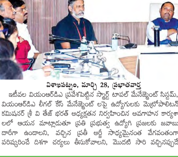
విశాఖపట్నం, మార్చి 28, ప్రభాతవార్త