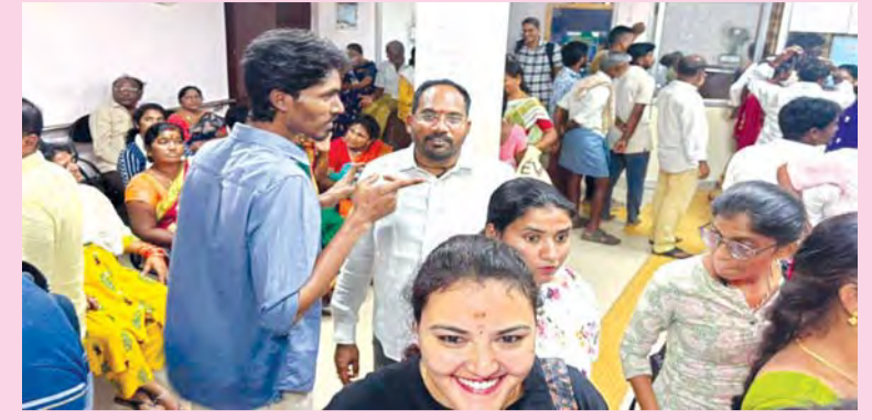
రాష్ట్ర ఖజానాకు అసలైన పవర్ హౌస్! భీమలి సబ్ లిజిస్ట్రేటర్ కార్యాలయం వద్ద జనసందోహం చూస్తుంటే... విశాఖ రియల్ ఎస్టేట్ రేంజీ ఏంజీ అర్థముపుతోంది!