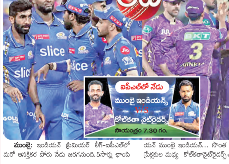
ముంబై: ఇండియన్ ప్రీమియర్ లీగ్-ఐపీఎల్లో మరో ఆకర్షక పోరు నేడు జరగనుంది. 5 సార్లు ఛాంపియన్లుగా నిలిచిన ముంబై ఇండియన్స్... సొంత మైదానం, సొంత ప్రేక్షకుల మధ్య కోల్కతానైట్ రైడర్స్ తో తలపడనుంది.