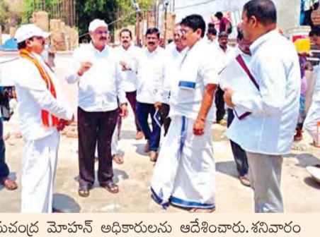
విశాఖలో రియల్ భూం! - భీమలి సబ్ లిజిస్ట్రేటర్ కార్యాలయంలో జనసందోహం - లిజిస్ట్రేషన్ తోసం పోలికైన ప్రజలు - రాష్ట్ర ఖజానాకు అసలైన పవర్ హౌస్ విశాఖ జిల్లా - బిటి సంస్థల ఏర్పాటుతో ఇక రియల్ హీరు