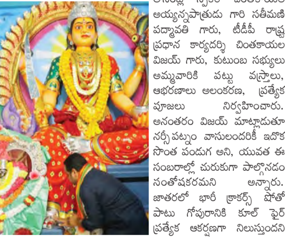
విశాఖపట్నం, మార్చి 28, ప్రభాతవార్త