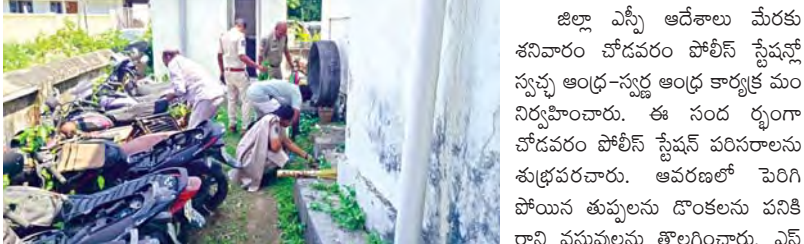
చోడవరం, మార్చి 28, ప్రభాతవార్త

జిల్లా ఎస్పీ ఆదేశాలు మేరకు శనివారం చోడవరం పోలీస్ స్టేషన్లో స్వచ్ఛ ఆంధ్ర-స్వచ్ఛ ఆంధ్ర కార్యక్రమం నిర్వహించారు. ఈ సందర్భంగా చోడవరం పోలీస్ స్టేషన్ పరిసరాలను శుభ్రపరచారు. ఆవరణలో పెరిగి పోయిన తుప్పలను డొంకలను పనికి రాని వస్తువులను తొలగించారు. ఎన్.హెచ్. ఆధ్వర్యంలో ఈ సందర్భంగా స్వచ్ఛత ప్రతిష్ఠి చేశారు.