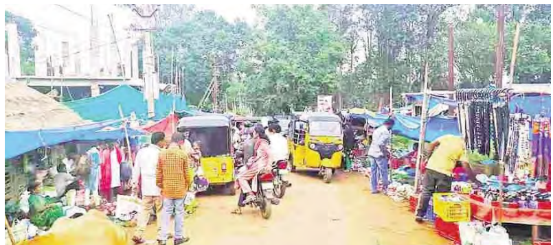
గుర్రాడెం కొత్తవీధి, మార్చి 28, ప్రభాతవార్త