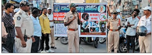
పట్టణంలో నో హెల్మెట్ నో ప్యూర్పూర్ అవగాహన కార్యక్రమాన్ని ఆదివారం

బాపట్ల, మార్చి 29, ప్రభాతవార్త: ద్విచక్ర వాహనదారుల భద్రతే లక్ష్యంగా బాపట్ల పోలీసులు కీక కార్యక్రమం తీసుకున్నారు. జిల్లా ఎస్పీ బి. ఉమామహేశ్వరరావు ఆదేశాల మేరకు, డిఎస్పీ జగదీష్ నాయక్ వర్తమానంలో