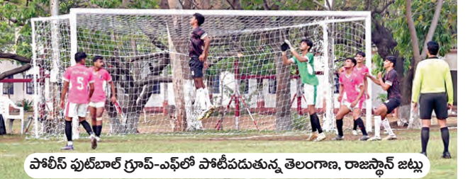
పోలీస్ ఫుట్బాల్ గ్రూప్-ఎఫ్లో పోటీపడుతున్న తెలంగాణ, రాజస్థాన్ జట్టు

హైదరాబాద్, మార్చి 29(వార్తా క్రీడా ప్రతినిధి): హైదరాబాద్ అతిథ్యమిస్తున్న అఖిల భారత పోలీస్ ఫుట్బాల్ ఛాంపియన్ షిప్లో తెలంగాణ పురుషుల జట్టు పరుగుగా రెండో ఓటమి పొందింది. గ్రూప్-ఎఫ్లో పోటీపడుతున్న తెలంగాణ... రెండో మ్యాచ్లో 0-3 గోల్స్ తో రాజస్థాన్ చేతిలో ఓడింది. పూర్వ సమయంలో గోల్ చేయడంలో తెలంగాణ విఫలమైంది. మరోపైపు చక్కని పాసింగ్లతో రాజస్థాన్... తెలంగాణ డిఫెన్స్ను చెదేస్తూ మూడు గోల్స్ సాధించింది. మరో మ్యాచ్లో అస్సాం రైస్ లెఫ్ట్ 5-0 గోల్స్ తేడాతో పడమరపై విజయం సాధించి గ్రూప్-ఎఫ్లో అగ్రస్థానంలో నిలిచింది. కాగా మహిళల గ్రూప్-ఎలో ఎన్ఎస్ఐ గోల్స్ వరకు కురిపించింది. ఏకంగా 16-0 గోల్స్ తో జార్ఖండ్పై గెలుపొందింది. మరో మ్యాచ్లో సిబిఎస్ఐ ఏకైక గోల్తో సీఆర్ఐఎస్పై విజయం సాధించింది. ఏప్రిల్ 5 వరకు జరగనున్న అఖిల భారత పోలీస్ ఫుట్బాల్ ఛాంపియన్ షిప్ మ్యాచ్లు... గచ్చిబౌలిలోని జీఎస్ స్టేడియంలో పాటు ఆర్డీలో గోల్స్, శ్రీనిధి, అజిత్సంగర్ గ్రౌండ్లో జరుగుతున్నాయి.