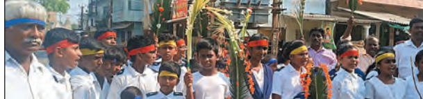
మట్టల ఆదివారం ప్రార్థనలు

మట్టల ప్రదర్శనూ ఊరేగింపు నిర్వహించారు. చర్చిత ప్రత్యేక ప్రార్థనలు చేశారు. మహిళా ఆధిక సంఖ్యలో పాల్గొని ప్రార్థనలు చేశారు.