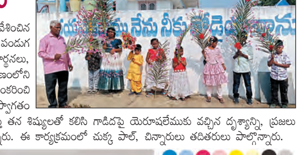
మట్ల ఆదివారం వేడుకలు

నగరం, మార్చి 29, ప్రభాతవార్త: ఏనుకీస్తు యెరుషలేము నగరంలో ప్రవేశించిన జ్ఞాపకార్థం, గుడి ద్రైడికు ముందు వచ్చే ఆదివారం క్రైస్తవులు జరుపుకునే పవిత్రమైన పండుగ మట్ల ఆదివారం. పండుగ సందర్భంగా తాటి మట్లను చేతబాని, ప్రత్యేక ప్రార్థనలు, ఊరేగింపులతో ఏనుకీస్తును స్మరించుకుంటారు. ఈ సందర్భంగా పట్టణంలోని పలు చర్చిల ఆధ్వర్యంలో క్రైస్తవులు, చిన్నారులు తాటి మట్లలకు పుష్పలతో అలంకరించి మట్లలతో ప్రత్యేక గీతాలను ఆలపిస్తూ పట్టణంలో రాల్చి నిర్వహించారు. మినభ్రమపుకు సాగిన పలికారు. పలుచర్చిలలోని పాస్టర్లు విశ్వాసులకు క్రీస్తు నందేసానిచ్చారు. ఏనుకీస్తు తన శిష్యులతో కలిసి గాడిదపై యెరుషలేముకు వచ్చిన దృశ్యాన్ని ప్రజలు తమ తాటి మట్లలను దారితో పరిచి సాగిన పలికిన ఘట్టాలను గుర్తు చేసుకున్నారు. ఈ కార్యక్రమంలో చక్క పాత్, చిన్నారులు తదితరులు పాల్గొన్నారు.