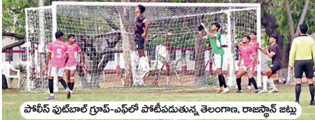
పోలీస్ ఫుట్ బాల్ గ్రూప్-ఎఫ్ లో పోటీపడుతున్న తెలంగాణ, రాజస్థాన్ జట్టు

హైదరాబాద్, మార్చి 29 (వార్తా క్రీడా క్రమిని): హైదరాబాద్ అతిథ్యమిస్తున్న అఖిల భారత పోలీస్ ఫుట్ బాల్ ఛాంపియన్ షిప్ లో తెలంగాణ పురుషుల జట్టు పరుగుగా రెండో ఓటమి పొందింది. గ్రూప్-ఎఫ్ లో పోటీపడుతున్న తెలంగాణ... రెండో మ్యాచ్ లో 0-3 గోల్స్ తో రాజస్థాన్ చేతిలో ఓడింది. పూర్తి సమయంలో గోల్ చేయడంలో తెలంగాణ విఫలమైంది. మరోవైపు చక్కని పానింగ్ లతో రాజస్థాన్... తెలంగాణ డిఫెన్స్ ను చేదీస్తూ మూడు గోల్స్ సాధించింది. మరో మ్యాచ్ లో ఆస్సాం రైస్ లో 5-0 గోల్స్ తేడాతో చండీఘర్ పై విజయం సాధించి గ్రూప్-ఎఫ్ లో ఆగ్రెస్సా నంలో నిలిచింది. కాగా మహిళల గ్రూప్ ఎఫ్ లో ఎన్ఎస్ఐ గోల్స్ వరకు కురిపించింది. ఏకంగా 16-0 గోల్స్ తో జార్ఖండ్ పై గెలుపొందింది. మరో మ్యాచ్ లో సిఐఎస్ఎఫ్ ఏకైక గోల్ తో సీఆర్ఐఎస్ పై విజయం సాధించింది. ఏప్రిల్ 5 వరకు జరగనున్న అఖిల భారత పోలీస్ ఫుట్ బాల్ ఛాంపియన్ షిప్ మ్యాచ్ లు... గచ్చిబౌలిలోని జీఎస్ స్టేడియంలో పాటు ఆర్డీలర్ గోల్డ్ లో, క్రీని, అజీజ్ నగర్ గ్రౌండ్ లో జరుగుతున్నాయి.