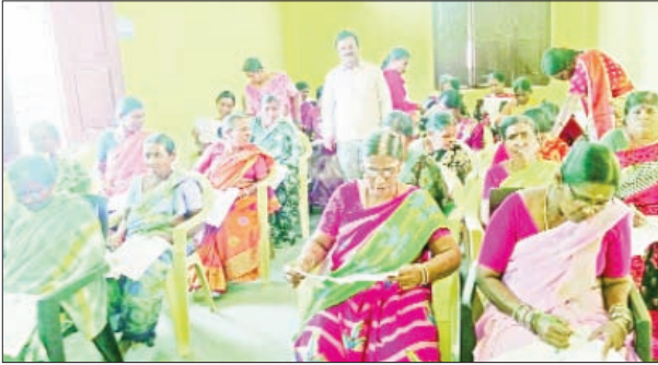
రాజుపేట మార్చి 29 ప్రభాతవార్త

జిల్లా కలెక్టర్ డి ఆర్ డి ఏ పి డి ల సలహాల సూచనల మేరకు ఆదివారం మండలంలో ఉల్లాస్ కార్యక్రమంలో భాగంగా వయోజన విద్య కు సంబంధించిన ఎఫ్ ఎల్ ఎన్ ఏ టి, ఎన్ ఐ ఓ ఎస్ పరీక్షలు నిర్వహించారు. మండలంలో మొత్తం 754 మందికి పరీక్షలు నిర్వహించడం జరిగిందని ఏపీఎం బొమ్మ నరహరి తెలిపారు. ఈ కార్యక్రమంలో ఏపీఎం, సీసీలు, ఏపి ఓ లు పాల్గొన్నారు.