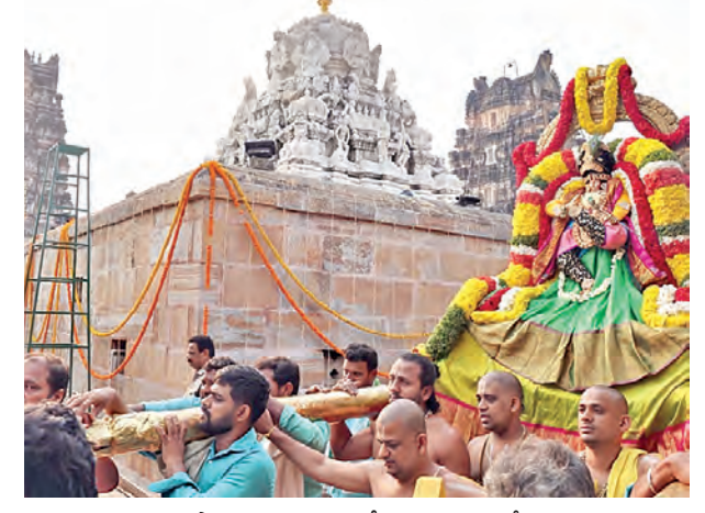
పటపత్ర సాయి అలంకారంలో మురిపిస్తున్న శ్రీరాముడు

గడిపారన్నారు. నేడు మరోమారు అధికారంలోకి వచ్చాక రెండేళ్లలోనే అమరావతి రాజధాని అభివృద్ధి అంటూ రూ.48 వేల కోట్లు అప్పులు చేశారని విమర్శించారు. రాష్ట్ర విభజన అనంతరం రాజధాని నిర్మాణం విభజన చట్టంలోనే నిర్మాణ బాధ్యత కేంద్రానిధి కాదా అని ఆయన ప్రశ్నించారు. కేవలం రాజధాని ప్రాంతంలో ఉన్న నాటి మంత్రులు, టిడిపి నేతల భూముల రేట్లు పెంచుకునేందుకే హక్కు అంటూ ఆరోపించి (వడ్డీ) అంటూ చట్టబద్ధత చేసుకుంటున్నారని ఆయన విమర్శించారు. రాష్ట్ర ప్రజలు ఈ ప్రభుత్వాన్ని ఎన్నుకున్నది రియల్ ఎస్టేట్ వ్యాపారాన్ని చేయడానికే అని ఆయన ప్రశ్నించారు. మరోసారి బీసీ ముఖ్యమంత్రి అవుతారన్న భయం వారిలో స్పష్టంగా కనిపిస్తుందన్నారు. ఆయనకి చంద్రబాబు మరోమారు వెతుకంపాలి ఆడవచ్చని మాట్లాడుతున్నారన్నారు.