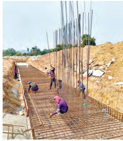
కలిచర్ల వద్ద జరుగుతున్న నీటి వనరుల పనులు

నుంచి కృష్ణ జలాలును, ఏలూరు రిజర్వాయర్ నుంచి కాకినాడ, అనకాపల్లి జిల్లాలకు తాగునీటి అందించేందుకు రూ.3691 కోట్లు, శ్రీకాకుళం జిల్లాలో ఫేస్ 10కింద హీర మండలం రిజర్వాయర్ నుంచి టెక్నాలి, నరసాపురం నియోజక వర్గాలకు నీరందించేందుకు రూ.1204 కోట్లు, అనంతపురం జిల్లాలో పిఎబిఆర్ రిజర్వాయర్ రిజర్వాయర్ ద్వారా ఉరవకోండ నియోజకవర్గం నీరందించేందుకు రూ.480 కోట్లు, రాయదుర్గం నియోజకవర్గానికి