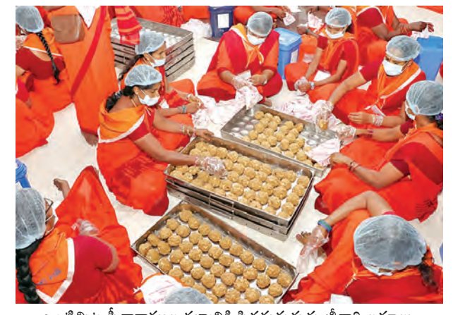
ఒంటిమిట్ట సీతారాముల కల్యాణికి సిద్ధమవుతున్న శ్రీవారి లడ్డాలు

కళాకారుల లక్ష్యాన్ని సృష్టించడం: ఊరేగింపు ముందు సాగిన సాంస్కృతిక కార్యక్రమాలు ప్రత్యేక ఆదర్శంగా నిలిచాయి. వందలమంది కళాకారులు లయబద్ధంగా కోలాటం ఆడుతూ, రామకీర్తనలు పాడుతుంటే మూడో రోజున స్పృశి పాదపత్రంతో మునిగిపోయారు. జానపద నృత్యాలు తప్పకుండా, కొమ్ము నృత్యాలు, హరిదాసుల కీర్తనలు ఈ ఆధ్యాత్మిక వేడుకకు మరింత శోభను చేకూర్చాయి. శాస్త్రీయ నృత్య కళాకారులు రామం తీలలను ఆధీనంపూర్వం చేసిన ప్రదర్శనలు భక్తులను మంత్రముగ్ధులు చేశాయి. పురాణ గాథల ప్రకారం ప్రళయ కాలంలో లోకాలను తన కుక్షిలో దాచుకుని, మర్రి ఆకుపై శరణునిచ్చే ఆ పరమాత్ముని 'వటపత్రసాయి' రూపంలో దర్శించుకోవడం వల్ల నకల పాపాలు తొలగిపోయిన భక్తుల నమ్మకం. ఈ దివ్య వేడుకను వీక్షించే భక్తులు కోడండరాముని కల్యాణం తప్పకుండా ఉండాలని ప్రార్థించారు. ఆలయ అధికారులు భక్తులకు ఎటువంటి ఇబ్బందులు కలగకుండా పటిష్టమైన ఏర్పాట్లు చేశారు. మరోవైపు సీతారాముల కల్యాణం నాటికి ఒంటిమిట్టలో 85 వేల తిరుమల లడ్డాలను