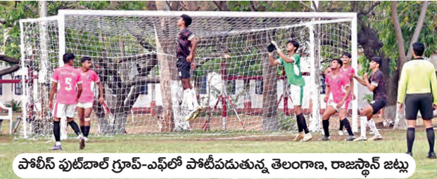
పోస్ట్ ఫుట్బాల్ గ్రూప్-ఎఫ్లో పోటీపడుతున్న తెలంగాణ, రాజస్థాన్ జట్లు

హైదరాబాద్, మార్చి 29(వార్తా క్రీడా ప్రతినిధి): హైదరాబాద్ అతిథ్యమిస్తున్న ఆఖరి భారత పోస్ట్ ఫుట్బాల్ ఛాంపియన్ షిప్లో తెలంగాణ పురుషుల జట్టు పరుగుగా రెండో ఓటమి పొందింది. గ్రూప్-ఎఫ్లో పోటీపడుతున్న తెలంగాణ... రెండో మ్యాచ్లో 0-3 గోల్స్ తో రాజస్థాన్ చేతిలో ఓడింది. పూర్తి సమయంలో గోల్ చేయడంలో తెలంగాణ విఫలమైంది. మరోవైపు వచ్చని పోస్ట్ ఫుట్బాల్లో రాజస్థాన్... తెలంగాణ డిఫెన్స్ను మూడు గోల్స్ సాధించింది. మరో మ్యాచ్లో ఆస్సాం రైఫిల్స్ 5-0 గోల్స్ తేడాతో పండ్లపూర్తి విజయం సాధించి గ్రూప్-ఎఫ్లో ఆగ్రస్థా సంతో నిలిచింది. కాగా మహిళల గ్రూప్-ఎలో ఎస్ఎస్ఐ గోల్స్ వరకు కురిపించింది. సంతో 16-0 గోల్స్ తో జాబ్బాపేట గెలుపొందింది. మరోమ్యాచ్లో సిఐఎస్ఎస్ఐ ఏకైక గోల్తో సీఆర్ఎస్ఎస్ఐ విజయం సాధించింది. ఏప్రిల్ 5 వరకు జరగనున్న ఆఖరి భారత పోస్ట్ ఫుట్బాల్ ఛాంపియన్ షిప్ మ్యాచ్లు.. గచ్చిబౌలిలోని జిఎస్ స్టేడియంలో పాటు ఆర్డర్లో గోల్స్, ప్రీతి, అజీజ్ నగర్ గ్రౌండ్లో జరుగుతున్నాయి.