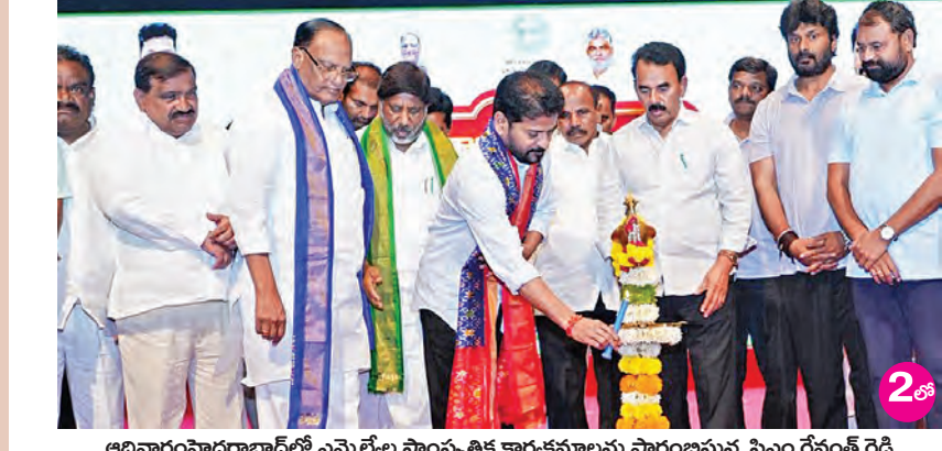
ఆదివారం హైదరాబాద్ లో ఎమ్మెల్యేల సాంస్కృతిక కార్యక్రమాలను ప్రారంభిస్తున్న సిఎం రేవంత్ రెడ్డి