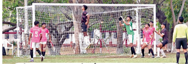
పోలీస్ ఫుట్బాల్ గ్రూప్-ఎఫ్లో పోటీపడుతున్న తెలంగాణ, రాజస్థాన్ జట్లు

హైదరాబాద్, మార్చి 29(వార్తా క్రీడా ప్రతినేది): హైదరాబాద్ అతిథిమిమ్మిన్సు అఖిల భారత పోలీస్ ఫుట్బాల్ ఛాంపియన్ షిప్లో తెలంగాణ పురుషుల జట్టు వరుసగా రెండో ఓటమి పొందింది. గ్రూప్-ఎఫ్లో పోటీపడుతున్న తెలంగాణ... రెండో మ్యాచ్లో 0-3 గోల్స్ తో రాజస్థాన్ చేతిలో ఓడింది. పూర్తి సమతుల్యంగా గోల్ చేయడంలో తెలంగాణ విఫలమైంది. మరోవైపు చక్కని పోలింగ్తో రాజస్థాన్... తెలంగాణ డిఫెన్స్ను ముందుగా గోల్స్ సాధించింది. మరో మ్యాచ్లో ఆస్సాం రైస్లెట్స్ 5-0 గోల్స్ తో ఛాంపియన్లపై విజయం సాధించి గ్రూప్-ఎఫ్లో అగ్రస్థానంలో నిలిచింది. కాగా మహిళల గ్రూప్-ఎలో ఎన్ఎన్ఐ గోల్స్ వద్ద కురిపించింది. ఏకంగా 16-0 గోల్స్ తో ఛాంపియన్లపై గెలుపొందింది. మరో మ్యాచ్లో సిఐఎస్ఎఫ్ 5వై క గోల్స్ తో సీఆర్ఎఫ్ఎఫ్పై విజయం సాధించింది. ఏప్రిల్ 5 వరకు జరగనున్న అఖిల భారత పోలీస్ ఫుట్బాల్ ఛాంపియన్ షిప్ మ్యాచ్లు... గచ్చిబౌలిలోని జీఎస్ స్టేడియంలో పాటు ఆర్బిలీ గోల్ఫ్ గ్రౌండ్, శ్రీనిధి, అజీజ్ నగర్ గ్రౌండ్లో జరుగుతున్నాయి.