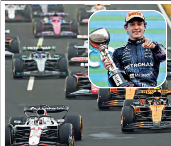
సూజా(జపాన్): 19వట్ల జటాలియన్ ఫార్ములా వన్ డ్రైవర్ కిమి అంటోనెల్లి... జపాన్ గ్రాండ్ ప్రీ గెలుపొందాడు. రెండు వారాలలో మొగ్గి డెన్కు డ్రైవర్లు ఇది రెండో గ్రాండ్ ప్రీ విజయం. బ్యాక్ టు బ్యాక్ విజయాలతో ప్రపంచ ఛాంపియన్ షిప్ రేసులో టాప్ పొజిషన్లోకి దూసుకొచ్చాడు. ఫాన్ఫూలా వన్ చరిత్రలో ప్రపంచ ఛాంపియన్ షిప్ పొందినట్లు చట్టిక