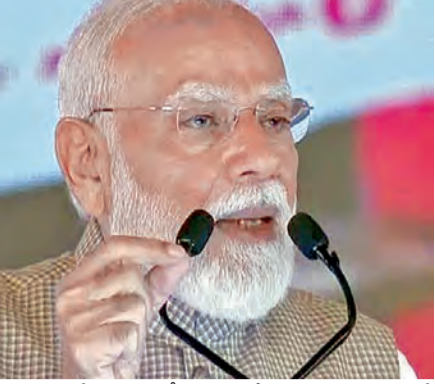
ఎదుర్కొంటోందని మోడీ స్పష్టం చేశారు. ఇది సవాళ్లతో కూడిన సమయమని పేర్కొంటూ, ఈ సంక్షోభాన్ని అధిగమించడానికి పౌరులందరూ

ప్రాంతాలలో యుద్ధాలు, ఘర్షణలు నిరంతరం కొనసాగుతున్నాయని తెలిపారు. గత నెల రోజులుగా పొరుగు ప్రాంతంలో జరుగుతున్న భీకర పోరాటాన్ని ప్రత్యేకంగా ప్రస్తావించారు. ఈ ప్రాంతాలలో, ముఖ్యంగా గల్ఫ్ దేశాలలో పనిచేస్తున్న లక్షలాది మంది భారతీయులకు కుటుంబ సభ్యులు, బంధువులు ఉన్నారని ప్రధానమంత్రి పేర్కొన్నారు. అక్కడ నివసిస్తున్న కోటి మందికి పైగా భారతీయులకు మద్దతు ఇస్తున్నందుకు గల్ఫ్ దేశాలకు మోడీ కృతజ్ఞతలు తెలిపారు. యుద్ధం జరుగుతున్న ప్రాంతం భారతదేశ ఇంధన అవసరాలకు ప్రధాన కేంద్రమని ప్రధాన మంత్రి మోడీ అన్నారు. ఇది పెట్రోల్, డీజిల్ విషయంలో ప్రపంచవ్యాప్త సంక్షోభానికి దారితీస్తోందని వెల్లడించారు. భారతదేశం తన ప్రపంచ సంబంధాలు, గత దశాబ్ద కాలంలో పొందిన బలం కారణంగా ఈ పరిస్థితులను బలంగా