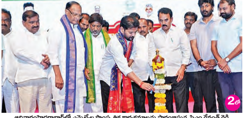
ఆదివారం హైదరాబాద్ లో ఎమ్మెల్యేల సాంస్కృతిక కార్యక్రమాలను ప్రారంభిస్తున్న సిఎం రేవంత్ రెడ్డి