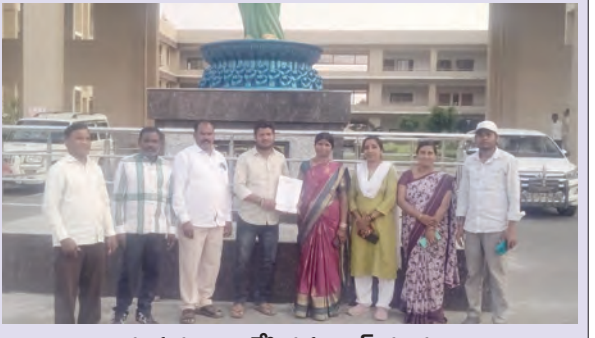
వినతిపత్రం అందజేసిన సర్పంచ్ తదితరులు