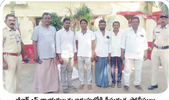
బీఆర్ఎస్ నాయకులను అదుపులోకి తీసుకున్న పోలీసులు