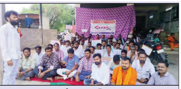
ధర్మా చేస్తున్న విద్యుత్ కార్మికులు