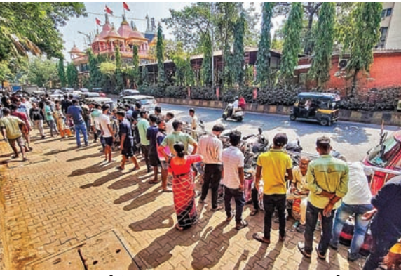
ముంబయిలో సోమవారం ఎలెక్షన్ గ్యాస్ సిలిండర్ కోసం ఓ ఎలెక్షన్ వద్ద భార్యలు తీరిన వినయోగదారులు