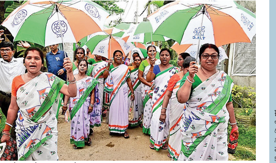
కోల్ కతాలోని కబర్ డంగాలో సోమవారం ఎన్నికల ప్రచారం నిర్వహిస్తున్న టిఎంసీ మద్దతుదారులు

>>> ప్రారంభం అనేది ఇప్పటికీ లేదు. ఇదిలా ఉంటే సోమవారం కూడా కులైట్ ఇంధన ప్లాంట్ను ఇరాన్ క్షిపణి దాడితో పెద్ద విఘాతం కలిగింది. విద్యుత్, జలశక్తి ప్లాంట్లపై దాడితో అక్కడ పనిచేస్తున్న భారతీయుడు మృతిచెందాడు. ఇప్పుడు ఇరాన్ రహస్యంగా అబూబాబు తయారుచేస్తోందని, అందుకే నిల్వలు పెంచుకుంటున్నారని ముందునుంచి అరోపిస్తున్న అమెరికా ఇప్పుడు ఇరాన్ వద్దనడ ఉన్న 400 కిలోల యూరేనియం సాధించినట్లు కోవాలన్న లక్ష్యంతో భూతల దాడులకు సన్నాహాలుచేస్తోంది. అందుకు బ్రంట్ మైగ్ గేమ్ మళ్లీ ప్రారంభించారు. అలాగే ఇరాన్ లోని భారజల ఉత్పత్తినే కేంద్రంపై క్షిపణులు దాడితో ఆ కేంద్రం పూర్తిగా ద్వంసం అయింది. ఇదిలా ఉంటే హ్యూజ్ జలసంధిపై బ్రంట్ మళ్లీ తనపంతు హెచ్చరికలు ప్రారంభించారు. హ్యూజ్ ను ప్రారంభించకపోతే ఖర్గ్ ద్వీపాన్ని నాశనం చేసేస్తామని హెచ్చరించారు. సత్వరమే ఒప్పందాలకు రావాలని, చర్చలకు రావాలని వ్యవధి తగ్గుతున్నట్లు ఉద్ఘోషించారు మరంతామెరుగుతాయన్న హెచ్చరికలు చేయడంతో రెండవశాలమధ్య మళ్లీ ఉద్ఘాతం పెరిగిందని ఈ వ్యాఖ్యలు దోహదం చేస్తున్నాయి. ఇరాన్ అంతటా విస్తరించిన విద్యుత్ ఉత్పత్తి కేంద్రాలు, చమురు బావులు, ఖర్గ్ ద్వీపం పూర్తిగా తుడిచిపెట్టేస్తామని హెచ్చరించారు. అసలు అబూ శక్తి పై నా రగడ ప్రారంభం కావడంతో అబూ ఒప్పందం నుంచి వైదొలగడమే మంచిదన్న భావనతో ఉంది. ఇప్పటికీ ఇరాన్ లో అబూ రెబెనాన్, ఇబు ఇరాన్ లపై దాడులు చేస్తున్నా ఉంది. మౌలికసౌకర్య అభివృద్ధి చేస్తున్న దాడుల్లో అమాయక పౌరులు కూడా సమీపిస్తోవుతున్నారు. ఇరాన్ లపై గేర్ల వేశాలపై చేస్తున్న దాడులు అందోళనకు గురిచేస్తున్నాయి. చౌకధారు డ్రోన్లు, క్షిపణులతో సహా సైన్య దళాలు ఇరాన్ గడగడలాడిస్తోంది. కులైట్ లో జరిగిన దాడి ఈ తరహాలోనే కావడం గమనార్హం.