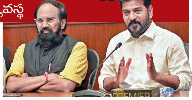
సోమవారం మీడియా విట్‌చాట్‌లో సీఎం రేవంత్. చిత్రంలో మంత్రి ఉత్తమ్

పంట మార్పిడిపై రైతులకు అవగాహన కెసిఆర్ వల్లే నాకు గుర్తింపు.. ఆయన లేకపోతే నా మంచి పనులు తెలిసేవి కావు 50% సీట్లు పెంచితే దక్షిణాదికి అన్యాయం క్యాబ్లలో మీడియాతో సీఎం రేవంత్