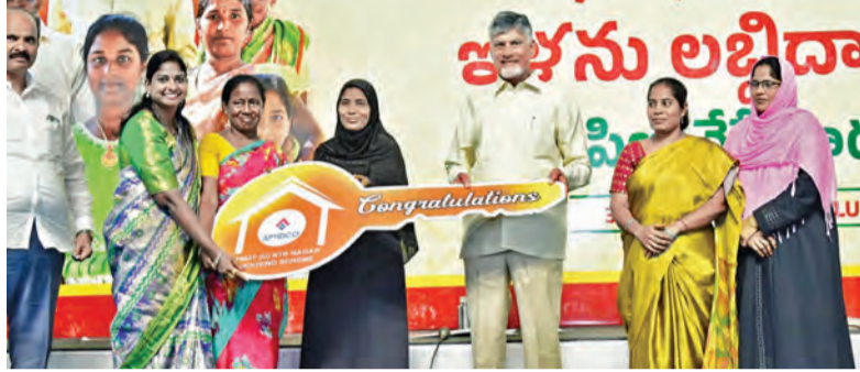
సోమవారం నాయుడు పేటలో లక్షల ఇళ్లకు గ్యాస్ లైన్లు అందించే ఉత్సవంలో సిఎం చంద్రబాబు

రాష్ట్రంలో ఇళ్లులేని పేదలు ఇక కనిపించరు ప్రతి ఇంటికి ఫైవ్ లైన్ ద్వారా గ్యాస్ రేపటి నుంచి ఆకస్మిక తనిఖీలు నాయుడు పేటలో టీడీకే ఇళ్లు ప్రారంభోత్సవంలో సిఎం చంద్రబాబు