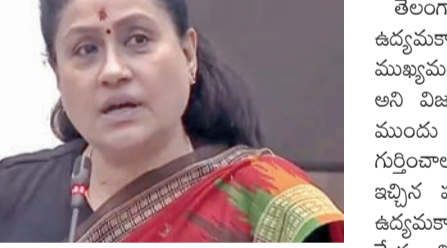
దాటిపోయిందని, ఉద్యమకారులకు ఇంకా న్యాయం జరగడం లేదన్నారు. ఉద్యమకారులకు ప్రయోజనం చేస్తామని చెప్పామని ఇప్పుడు ఉద్యమకారులు అదే విషయాన్ని అడుగుతున్నారని అన్నారు. ఉద్యమకారులపై ఉన్న కోటులు ఎత్తివేసి జూన్ 2న వారికి తెలంగాణ ఉద్యమకారులకు ప్రభుత్వ గుర్తింపు కార్డు ఇస్తామని హామీ ఇచ్చామని, అది ఇంకా ఇవ్వలేదన్నారు. ఉద్యమకారులకు ఎన్నికల సందర్భంగా ఇచ్చిన

హైదరాబాద్, మార్చి 30, ప్రభాతవార్త: తెలంగాణ ప్రత్యేక రాష్ట్ర సాధనలో పాల్గొన్న ఉద్యమకారులను గుర్తించి వారికి తగిన గౌరవం కల్పిస్తూ, వారికి పునరావాసం కల్పించాలని శాసనమండలిలో కాంగ్రెస్ ఎమ్మెల్యే విజయశాంతి ప్రభుత్వానికి విజ్ఞప్తి చేశారు. సోమవారం జరిగిన శాసనమండలి బడ్జెట్ సమావేశాల్లో భాగంగా స్టేషన్ మెన్షన్ సమయంలో కాంగ్రెస్ ఎమ్మెల్యే విజయ శాంతి మాట్లాడుతూ, తెలంగాణ ఉద్యమంలో ప్రాణాలర్పించిన వారి కుటుంబాలలో ఒకరికి ప్రభుత్వ ఉద్యోగం ఇస్తామని, నెలకు రూ.25 లక్ష అమరవీరుల గౌరవ పెన్షన్ ఇస్తామని హామీ ఇచ్చామని గుర్తు చేశారు. కాంగ్రెస్ పార్టీ అధికారంలోకి వచ్చి రెండేళ్లు