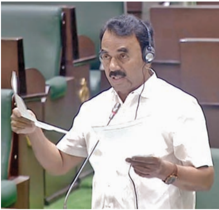
ఈ సందర్భంగా మంత్రి జూపల్లి మాట్లాడుతూ రాష్ట్రంలో మొదటి అమ్మకపు దశలో మాత్రమే పన్ను విధించే నిబంధనను రిలయన్స్ బిఐ మెదిలితీ లిమిటెడ్ తమ ఆంధ్రతర లావాదేవీ ద్వారా అనుకూలంగా

హైదరాబాద్, మార్చి 30, ప్రభాతవార్త: తెలంగాణ పట్ల కేంద్రం సవతి తల్లి ప్రేమ చూపిస్తోందని మంత్రి జూపల్లి కృష్ణారావు ధ్యజుమతాడు. తెలంగాణ వ్యాజ్య ఆడెడ్ టాక్స్ రిలయన్స్ బిఐ మెదిలితీ లిమిటెడ్ మెదిలితీ సవరణ బిల్లు-2026ను శాసన సభలో సోమవారం ముఖ్యమంత్రి కేవలంకేరెడి తరపున మంత్రి జూపల్లి కృష్ణారావు ప్రవేశపెట్టగా సభ ఆమోదించింది. బిల్లుపై సభలో విస్తృత చర్చ జరగగా పార్లమెంట్ శరణి మాట్లాడుతూ డిజిటల్, షెల్లోల్పై వ్యాట్ తగ్గించాలని డిమాండ్ చేయడంతో కేంద్రం రాష్ట్రాల నుంచి తీసుకోని వెళ్ళిన మొత్తం రాష్ట్రాలకు తిరిగివెళ్ళిస్తే వ్యాట్ తగ్గిస్తామని చెప్పారు.