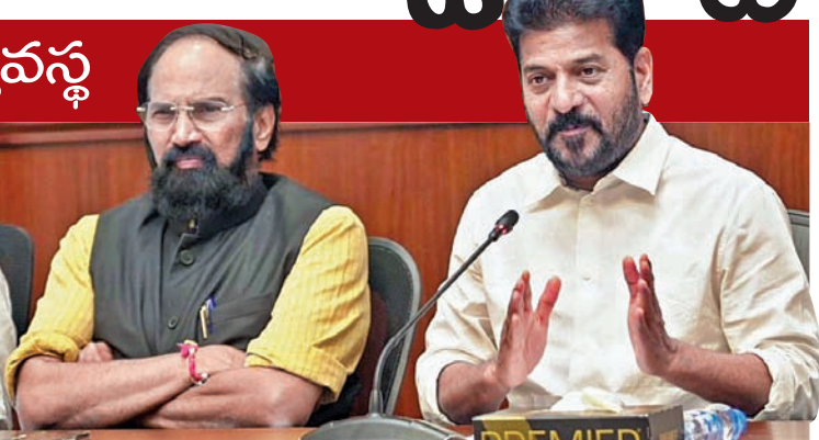
సోమవారం మీడియా విల్ చాట్ లోని సీఎం రేవంత్. చిత్రంలో మంత్రి ఉత్తమ్

పంట మార్పిడిపై రైతులకు అవగాహన కెసిఆర్ వల్లే నాకు గుర్తింపు.. ఆయన లేకపోతే నా మంచి పనులు తెలిసేవి కావు 50% సీట్లు పెంచితే దక్షిణాదికి అన్యాయం