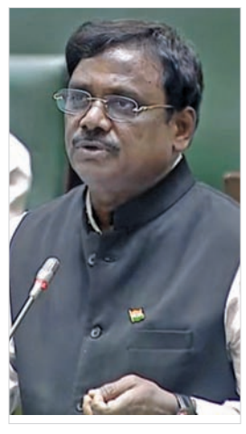
ముఖ్యాంశాలు: గిర్ కార్మికుల రిజిస్ట్రేషన్, పర్యవేక్షకుల సామాజిక భద్రత, సంక్షేమ బోర్డును ఏర్పాటు చేస్తారు. ఇందులో మహిళలు, డివ్యాంగులకు ప్రాతినిధ్యం ఉంటుంది. ప్లాట్ ఫాం ఆధారిత కార్మికులందరికీ ప్రత్యేక గుర్తింపు సంఖ్య (యూఐడీ) కేటాయిస్తారు. దీని ద్వారా ప్రభుత్వ పథకాలు నేరుగా వారికి అందుతాయి. అగ్రగణ్య (సంస్థలు) జరిపే లావాదేవీల నుంచి 1శాతం నుంచి 2 వరకు నిధులను సేకరించి, వాటిని సంక్షేమ నిధికి జమ చేస్తారు. ఈ నిధిని కార్మికుల బీమా, యాక్సిడెంట్ ఇన్సూరెన్స్, పెన్షన్, ప్రసూతి ప్రయోజనాలకు ఉపయోగిస్తారు. యాజమాన్యాలకు, కార్మికులకు మధ్య వచ్చే తగాదాలను పరిష్కరించేందుకు బలోపేతమైన యంత్రాంగాన్ని ఏర్పాటు చేస్తారు. జబ్బుదల నివారణకు ఫ్లాట్ ఫాం స్టాయి కమిటీలు పనిచేస్తాయి.

అసెంబ్లీలో బిల్లుకు ఆమోదం వర్కర్లను వేధిస్తే లగ్రిగేటర్లకు జరిమానా కార్మిక మంత్రి వివేక్ వెంకటస్వామి హైదరాబాద్, మార్చి 30, ప్రభాతవార్త: గిర్ వర్కర్ల హక్కులు, భద్రత విషయంలో రాష్ట్ర ప్రభుత్వం కీలక అడుగు వేసింది. గిర్ వర్కర్ల బిల్లును తెలంగాణ అసెంబ్లీ ఆమోదించింది. గిర్ వర్కర్ల బిల్లును కార్మికశాఖ మంత్రి వివేక్ వెంకటస్వామి అసెంబ్లీలో ప్రవేశపెట్టగా పూర్తిస్థాయిలో చర్చించిన తర్వాత సభ ఆమోదం తెలిపింది. గిర్ వర్కర్లను పట్టించుకోవాలి అగ్రగణ్యం రూ.50వేలపెనాల్టీ వేస్తామని మంత్రి వివేక్ వెంకటస్వామి హెచ్చరించారు. గిర్ వర్కర్లతో స్వయంగా మాట్లాడి డ్రాఫ్ట్ బిల్లు సిద్ధం చేశామన్నారు. ఈ చట్టంతో కంపెనీలకు ఎలాంటి నష్టం ఉండదన్నారు. గిర్ వర్కర్లకు ప్రత్యేకంగా సంక్షేమ నిధితోపాటు ఫిర్యాదుల కోసం గ్రీవెన్స్ సెల్ ఏర్పాటు చేస్తామని చెప్పారు. డిజిటల్ అక్రమ వ్యవస్థలో గిర్ వర్కర్లకు చట్టబద్ధ గుర్తింపు ఇవ్వడమే లక్ష్యంగా ఈ బిల్లును తీసుకోవాలి చెప్పారు. వర్కర్ల హక్కులు, గౌరవం, జీవనోపాధిని కాపాడే విధంగా నిబంధనలు రూపొందించామన్నారు. గిర్ వర్కర్లకు రిజిస్ట్రేషన్ చేసుకుంటే యూనిట్ ఐడీ వస్తుందని చెప్పారు. సిగ్నల్, జోమాలో ఇలా అన్ని కంపెనీలకు ఒకటే ఐడీ ఉంటుందన్నారు. గిర్ వర్కర్ల తమ సమస్యలు కమిటీకి చెప్పకోవచ్చని అన్నారు. ఫిర్యాదుల పరిష్కారం కోసం ప్రత్యేక అధికారులతో పాటు ఫ్లాట్నామ్ స్టాయి కమిటీలను ఏర్పాటు చేస్తామని చెప్పారు. కాగా.. గిర్ వర్కర్ల బిల్లుపై చర్చలో మంత్రి పాస్ పుస్తకం ప్రభాకర్ మాట్లాడుతూ.. శాసనసభలో మంత్రి వివేక్ వెంకటస్వామి గిర్ వర్కర్ల బిల్లును తేవడం నంతోపాటు ఉండన్నారు.