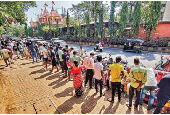
ముంబయిలో సోమవారం ఎలెక్షన్ గ్యాస్ సిలెండర్ కోసం ఓ షెజ్మీ వద్ద భారులు తీరిన వినియోగదారులు