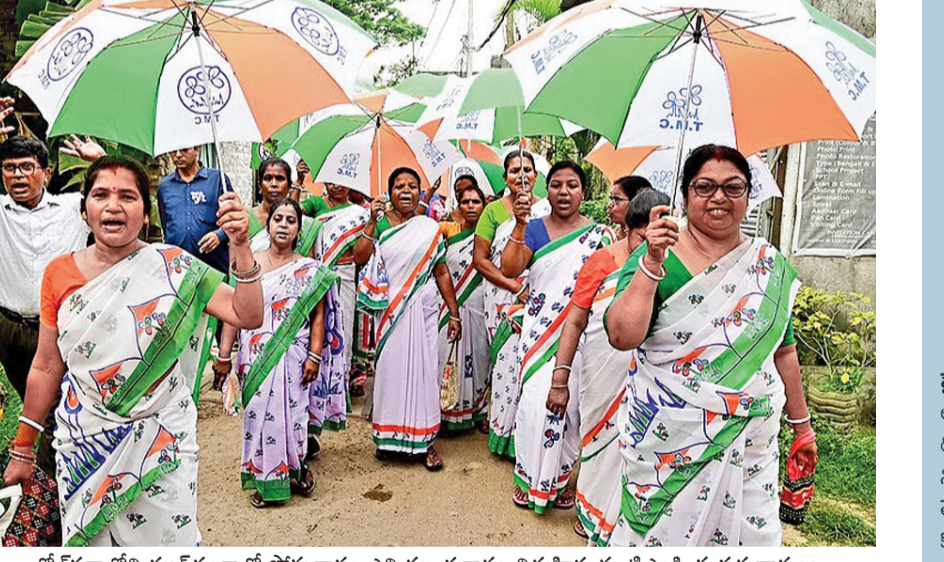
కోల్కతాలోని కలెండంగాలో సోమవారం ఎన్నికల ప్రచారం నిర్వహిస్తున్న డిఎంపి మద్దతుదారులు