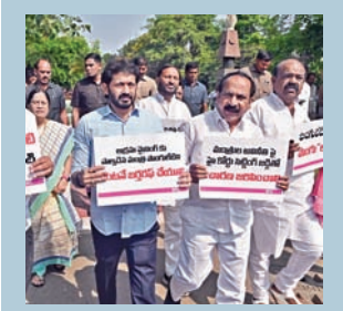
సోమవారం గనపాడు వద్ద ఆందోళన చేస్తున్న బిఆర్ఎస్ ఎమ్మెల్యేలు

బిఆర్ఎస్ ఎమ్మెల్యేల సస్పెన్షన్ మండలిలో వెల్లోకి వెళ్లి ఆందోళన చేసిన సభ్యులు