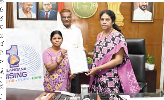
మహాలక్ష్మి పథకం మహిళలకు వరం