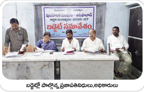
బడ్జెట్లో పాల్గొన్న ప్రజాపతినిధులు, అధికారులు