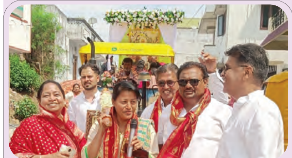
శోభయాత్రలో పాల్గొన్న జైనులు