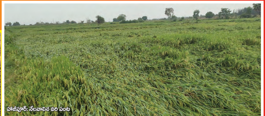
హజీపూర్: నేలవాలిన వరి పంట

రోడ్డు భద్రతా నియమాలు పాటిస్తూ ప్రమాదాలను నివారించండి