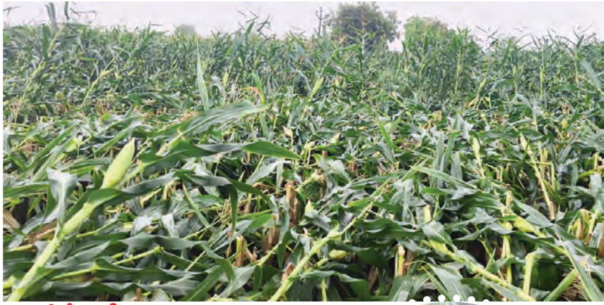
పర్మానిక్ నేలకొలిగిన మొక్కజొన్న పంటలు