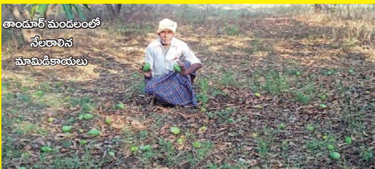
తాండూర్ మండలంలో నేలరాలిన మామిడికాయలు