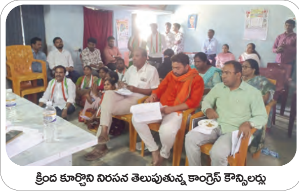
క్రింద కూర్చొని నిరసన తెలుపుతున్న కాంగ్రెస్ కౌన్సిలర్లు