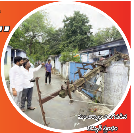
మంచీర్యాల: విరిగిపడిన విద్యుత్ స్తంభం