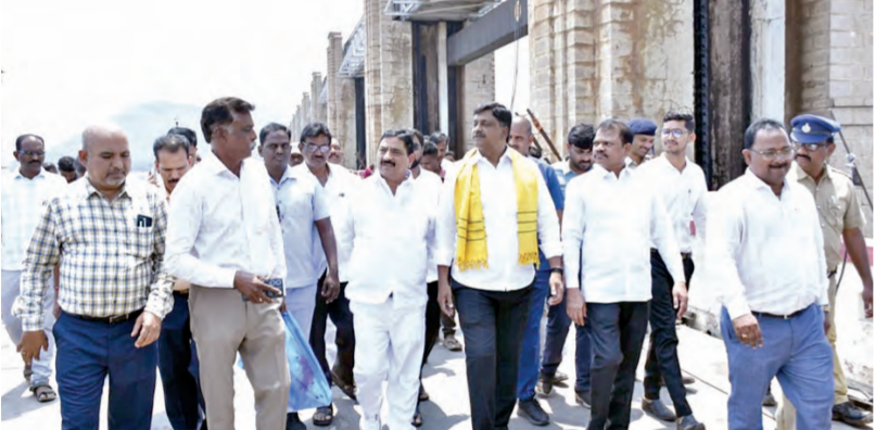
టీబి డ్యాం వద్ద కొత్త గేట్లు అమర్చు పనులను పరిశీలిస్తున్న మంత్రి పయ్యపుల, ఎమ్మెల్యే కాలువ శ్రీనివాస్, ఇతర అధికారులు

గేట్ల పనులను ఎమ్మెల్యే కాలువ శ్రీనివాసులుతో కలిసి పరిశీలించిన మంత్రి పయ్యపుల