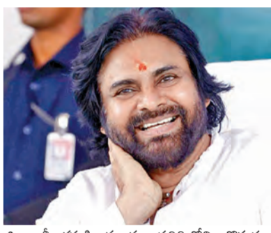
గమనార్గం. ముఖ్యంగా మహిళలకు స్వేచ్ఛార్పక వాతావరణం గల వంచాయతీరా తీరువతి

విజయవాడ, మార్చి 31 ప్రభాతవార్త ప్రతినిధి: ఆంధ్రప్రదేశ్ వంచాయతీరాజ్ శాఖ జాతీయ స్కాయల్లో కల్లపల్లి పోలీస్ స్టేషన్ లో పేలుడు చేసిన టాపానులు పరిశీలిస్తుండగా పేలుడు సంభవించింది. పేలుడు దాటికి స్టేషన్ భవనం ధ్వంసమైంది. ఈ ఘటనలో నలుగురు పోలీసులకు తీవ్ర గాయాలయ్యాయి, ఇద్దరి పరిస్థితి విషమంగా ఉంది. పోలీసులు బయట నుంచి టాపానులు, ముందు గుండీ సామాగ్రిని తీసుకోవచ్చారు. వీటిని స్టేషన్లో పరిశీలిస్తుండగా పేలుడు సంభవించిందని చెబుతున్నారు. దంపనతోయిన దుర్గాజి నేయులు, డ్రైవర్, మరో ఇరువురు కానిస్టేబుల్స్ పరిశీలించి పేలుడు అక్కడ ఉన్నారని, డ్రైవర్ కి తీవ్ర గాయాలు కాగా ఇరువురు కానిస్టేబుల్స్ గాయాలపాలైనట్లు తెలుస్తోంది. ఈ ఘటనలో చల్లపల్లి ఎస్పీకి కూడా తీవ్ర గాయాలయ్యాయి. వీరిని వెంటనే స్థానికంగా ఉన్న కీర్తిహాస్పిటల్ కి తరలింపి చికిత్స అందిస్తున్నారు. ప్రమాదంలో ఒక కారు కూడా దగ్గమైంది. >>2