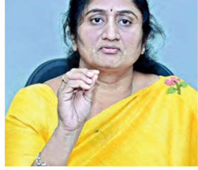
వేస్తున్నారు. ఎన్ఐఆర్ భరోసా పెన్షన్ కింద 92,724 మంది నేతన్నలకు రూ.3వేల నుంచి రూ.4వేల వరకు పెన్షన్ మొత్తం పెంచారు. రాష్ట్రవ్యాప్తంగా విస్తృతంగా క్లస్టర్లు ఏర్పాటు చేస్తున్నారు. చేనేత రంగాభివృద్ధి కోసం ముమ్మడి సరుకులపై సబ్సిడీ, నెట్ ఫండ్ అం దణేస్తూ, ఆధునిక డిజైన్లపై శిక్షణ అందిస్తున్నారు. పనిముట్ల కొనుగోలుకు 90శాతం వరకు సబ్సిడీతో అండజేస్తున్నారు. అవార్డుల వెలుగు కూటమి ప్రభుత్వ ప్రోత్సాహంతో ఏపీ చేనేతరంగం అభివృద్ధి పథంలో దూసుకెళ్తు

సచివాలయం, మార్చి 31 ప్రభాతవార్త: రాష్ట్రంలో చేనేత పరిశ్రమల అభివృద్ధికి కూటమి ప్రభుత్వం అధిక ప్రాధాన్యత ఇస్తుంది. నేతన్నలకు వ్యక్తిగత లబ్ధి కలిగించేలా ఒకవైపు సంక్షేమ పథకాలు అమలు చేస్తూనే, మరో పరిశ్రమ అభివృద్ధికి పాల సీలు తీసుకోస్తుంది. ఆలాడు ఎన్ఐఆర్ కూడు, గూడు, గుడ్ల నివాసంతో చేనేత రంగానికి అండగా నిలచారు. ఆయన స్ఫూరితో పాలన సాగిస్తున్న సీఎం చంద్రబాబు చేనేత రంగాభివృద్ధికి ఎన్నో ప్రణాళికలు రూపొందిస్తున్నారు. సూతన టెక్స్ టైల్స్ పాలసీలు అమలు చేయడం, మోగా క్లస్టర్లు, టెక్స్ టైల్స్ పార్కులు ఏర్పాటు చేయడంతోపాటు నేతన్నలకు వ్యక్తిగత లబ్ధి కలిగేలా సంక్షేమ కార్యక్రమాల అమలు చేస్తున్నారు. దీనితో భాగంగానే బుధవారం నుంచి రాష్ట్ర వ్యాప్తంగా ఉన్న లక్షా నాలుగువేల కూటులకు మేలు కలిగి ఉచిత విద్యుత్ పథకానికి కూటమి ప్రభుత్వం శ్రీకారం చుడుతోంది. ఈ పథకం ద్వారా ఏటా రూ. 150కోట్ల భారం ప్రభుత్వంపై వదలనుంది. కూటమి రాకతో చేనేతకు మహారథ జగన్ ప్రభుత్వ తీరుతోపూర్తిగా నిర్లక్ష్యమైపోయిన చేనేత రం గానీ 2024లో సీఎం చంద్రబాబు ఏర్పాటుతో మహారథ క్రాంతిభ్రమింది. నేతన్నలకు ఏడాది పాటు ఉపాధి లక్ష్యంగా సీఎం చంద్రబాబు నాయుడు ప్రణాళికలు అమలు