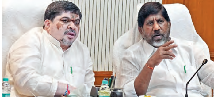
మంగళవారం మూసీ సబ్ కమిటీ సమీక్షలో డి.సి.ఎం భట్టి, మంత్రి పోన్నం

ప్రభాతవార్త ప్రధాన ప్రతినిధి, హైదరాబాద్, మార్చి 31: మూసీ పునర్నివసం పనులు ప్రజాస్వామ్య పద్ధతిలో కొనసాగుతాయని డిప్యూటీ సీఎం, మూసీ క్యాబినెట్ సబ్ కమిటీ చైర్మన్ భట్టి విక్రమార్కు మల్లు అన్నారు. మంగళవారం డాక్టర్ బి.ఆర్. అంబేద్కర్ సచివాలయంలో మంత్రి, మూసీ క్యాబినెట్ సబ్ కమిటీ సభ్యుల పాన్లను ప్రభాతర్ తో కలిసి మూసీ పునర్నివసం పనుల ప్రగతిపై సమీక్షించి అధికారులతో చర్చించారు. మార్చి 31 నుంచి ఏప్రిల్ 15 వరకు ఆన్ లైన్ లో మునిసిపాలిటీల మెయిల్ బాక్స్ ద్వారా మూసీ పునర్నివసంపై ప్రజల అభిప్రాయాలు స్వీకరిస్తామని తెలిపారు. ఆన్ లైన్ లో వచ్చిన విలువైన సలహాలు, సూచనలను అన్నింటినీ అధికారులతో చర్చించి విశ్లేషణ చేసి అభిప్రాయాలు వెల్లడించిన వారితో నేరుగా దళవారీగా సబ్ కమిటీ సభ్యులు సంప్రదింపులు చేస్తారని డిప్యూటీ సీఎం తెలిపారు. మూసీ నది ఒడ్డున ఉండాలి కేరళ అలయం పనులకు మార్చి 28న శంకుస్థాపన జరిగింది. ఆ రోజు నుంచి మూసీ ఫేస్ 1, ఫేస్ 2 వరకు చేయాలని పనులకు సంబంధించిన రోడ్ మ్యాప్ ను సిద్ధం చేసుకోవాలని డిప్యూటీ సీఎం అధికారులను ఆదేశించారు. డిఫెన్స్ భూములు, మూసీపునరావాస తులతో సంప్ర