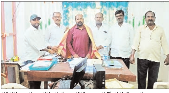
తదితరులు మర్యాదపూర్వకంగా కలిసి శాలువతో సత్కరించారు.