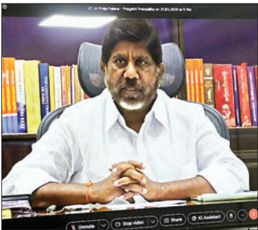
డిప్యూటీ సీఎం భట్టి విక్రమార్క మల్లు..

ప్రజాపాలన ప్రగతి ప్రణాళిక కార్యక్రమాన్ని కలెక్టర్లు సమీక్షిస్తూ విజయవంతంగా అమలు చేయాలి..