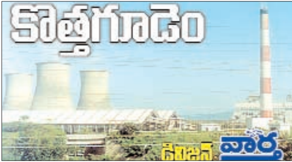
చుంచుపల్లి, జూలూరుపాడు, సుజాతనగర్