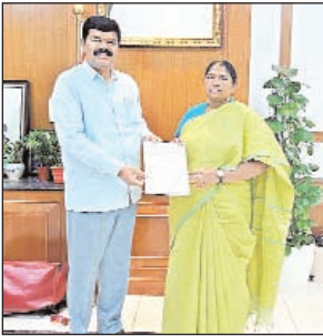
అంగన్వాడీ టీచర్ల పోస్టులను తక్షణమే భర్తీ చేయాలని వినతిపత్రంలో పొందుపరిచినట్లు, అంగన్వాడీ టీచర్ల వేతనాలను పెంచడంతో పాటు, వారు ఎదుర్కొంటున్న ఇతర సమస్యలను సానుకూలంగా పరిష్కరించాలని మంత్రి దృష్టికి తీసుకెళ్లినట్లు తెలిపారు. అన్ని సమస్యలతో పాటు వినతి పత్రం పై మంత్రి సీతక్క సానుకూలంగా స్పందించినట్లు గిరిజన ప్రాంతాల అభివృద్ధికి తమ ప్రభుత్వం కట్టుబడి ఉందని ఆమె పేర్కొన్నట్లు నియోజకవర్గంలోని రోడ్లు, బ్రిడ్జిలు, అంగన్వాడీ భవనాల సమస్యలతో పాటు, అంగన్వాడీ టీచర్ల సమస్యలను కూడా త్వరితగతిన పరిష్కరించేందుకు అవసరమైన చర్యలు తీసుకుంటామని మంత్రి హామీ ఇచ్చినట్లు ఆయన ప్రభాతవార్తకు తెలిపారు.

పినపాక నియోజకవర్గంలోని ప్రజా సమస్యల పరిష్కారం, మౌలిక సదుపాయాల కల్పనే ధ్యేయంగా ఎమ్మెల్యే పాయం వెంకటేశ్వర్లు మంగళవారం రాష్ట్ర పంచాయతీరాజ్, గ్రామీణాభివృద్ధి, స్త్రీ శిశు సంక్షేమ శాఖ మంత్రి ధనసరి అనసూయ (సీతక్క) ను సచివాలయంలో మర్యాదపూర్వకంగా కలిశారు. అనంతరం పినపాక నియోజకవర్గ అభివృద్ధికి సంబంధించిన పలు అంశాలపై ఆమెకు వినతి పత్రం అందజేసినట్లు తెలిపారు. పినపాక నియోజకవర్గంలోని మణుగూరు, పినపాక, అశ్వాపురం, కరకాగూడెం, గుండాలు, అల్లపల్లి, బూర్గంపాడు సహా మొత్తం ఏడు మండలాల పరిధిలో మారుమూల ఏజెన్సీ గ్రామాలకు రవాణా సౌకర్యాలను మెరుగుపరచాలని, పంచాయతీరాజ్ శాఖ పరిధిలోని ప్రధాన, అంతర్గత (బీటీ) రహదారుల నిర్మాణానికి నిధులు మంజూరు చేయాలని, ముఖ్యంగా కనెక్టివిటీ లేని ప్రాంతాల్లో హైలెవల్ బ్రిడ్జిల (వంతెనలు) ఏర్పాటుపై ప్రత్యేక శ్రద్ధ చూపాలని కోరినట్లు, మహిళా, శిశు