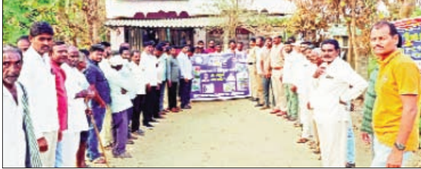
తిరుమలాయపాలెం, మార్చి 31(ప్రభాత వార్త)