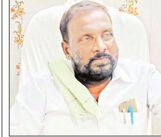
అయిన గ్రామసభల నిర్వహణపై పలు కీలక సూచనలు చేశారు. గ్రామసభలను సమయానికి నిర్వహిస్తూ ప్రజల సమస్యలను నమోదు చేసి, వెంటనే పరిష్కారానికి చర్యలు తీసుకోవాలని సూచించారు. ప్రభుత్వ పథకాల అమలు, గ్రామాభివృద్ధి పనులపై సమగ్ర చర్చ జరిపి, ప్రజలకు పూర్తి వివరాలు తెలియజేయాలని ఆదేశించారు. గ్రామస్థులందరూ గ్రామసభలకు హాజరై తమ సమస్యలను వెల్లడించాలని ఎంపిడివో కోరారు.

ప్రజా పాలన ప్రగతి ప్రణాళిక కార్యక్రమంలో భాగంగా ఏప్రిల్ 2 న మండల పరిధిలోని గ్రామ పంచాయతీలలో గ్రామసభలు నిర్వహించనున్నట్లు ఎంపిడివో వెంకటేశ్వరరావు తెలిపారు. ఎంపిడివో కార్యాలయంలో మంగళవారం సెక్రటరీలతో టెలి కాన్ఫరెన్స్ నిర్వహించిన ఆయన గ్రామసభల నిర్వహణపై పలు కీలక సూచనలు చేశారు. గ్రామసభలను సమయానికి నిర్వహిస్తూ ప్రజల సమస్యలను నమోదు చేసి, వెంటనే పరిష్కారానికి చర్యలు తీసుకోవాలని సూచించారు. ప్రభుత్వ పథకాల అమలు, గ్రామాభివృద్ధి పనులపై సమగ్ర చర్చ జరిపి, ప్రజలకు పూర్తి వివరాలు తెలియజేయాలని ఆదేశించారు. గ్రామస్థులందరూ గ్రామసభలకు హాజరై తమ సమస్యలను వెల్లడించాలని ఎంపిడివో కోరారు.