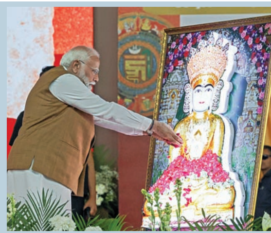
మహావీరజయంతి సందర్భంగా మంగళవారం గాంధీనగర్లో ఆయన చిత్రపటం వద్ద నివాళులర్పిస్తున్న ప్రధాని మోడీ