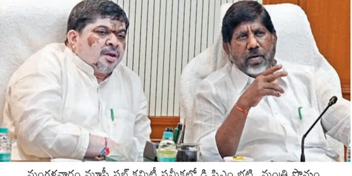
మంగళవారం మూసీ సబ్ కమిటీ సమీక్షలో డి.సిఎం భట్టి, మంత్రి పొన్నం

ప్రభాతవార్త ప్రధాన ప్రతినిధి, హైదరాబాద్, మార్చి 31: మూసీ పునర్నివసం పనులు ప్రజాస్వామ్య పద్ధతిలో కొనసాగుతాయని డిప్యూటీ సీఎం, మూసీ క్యాబినెట్ సబ్ కమిటీ చైర్మన్ భట్టి విక్రమార్కు మల్లు అన్నారు. మంగళవారం ధాక్షిణ్య బి.ఆర్ అంబేద్కర్ నవీనాలయంలో మంత్రి, మూసీ క్యాబినెట్ సబ్ కమిటీ సభ్యుల పాస్టం ప్రభాకర్ తో కలిసి మూసీ పునర్నివసం పనుల ప్రగతిపై సవివరంగా అధికారులతో చర్చించారు. మార్చి 31 నుంచి ఏప్రిల్ 15 వరకు ఆన్ లైన్ లో మూసీ అప్లైడ్ మెయిల్ ఐడి ద్వారా మూసీ పునర్నివసంపై ప్రజల అభిప్రాయాలు స్వీకరిస్తామని తెలిపారు. ఆన్ లైన్ లో వచ్చిన విలువైన సలహాలు, సూచనలను అన్నింటినీ అధికారులతో కూర్చోని విశ్లేషణ చేసి అభిప్రాయాలు వెల్లడించిన వారితో నేరుగా దళవారంగా సబ్ కమిటీ సభ్యులు సంప్రదింపులు చేస్తారని డిప్యూటీ సీఎం తెలిపారు. మూసీ నది ఒడ్డున ఓంకారేశ్వర ఆలయం పనులకు మార్చి 28 న శంకుస్థాపన జరిగింది. ఆ రోజు నుంచి మూసీ ఫేస్ 1, ఫేస్ 2 వరకు చేయూర్చిన పనులకు సంబంధించిన రోడ్ మ్యాప్ ను సిద్ధం చేసుకోవాలని డిప్యూటీ సీఎం అధికారులను ఆదేశించారు. డి.పా.స్ బహుములు, మూసీపునరావాలి తులతో సంప్ర