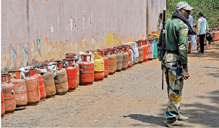
మంగళవారం రాంచీలో ఓ గ్యాస్ ఏజెన్సీ వద్ద క్యూలైన్లో ఉన్న ఖాళీ సిలిండర్ల వద్ద పహారా కాస్తున్న పోలీసు

చేస్తుందని ప్రశ్నించారు. తాగడానికి కూడా నీళ్లు లేకుండా చేస్తారా అని నిలదీశారు. శ్రీశైలం నీటి వినియోగం విషయంలో హైకోర్టు ఇచ్చిన స్పష్టమైన ఆదేశాలు ఉన్నాయని గుర్తు చేశారు. ఇప్పటికైనా అక్రమంగా నీటిని తరలించడాన్ని ఆపాలని ఎపి ప్రభుత్వానికి హితవు చెప్పారు. శ్రీశైలంలో తెలంగాణకు 64 శాతం జలా ఉందని ఖమ్మం, నల్గొండ, పాలమూరు జిల్లాల రైతుల హక్కులు కాలరాచి ఇవ్వాలని హెచ్చరించారు. కాగా.. ఆదేవిధంగా నాగార్జునసాగర్లో 170 టీఎంసీల నీటి నిల్వలు ఉన్నాయి. వేసవి అవసరాలు పెరిగితే ప్రాజెక్టులో నీటి నిల్వలు వేగంగా తరిగిపోయే ప్రమాదం ఉంది.