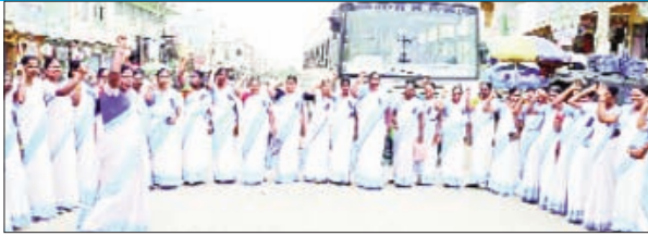
ముఖ్యమంత్రి రేవంత్ రెడ్డి పెద్ద మనసుతో స్పందించి ఆశా కార్యకర్తల సమస్యలను తక్షణమే పరిష్కరించాలని డిమాండ్ చేశారు. ఈ కార్యక్రమంలో జిల్లా మండల స్థాయి ఆశా కార్యకర్తలు పాల్గొన్నారు.