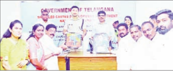
మిర్యాలగూడ, మార్చి 31. ప్రభాత వార్త:..