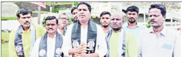
యాదగిరిగుట్ట మార్చి 31, (ప్రభాత వార్త) :