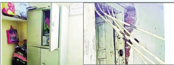
రాజాపేట మార్చి 31 ప్రభాతవార్త