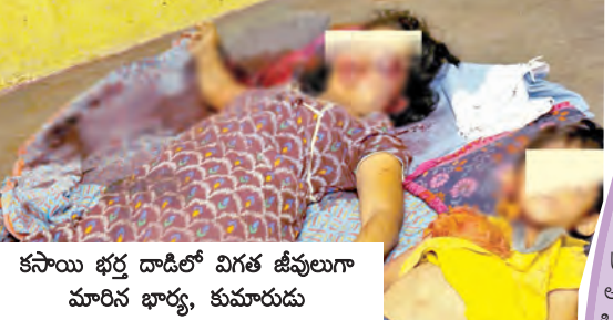
కనాయి భర్త దాడిలో విగత జీవులుగా మారిన భార్య, కుమారుడు